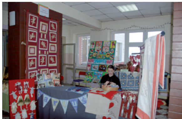
Patchworki z Godziszki.