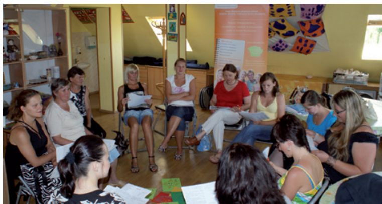
Trening umiejętności i kompetencji społecznych.

Twoja inicjatywa gwarancją sukcesu – program aktywnej integracji w gminie Buczkowice Projekt współfinansowany przez Unię Europejską ze środków Europejskiego Funduszu Społecznego w ramach Programu Operacyjnego Kapitał Ludzki 2007-2013