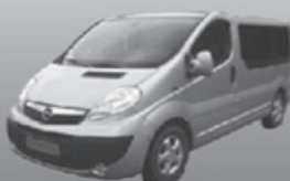
Opel Vivaro 9 osobowy