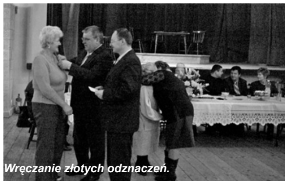
Wręczenie złotych odznaczeń.