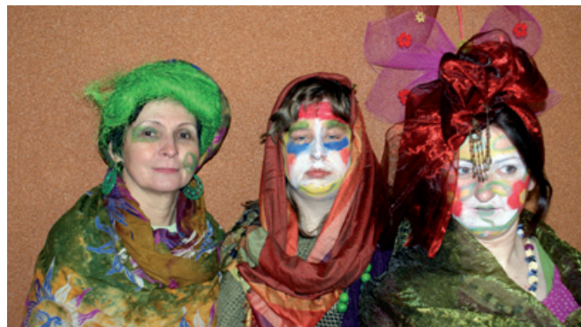
Warsztaty z charakteryzacji.

Dobiega końca rok 2010, a tym samym kończy się powoli realizacja programu aktywnej integracji pt. „Rodzina wielopokoleniowa – kompleksowe wsparcie funkcjonowania rodzin w gminie Buczkowice”.