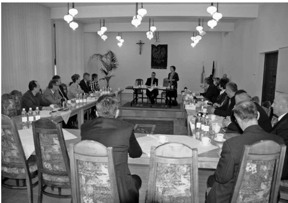
Pierwsza sesja nowej Rady Gminy.