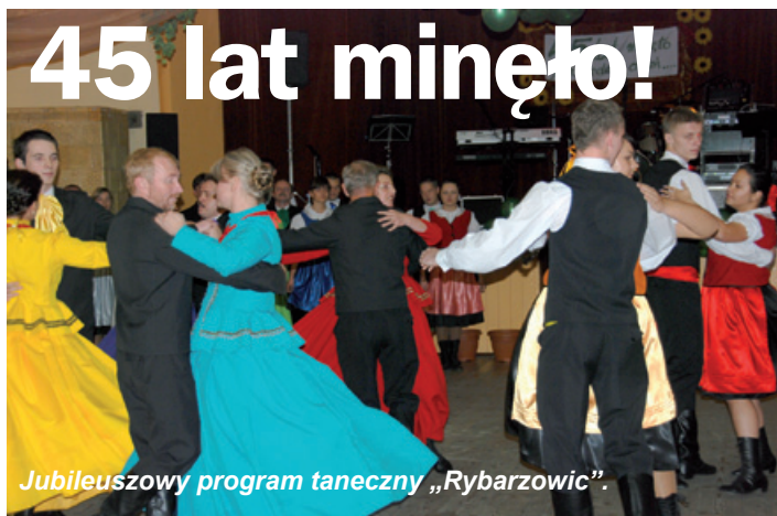
Jubileuszowy program taneczny „Rybarzowic”.