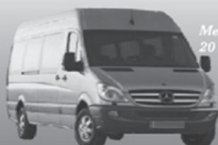
Mercedes Sprinter 20 osobowy