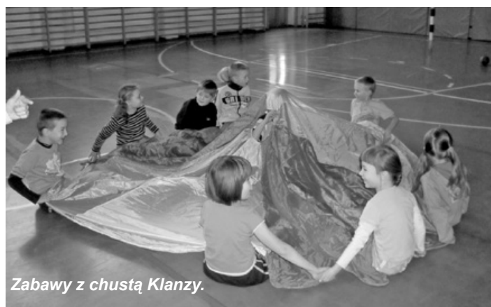
Zabawy z chustą Klanzy.