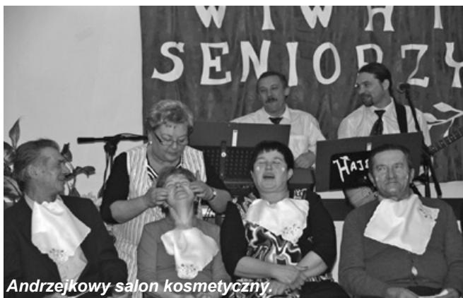
Andrzejkowy salon kosmetyczny.