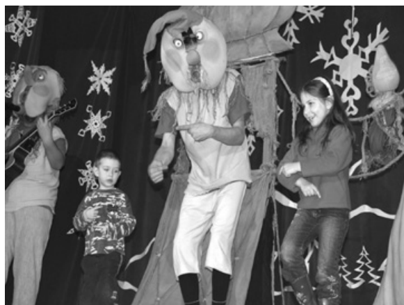
Spektakl „Sznurkowe skrzaty”.

Po wesołych harcach nadszedł czas na powitanie św. Mikołaja, który pojawił się w otoczeniu świty aniołków i diabełków. Mikołaj po rozmowie z dziećmi rozpoczął rozdawa-