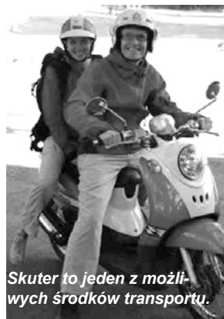
Skuter to jeden z możliwych środków transportu.