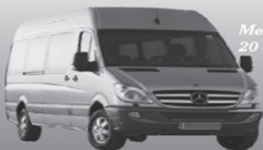
Mercedes Sprinter 20 osobowy