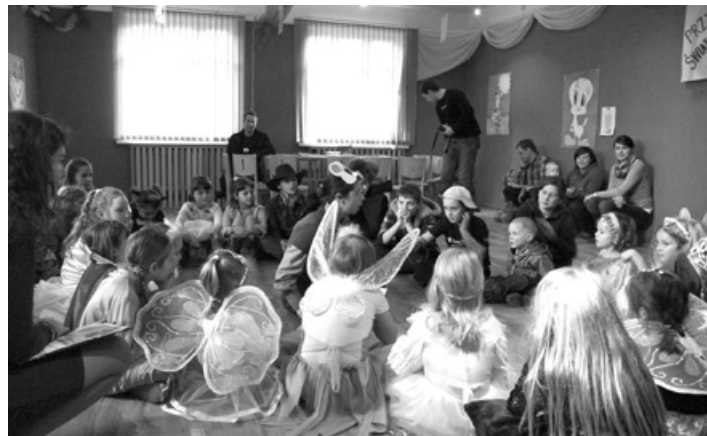
Spotkanie bajkowych postaci.

Świetlica realizuje także różnego rodzaju „zadania specjalne”, np. bale dla najmłodszych. Jeden z nich – ostatekowy bal karnawałowy od-