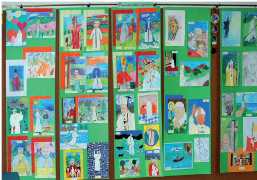
Prace wyróżnione i nagrodzone.