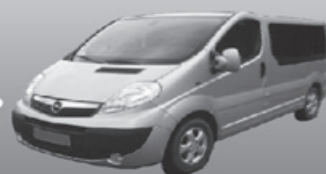
Opel Vivaro 9 osobowy