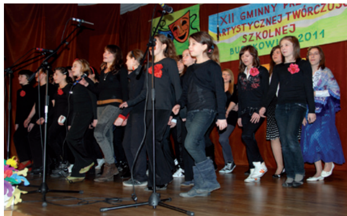
Laureat przeglądu – chór z Rybarzowic.

Jury przyznało również nagrodę specjalną „za odwagę sce-