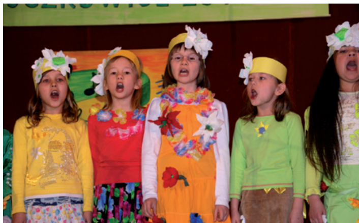
Śpiewają „Siedmiolatki w kwiatki” z Godziszki.

17-18 marca na scenie Sokolni w Buczkowicach odbył się XII Gminny Przegląd Artystycznej Twórczości Szkolnej, zorganizowany przez Gminny Ośrodek Kultury w Buczkowicach. Konkurs miał na celu przede wszystkim konfrontację osiągnięć szkół z terenu naszej gminy, a także aktywny udział młodzieży. Uczestnicy przeglądu zaprezentowali widowni swoje różnorodne talenty poczynawszy od wokalnych poprzez taneczne, aż po teatralne, zachwycając zgromadzoną publiczność.