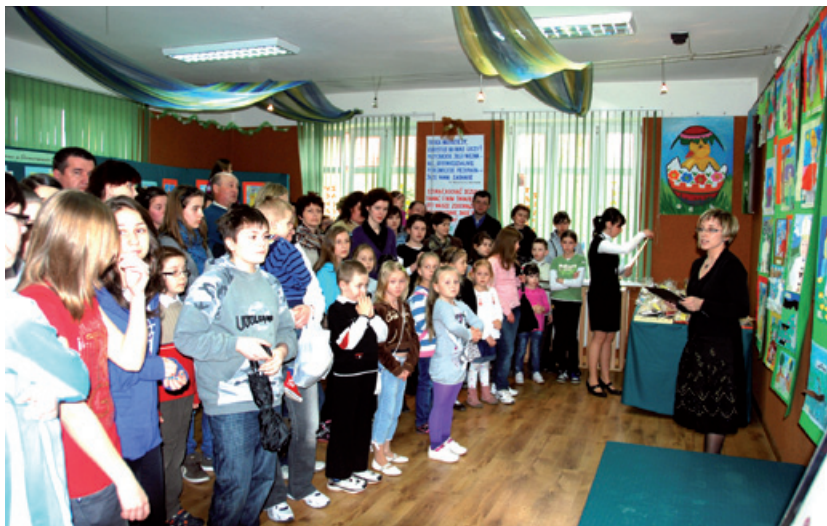
Uroczyste wręczenie nagród laureatom konkursu.