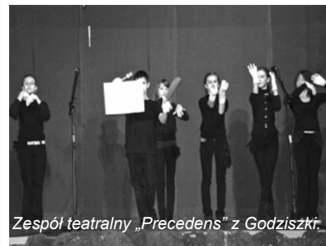
Zespół teatralny „Precedens” z Godziszki.