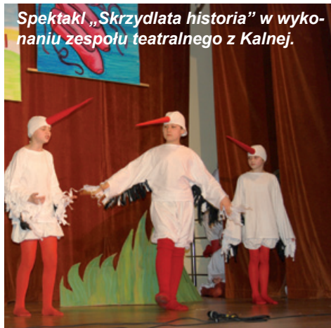
Spektakl „Skrzydłata historia” w wykonaniu zespołu teatralnego z Kalnej.

GAZETA GMINNA, bezpłatny biuletyn informacyjny Gminy Buczkowice