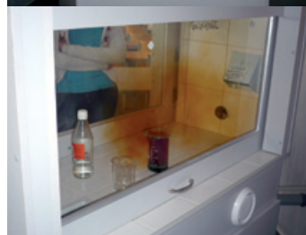
Pracownia chemiczna w ZSO w Buczkowicach.