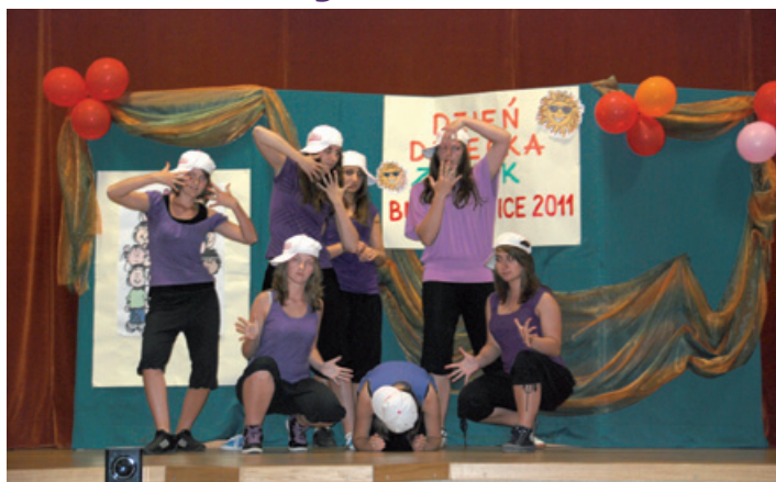
Hip-hop w wykonaniu „Sun Shine” z Kalnej

1 czerwca to wyjątkowa data zwłaszcza dla najmłodszych. Tego dnia od 1952 r. obchodzimy Dzień Dziecka w Polsce i w innych krajach bałtyckich. Jego inicjatorem była organizacja The International Union for Protection of Childhood, której celem było zapewnienie bezpieczeństwa młodym ludziom z całego świata.