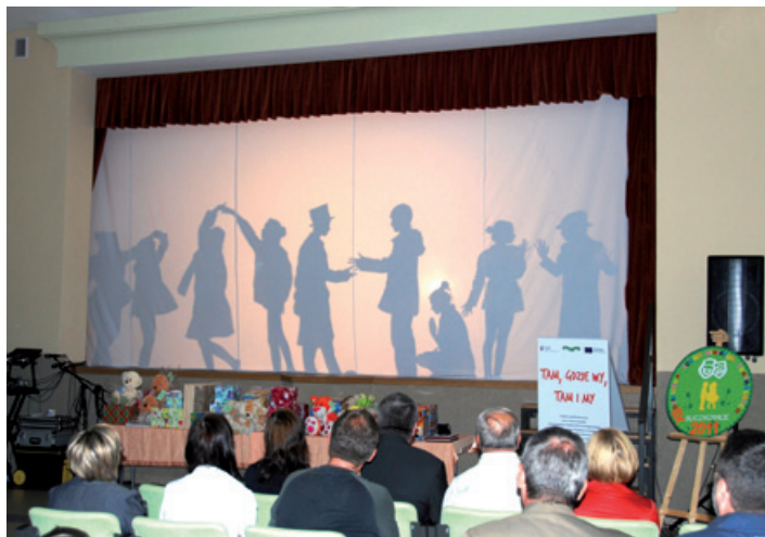
Spektakl „Za plotem” w wykonaniu słowackiej grupy teatralnej.