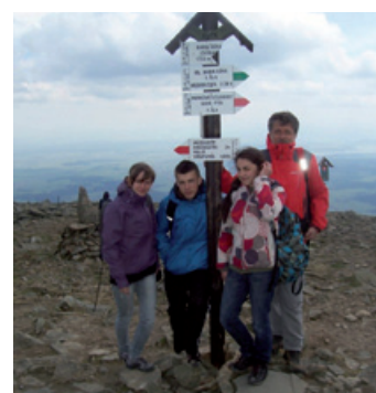
Buczkowiccy turyści zdobyli szczyt Babiej Góry.