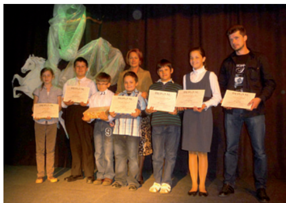
Laureaci XI Wojewódzkiego Konkursu Recytatorskiego.

uczeń miał możliwość obejrzenia wozu bojowego od środka oraz przejazdu nim po ulicach Kalnej. Klasy I-III wzięły również udział w terenowych podchodach, w których wszyscy wykazali się dużymi umiejętnościami z zakresu obserwacji, wiedzy matematycznej i przyrodniczej oraz kulinarnej. W tym samym czasie uczniowie kl. IV – IG na bo-