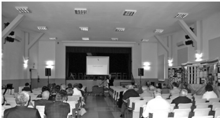
Prezentacja multimedialna przygotowana przez prezesa TSK „Zagroda” Józefa Steca.