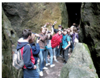
Buczkowice na wycieczce w Górach Stołowych.