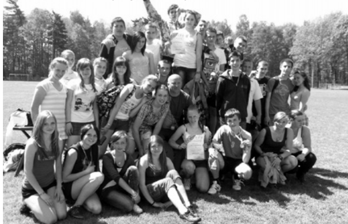
Skład buczkowickiej reprezentacji.