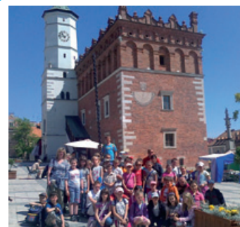
Rybarzowice na wycieczce w Sandomierzu.