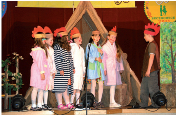
Wyróżniony spektakl „O kurczę” w wykonaniu zespołu teatralnego GOK „Dzieciaki ze zgranej paki”.