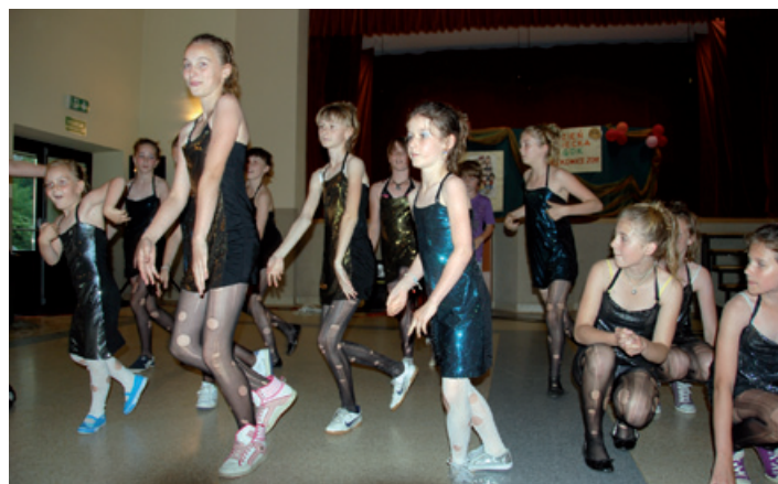
Popisy taneczne w wykonaniu „Parazytu” z Lipowej.

Odbył się też pokaz akcji ratowniczo-gaśniczej w wykonaniu strażaków Państwowej Straży Pożarnej