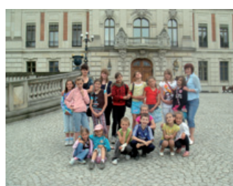
Kalna na wycieczce w Pszczynie.