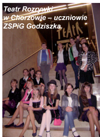
Teatr Rozrywki w Chorzowie – uczniowie ZSPiG Godziszka.