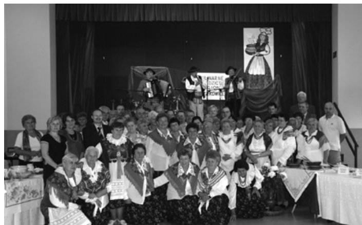
Uczestnicy spotkania kulinarnego.

Jak co roku panie z KGW dały popis swych kulinarnych talentów. Wszyscy zaproszeni goście nie mogli oprzeć się przygotowa-