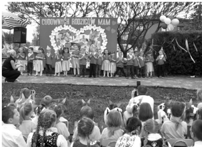
Występ najmłodszej grupy przedszkolaków.