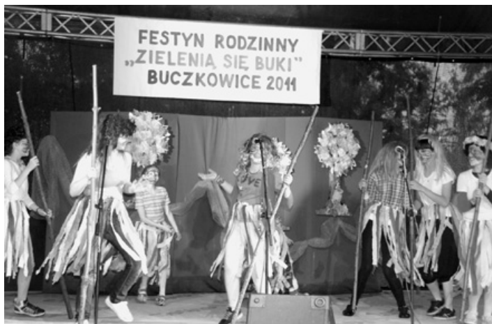
„Hakkuna matata” w wykonaniu zespołu wokального „Tutta la forza”.