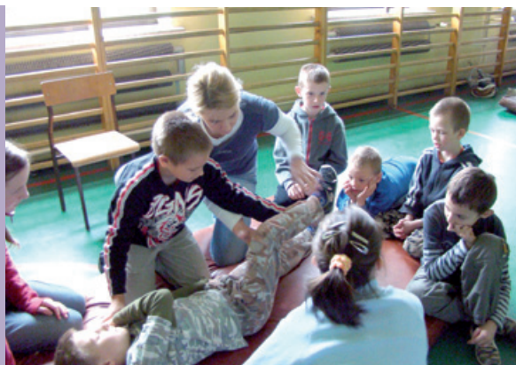
Lekcja udzielania pierwszej pomocy.