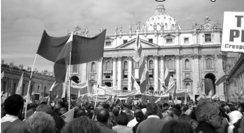
Miliony ludzi na placu św. Piotra.

Deo Gratias – takie słowa, wydrukowane na cieniutkim materiale, poleciały w przestworza dzięki balonikom wypełnionym helem, dokładnie 1 maja 2011 roku, kiedy Ojciec Święty Benedykt XVI ogłosił błogosławionym Jana Pawła II.