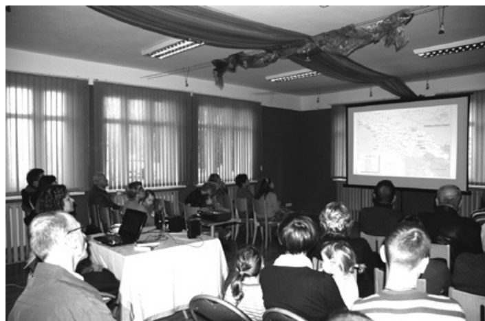
Prezentacja Agnieszki Wojnowskiej.