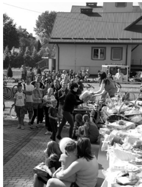
Nagrody dla uczestników rajdu.

24 września rano z placu zabaw przy Urzędzie Gminy w Buczkowicach ścieżką rowerową wyruszyli w stronę Szczyrku zawodnicy XI Rodzinnego Rajdu Rowerowego zorganizowanego przez Gminny Ośrodek Kultury w Buczkowicach. 155 pasjonatów dwuśladów z całej gminy i spoza niej utworzyło 25 drużyn, składających się z członków rodzin, grup szkolnych, przyjaciół oraz znajomych, które co 5 minut wyruszały na trasę.