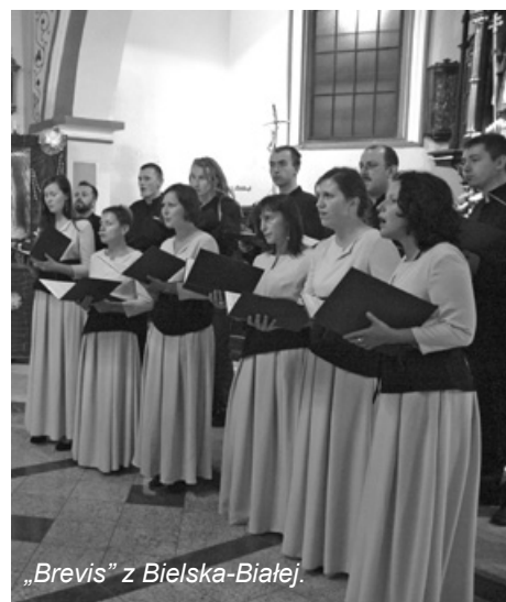
„Brevis” z Bielska-Białej.