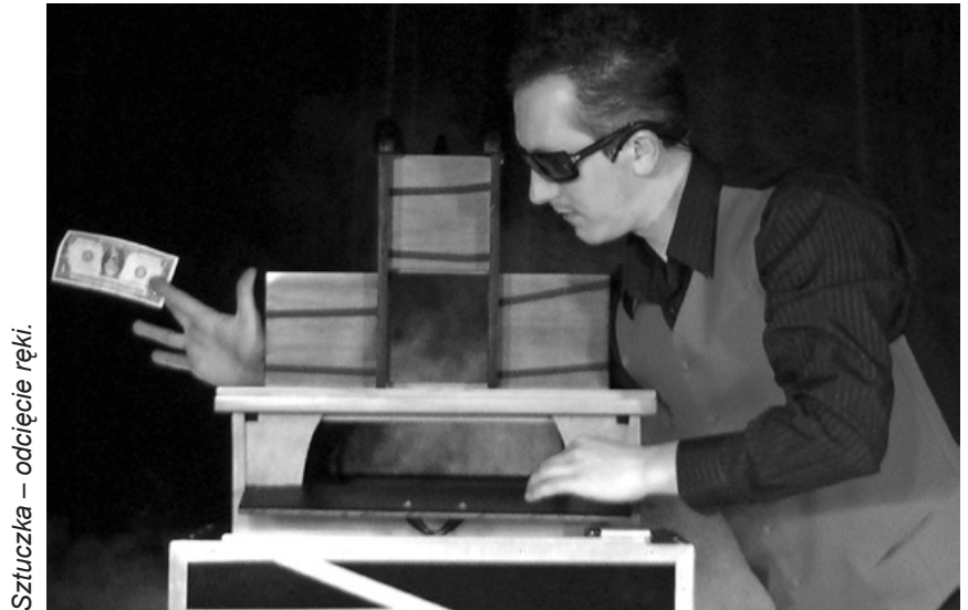
Sztuczka – odciecie ręki.