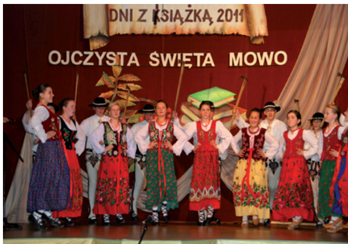
Zespół Regionalny „Tatry”.