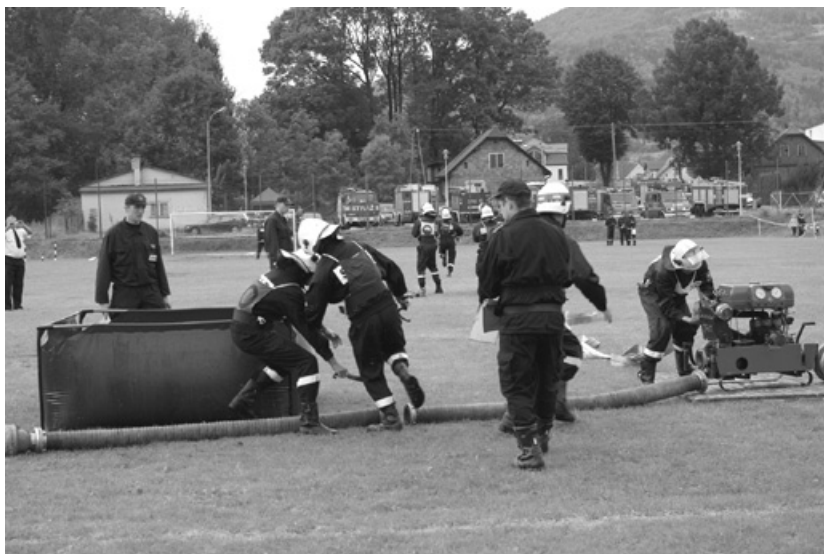
Ćwiczenia bojowe drużyn męskich.

Na zawodach i rozdaniu nagród byli obecni również przedstawi-