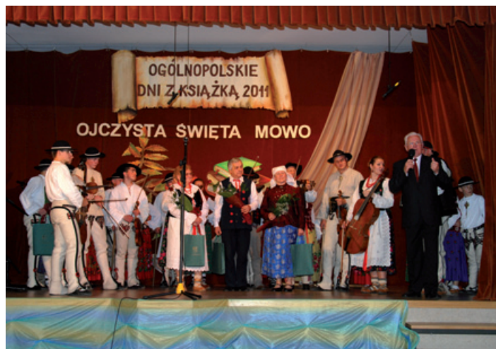
Uczestnicy gawędziarskiej gali z autorem słownika.