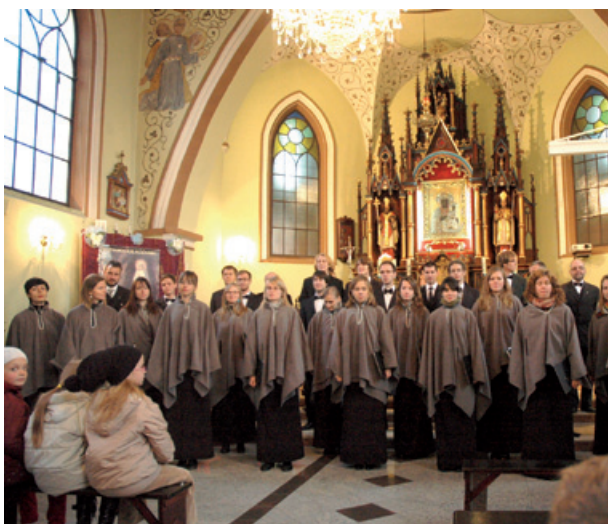
Chór z Gdańska.