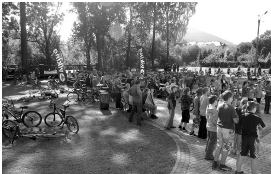
Meta rajdu – teren przy Sokolni w Buczkowicach