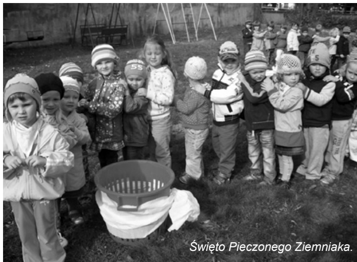
Święto Piezonego Ziemniaka.

W bieżącym roku szkolnym, dzięki przychylności wójta gminy Józefa Caputy, w przedszkolu został otwarty siódmy oddział przedszkolny. Decyzja ta umożliwiła przyjęcie wszystkich dzieci, które zostały zapisane. Obecnie do przedszkola uczęszcza 160 dzieci, które zostały podzielone na siedem grup. Siódma grupa przebywa na drugim piętrze – po wyremontowaniu i adaptacji sali na potrzeby przedszkola i zakupieniu wyposażenia do nowego oddziału.