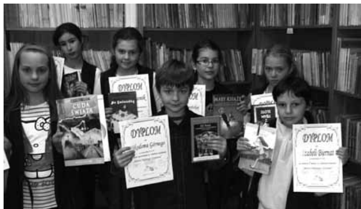
Laureaci konkursu „Mistrz pięknego czytania”.