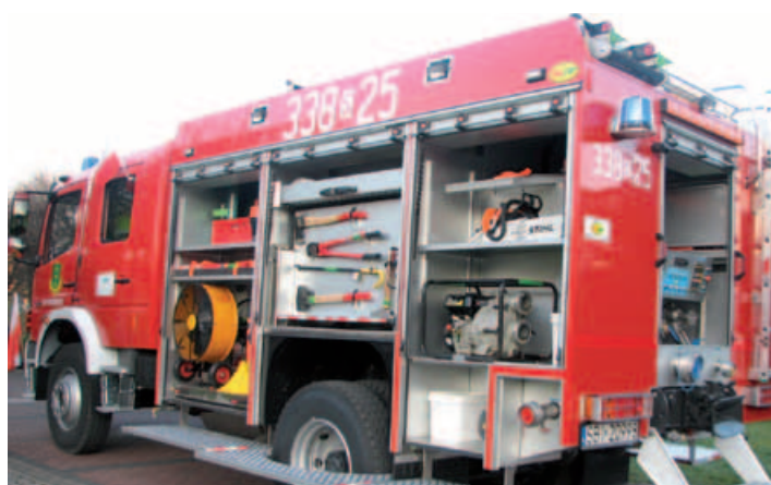
Nowoczesny samochód buczkowickiej straży.