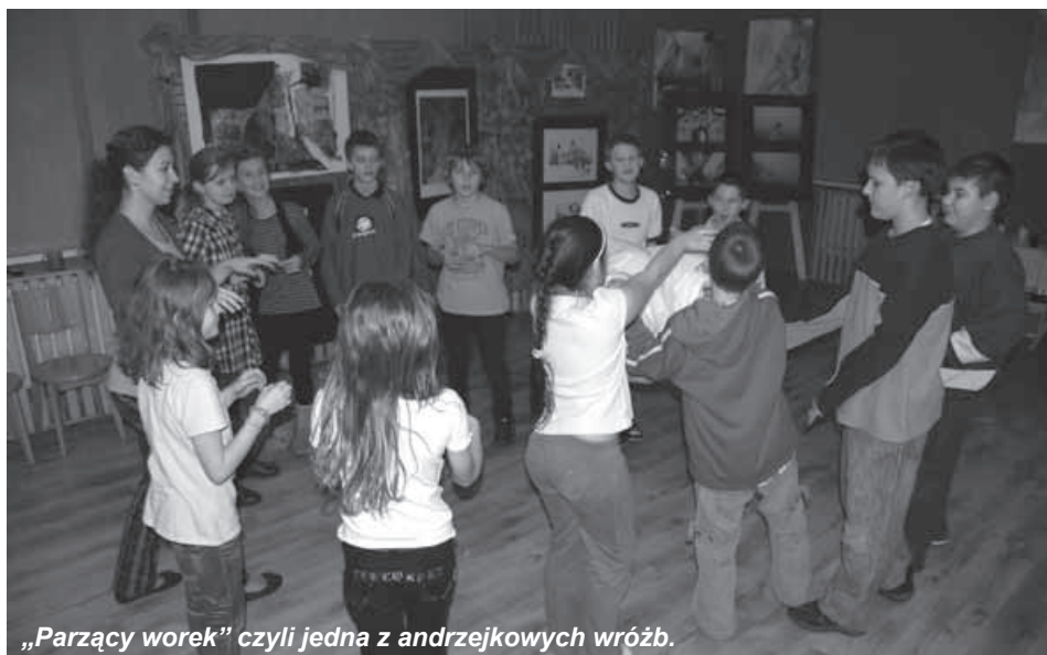
„Parzący worek” czyli jedna z andrzejkowych wróżb.

Kilka dni później przyszła pora na zabawę andrzejkową dla najmłodszych przyjaciół GOK. „Hokus-pokus, czary-mary, niech się spełnią andrzejkowe czary” – tak czarownica Semira przywitała dzieci, ich rodziców i dziadków w sobotnie popołudnie 26 listopada, zapraszając dzieci w wieku od 3 do 6 lat do krainy magii i czarów, która tego dnia mieściła się w budynku Sokolni w Buczkowicach. Na początku czarownica Semira i Hogata zapoznały dzieci z andrzejkowymi zwyczajami i tradycjami. Dzieci powtarza-