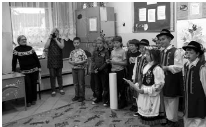
Wizyta gości z Orla.