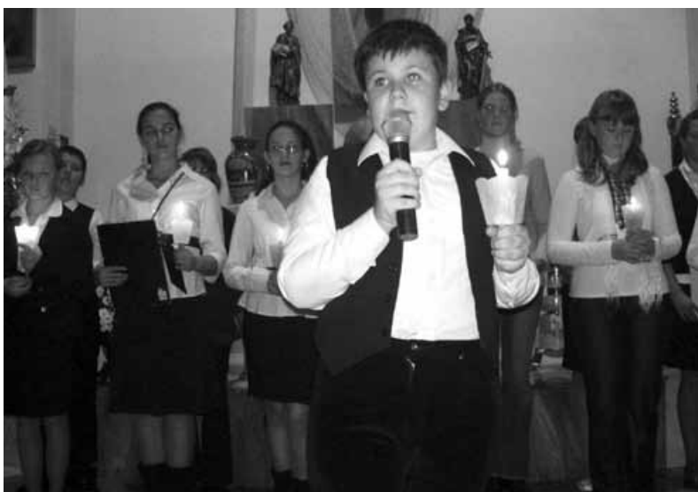
Spektakl o Janie Pawle II.