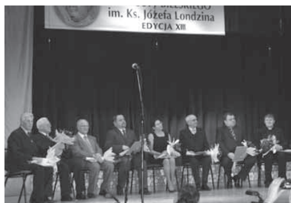
Nominowani do nagrody starosty bielskiego.