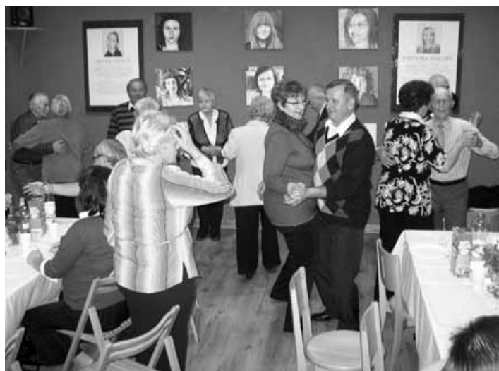
Zabawa andrzejkowa w GOK.