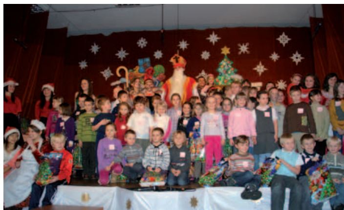
Spotkanie z Mikołajem i prezentami.