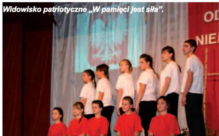
Widowisko patriotyczne „W pamięci jest siła”.