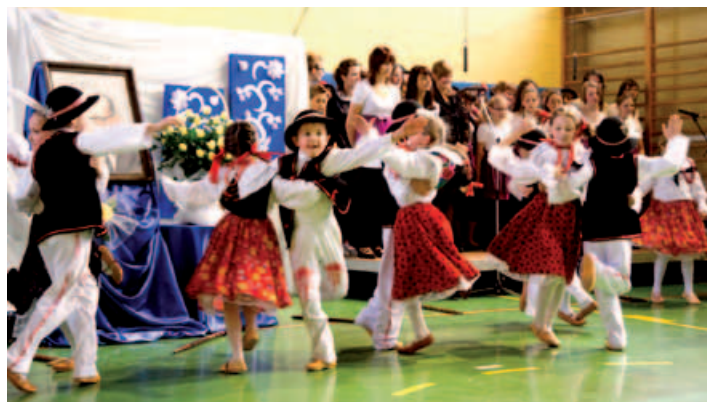
Zespół regionalny „Gronicki”.