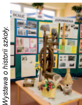
Wystawa o historii szkoły.

19 listopada był dniem wyjątkowym dla wszystkich mieszkańców Godziszki. Tego dnia obchodzono stulecie istnienia Szkoły Podstawowej w tej miejscowości.