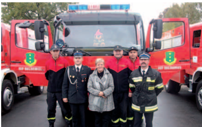
Oficjalny odbiór samochodu przez przedstawicieli zarządu OSP w Buczkowicach wraz z komendantem gminnym.