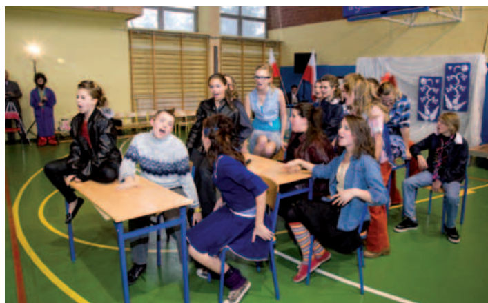
Zespół teatralny „Precedens”.