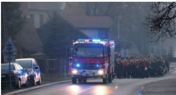
Przemarsz pod pomnik przy ulicy Wyzwolenia w Buczkowicach.