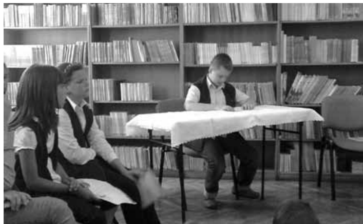
II etap pięknego czytania w szkolnej bibliotece.