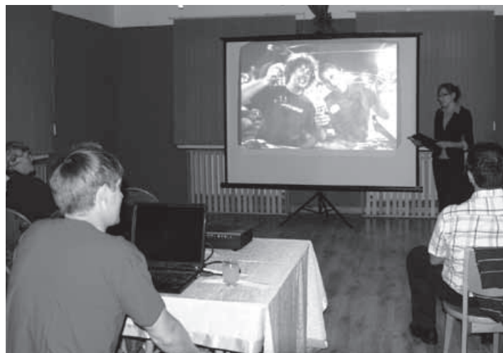
Prezentacja w buczkowickim ośrodku kultury.