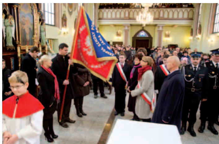
Uroczyste przekazanie sztandaru dla szkoły w Godziszce.