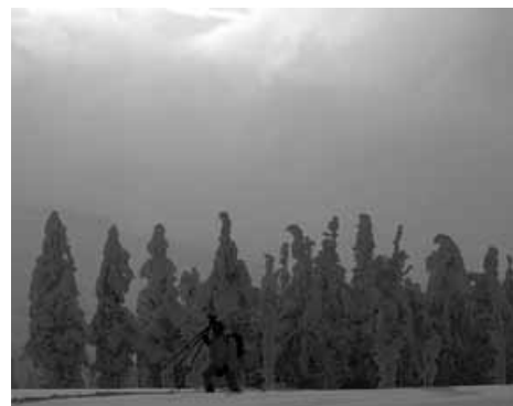
Podczas pleneru fotograficznego.

M.B. Nie czuję się fotografem, zawodowcem, wciąż traktuję fotografię jako zainteresowanie i sposób spędzania wolnego czasu. A tymczasem trzeba załatwiać różne sprawy związane z wystawami, publikacjami, przygotowaniem