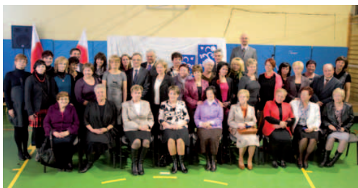
Jubileuszowe spotkanie kadry nauczycielskiej.