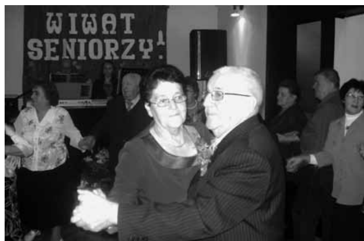
Taniec jubilatów z Godziszki.

wał dla swoich członków Dzień Seniora. W spotkaniu uczestniczyło ok. 70 osób. Jak co roku były występy dzieci szkolnych, które przedstawiły scenkę pt. „Senior u lekarza”, a dwie uczennice zachwyciły wszystkich przepięknym śpiewem. Uczestnicy spotkania zostali ugostzeni obiadem, kawą i ciastem. Dyskusji poddano fakt, czy w przyszłości organizować takie spotkania w soboty czy w tygodniu – większość była zdania, że jednak lepsze są soboty. Zarząd weźmie to pod uwagę. Spore zainteresowanie wzbudził katalog wczasów na rok 2012. Bawiliśmy się do późnego wieczora.