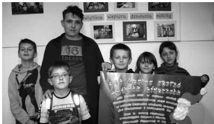
Akcja „Mikołaj 2011” w Godziszce.