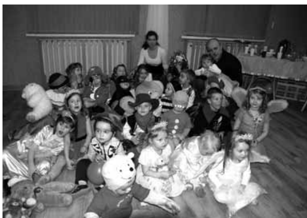
Najmłodsi przebierańcy karnawałowego balu.

Tradycyjnie, GOK w Buczkowicach organizuje zabawy karnawałowe dla dzieci i młodzieży. W tym roku odbyły się aż dwie – najpierw bal przebierańców dla najmłodszych 31 stycznia oraz dyskoteka dla dzieci ze szkoły podstawowej 9 lutego.