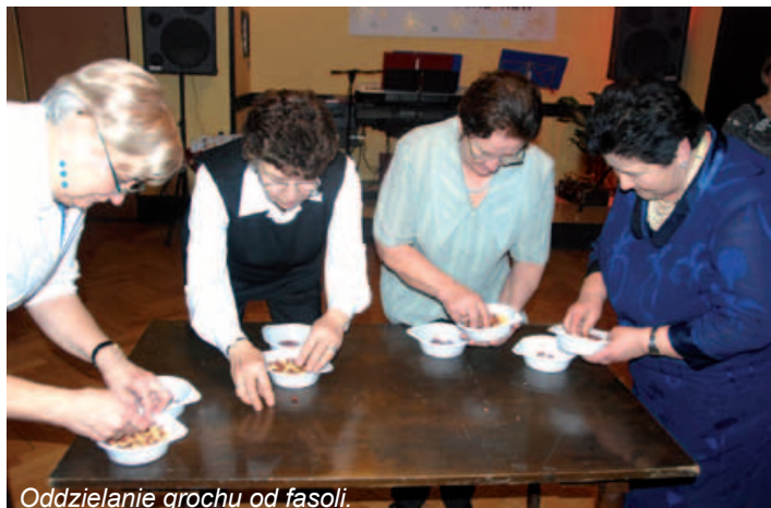
Oddzielanie grochu od fasoli.