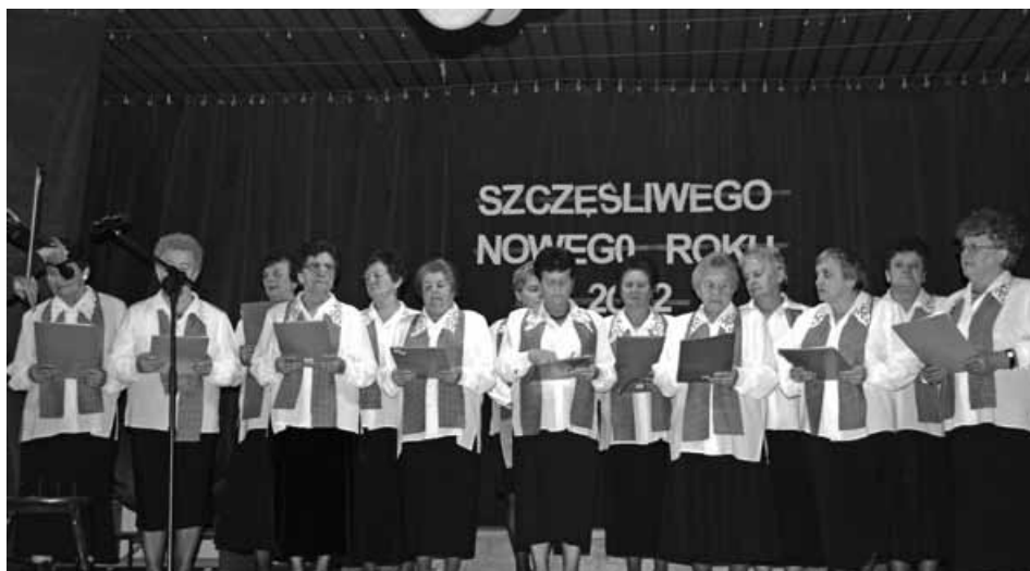
Chór „Rybarska nutka”.

Tradycyjne spotkanie noworoczne odbyło się w sali Domu Ludowego w Rybarzowicach 6 stycznia. Organizatorzy – Koło Gospodyń Wiejskich oraz Koło Emerytów, Rencistów i Inwalidów – zadbali o miłą atmosferę.