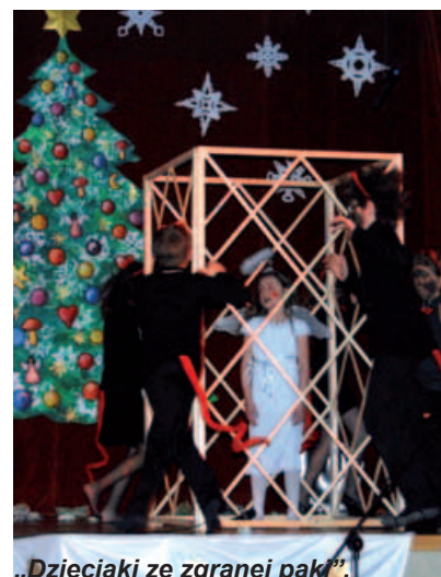
„Dzieciaki ze zgranej paki”.