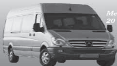
Mercedes Sprinter 20 osobowy