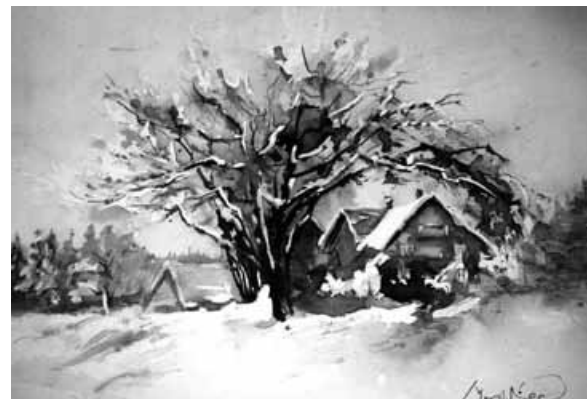
Na zdjęciach: Beskidzkie pejzaże Jana Mrowca.