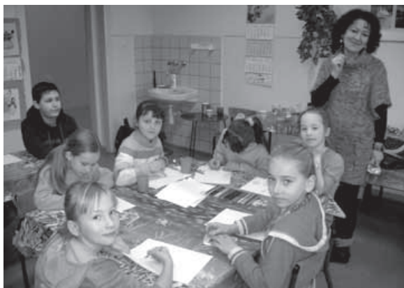
Uczestnicy zajęć plastycznych.