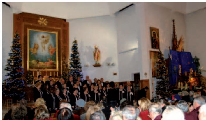
Kolęduje chór „Echo” z Bielska-Białej.