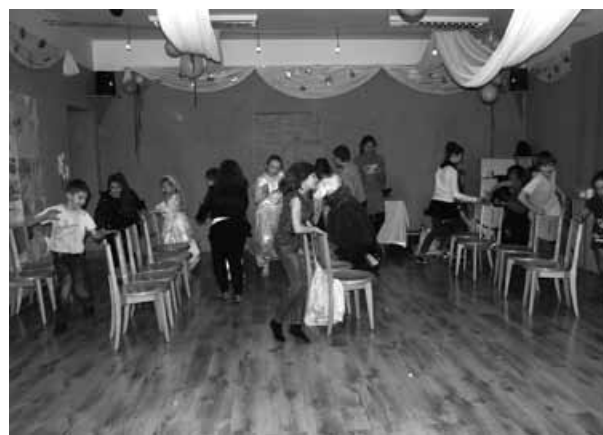
Zabawa – „wyścig rodzin” podczas dyskoteki.

Obie imprezy cieszyły się dużym zainteresowaniem.