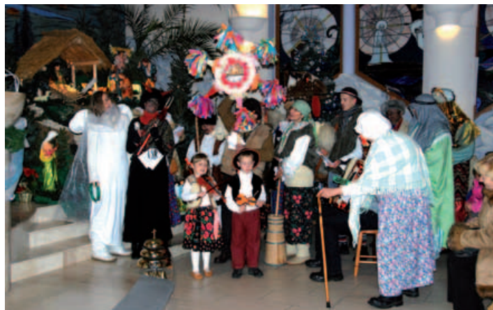
Przebierańcy składają powinszowania.