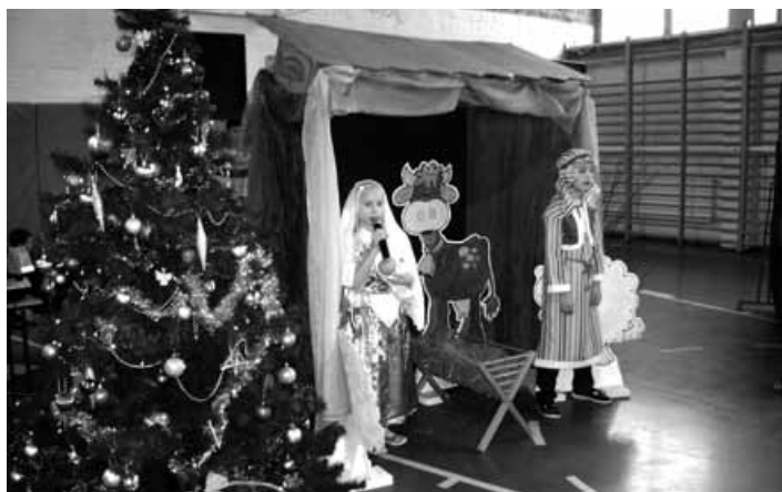
Jasłka podczas wieczoru kolęd w Godziszce.