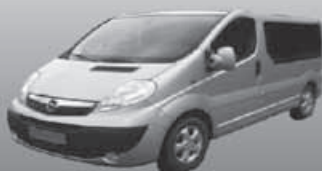
Opel Vivaro 9 osobowy