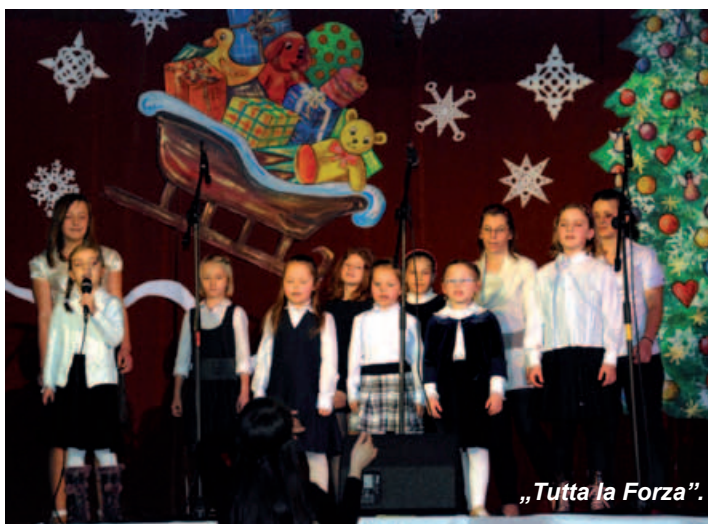
„Tutta la Forza”.

Gminny Ośrodek Kultury w Buczkowicach oferuje szeroką gamę zajęć artystycznych i kół zainteresowań, prowadzonych przez profesjonalnych instruktorów. W zajęciach tych uczestniczy ponad 300 osób. 15 stycznia członkowie zespołów artystycznych GOK zaprezentowali przed lokalną publicznością efekty swojej systematycznej pracy.