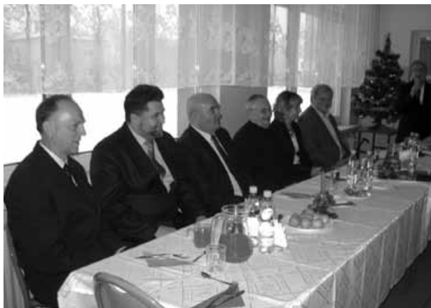
Goście spotkania noworocznego.