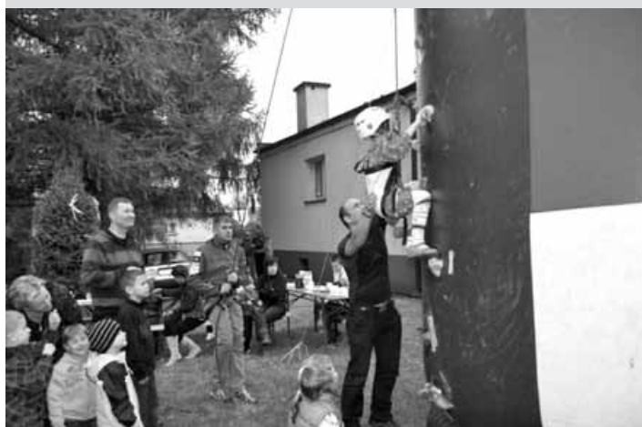
Ścianka wspinaczkowa budziła największe emocje.