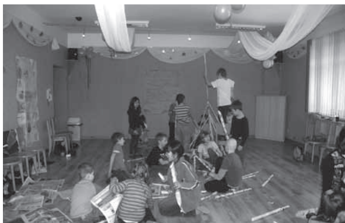
Uczestnicy ferii w czasie zabaw z gazetą.

Gminny Ośrodek Kultury wciąż jest otwarty i czeka na wszystkich, którzy zechcą się z nim zaprzyjaźnić. Zapraszamy!