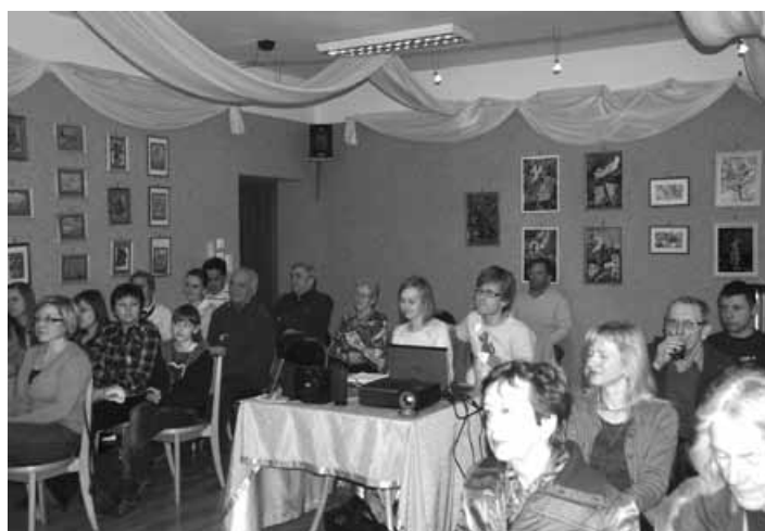
Uczestnicy i prelegenci slajdów o Indiach i Nepalu.

jące zdjęcia, na których niesamowita kultura i wspaniała architektura mieszały się z bałaganem i nieopisanym brudem. Widzowie prezentacji: zgromadzona rodzina prelegentów, zaproszeni goście oraz pozostali amatorzy dalekich podróży z zainteresowaniem oglądali kolejne slajdy z miast i wiosek, tj. Kathmandu, Pokhara, Varanasi, Agra, Delhi, Udaipur, Mumbai oraz z zachwycającego niebieskiego miasta Jodhpur, podziwiając znane zabytki i budowle – Taj Mahal, Bramę Indii,