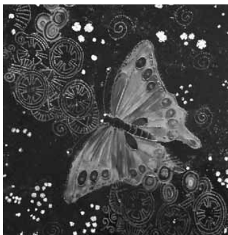
Malarstwo na szkłe.