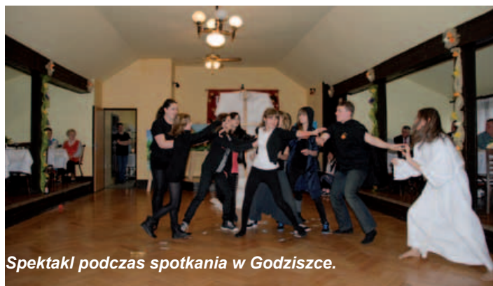
Spektakl podczas spotkania w Godziszce.