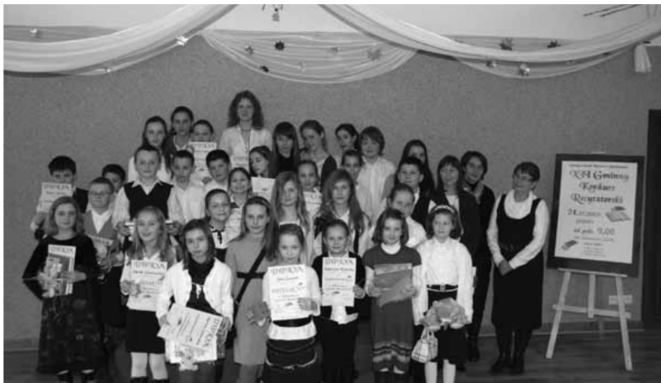
Uczestnicy gminnego etapu konkursu wraz z jurorami.

Wskazani przez jury deklamatorzy wzięli udział w następnym etapie recytatorskich potyczek, które odbyły się 2 marca w Centrum