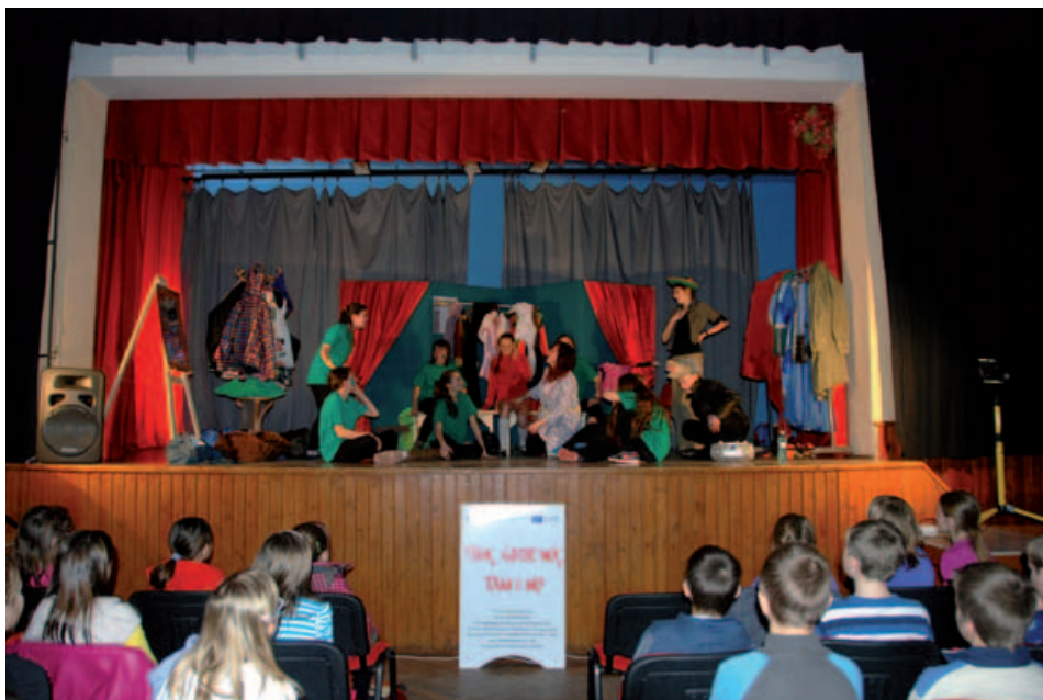
Występ w Zákamenném.

się doping, jaki otrzymali od damskiej części zespołu.