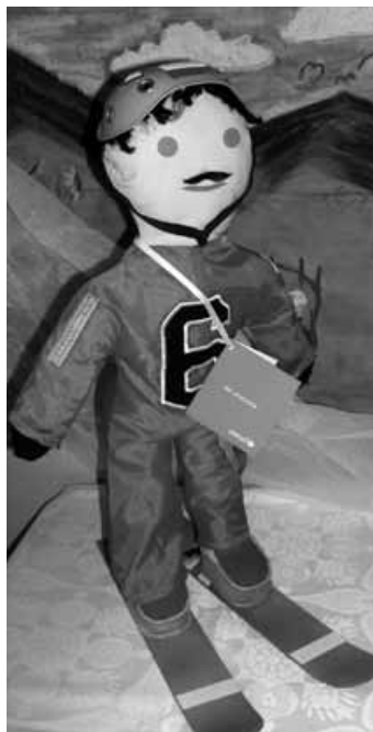
Laleczka wykonana na konkurs przez J. Nędzkę.