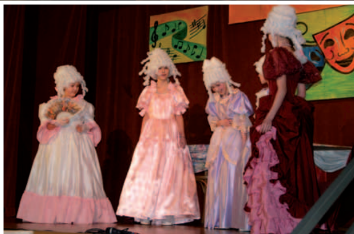
Zespół teatralny „Dionizos” z Kalnej.

Jury stwierdziło, że impreza ma przyjemny charakter i jest bardzo potrzebna ze względu na edukację muzyczną. Jednak prezentowany repertuar nie zawsze