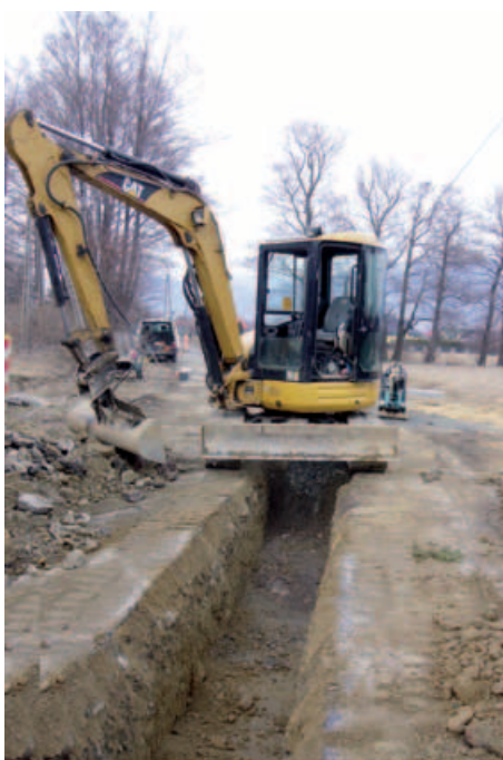
Budowa kanalizacji – ul. Bór w Buczkowicach.