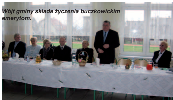
Wójt gminy składa życzenia buczkowickim emerytom.

Wielkanoc to czas otuchy i nadziei. Czas odradzania się wiary w siłę Chrystusa i drugiego człowieka.