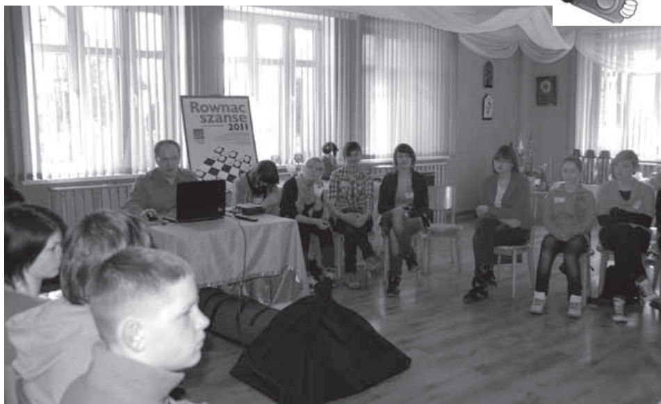
Warsztaty fotograficzne w siedzibie GOK w Buczkowicach.

Na uczestników projektu czekają jeszcze kolejne warsztaty fotograficzne, plenery, zajęcia z zakresu grafiki, obróbki zdjęć i cała masa innych działań, których efekt będzie można podziwiać na podsumowaniu projektu, jakim będzie wystawa fotograficzna połączona z promocją stworzonego przez młodych w ramach projektu szkolnego kalendarza. Impre-