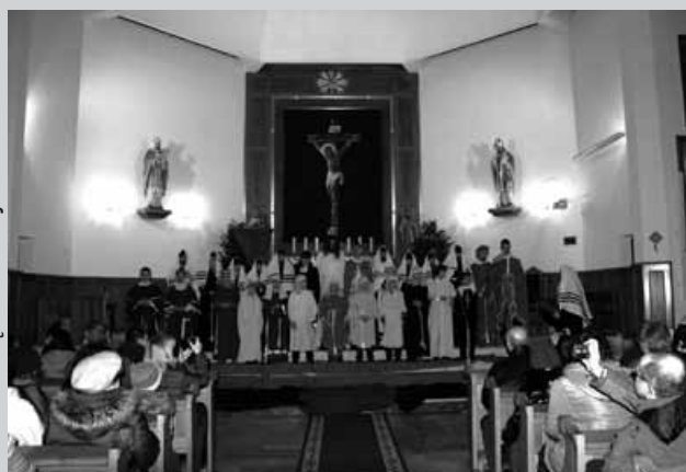
Misterium Męki Pańskiej w Buczkowicach.