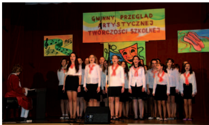
Chór szkolny z Rybarzowic.

był dostosowany do umiejętności wokalnych dzieci, a w większości występów brakowało ruchu scenicznego, który ma duży wpływ na ogólny wyraz artystyczny. Oceniając występy teatralne jurorzy docenili wysiłek i talent wszystkich uczestników, cieszyli się z właściwego doboru repertuaru, dobrej interpretacji oraz dbałości o kostiumy. Sugerowali większą pracę nad dramaturgią