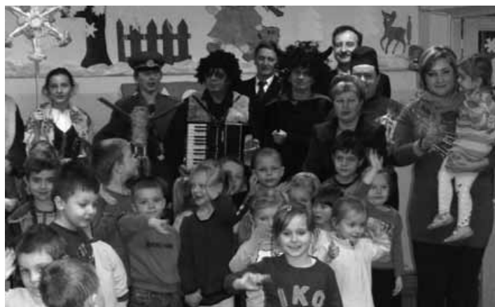
Kolędnicy w rybarzowickim przedszkolu.