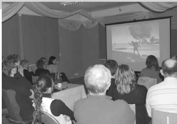
Widzowie prezentacji rowerowo-rolkowej.

Goście przyznali, że wyprawa wzbudziła w nich różne emocje – stąd tytułowa fascynacja, zachwyt i niesmak. Dlaczego prezentacja otrzymała taki tytuł, widzowie mogli przekonać się oglądając fascynu-