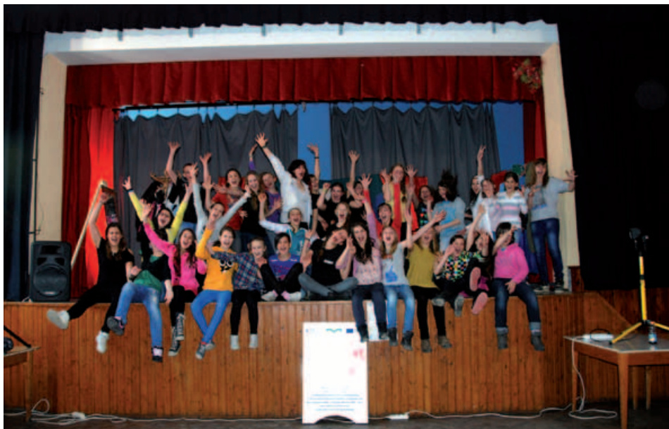
Integracyjne spotkanie – „Bez Cenzury” i „Prvosienka”.

Następnie grupa udała się do Dolnego Kubina, wieczorem zwiedziła miasto, przez przypadek wstępując na lokalne lodowisko, gdzie mecz treningowy rozgrywali hokeiści, którym zdecydowanie spodobał