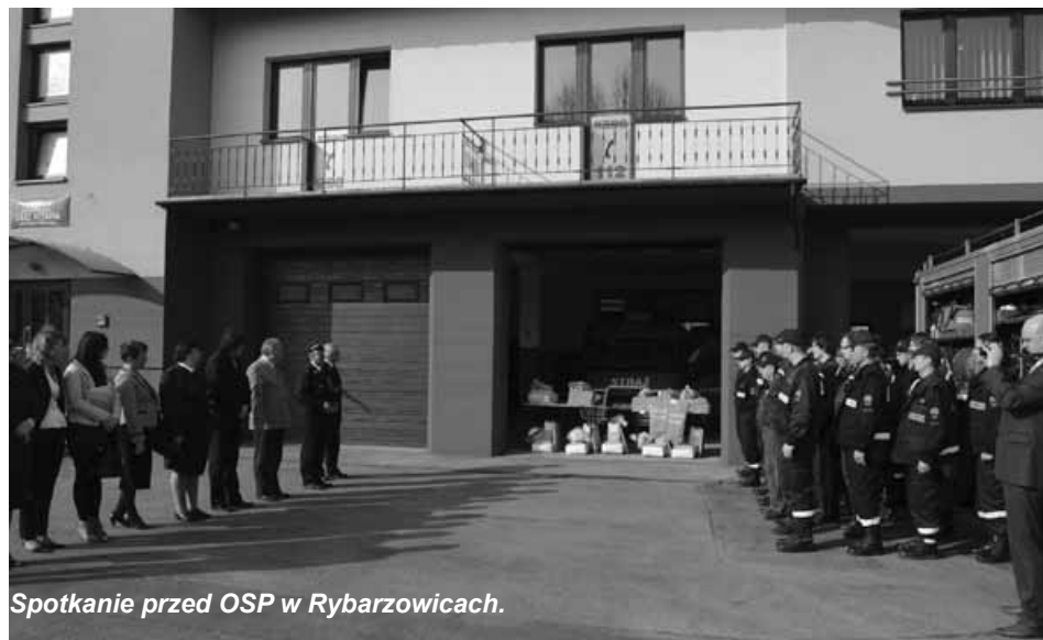
Spotkanie przed OSP w Rybarzowicach.