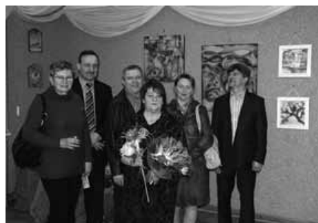
Goście wernisażu wraz z autorką wystawy.

Ktoś jest kierowcą i jeździ. Ktoś nauczycielem i uczy. Ktoś bezdomnym i się błąka. A ktoś maluje, rysuje, lepi, klei, dekoruje i z tego się utrzymuje. A wszystko żeby pobudzić wyobraźnię.