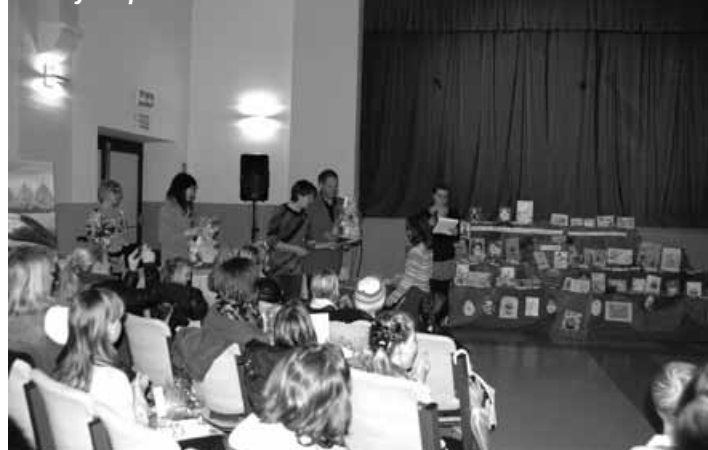
Uroczyste podsumowanie konkursu.