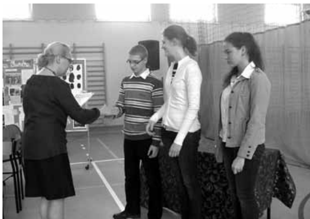
Nagrodzeni w konkursie wiedzy o J. W. Goethem.