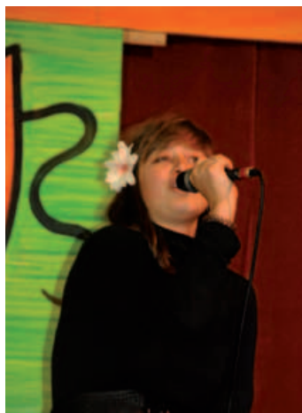
Zdobywczyni 1. miejsca w kat. gimnazjum.