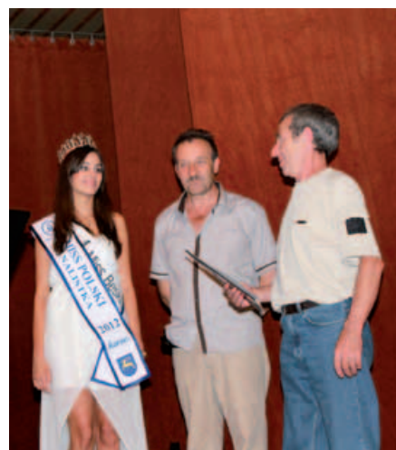
Laureat loterii. Kapela Wujka Idziego.