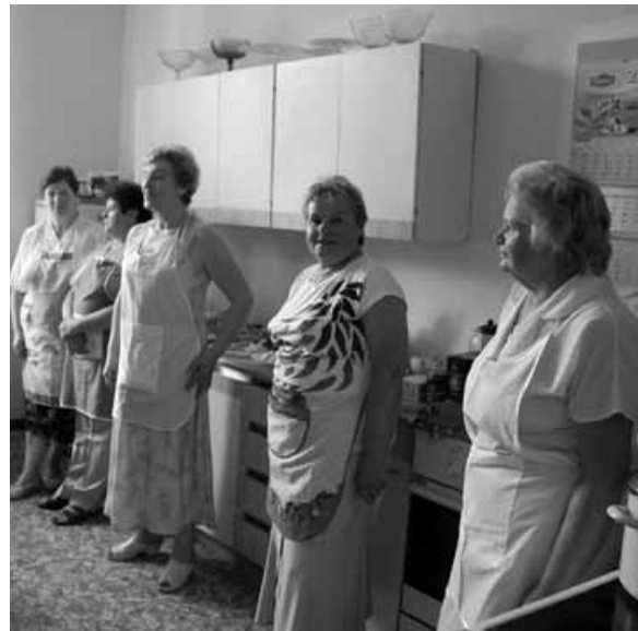
Gospodynie w nowej kuchni.