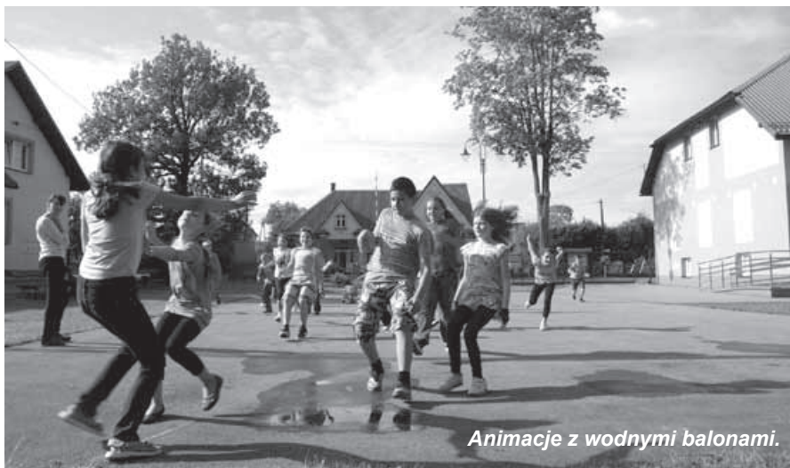
Animacje z wodnymi balonami.

Podczas tegorocznych wakacji Gminny Ośrodek Kultury w Buczkowicach tradycyjnie zadbał, aby dzieciom i młodzieży spędzającym wakacje na miejscu zorganizować różnorodne atrakcje. Jedną z nich były zajęcia wakacyjnej świetlicy odbywające się w każdą wakacyjną środę. Zajęcia cieszyły się dużym zainteresowaniem, nie brakowało chętnych do różnorodnych zabaw – integracyjnych, edukacyjnych, muzycznych i rekreacyjnych, takich jak zabawa z chustą Klanzy, mega skakanka, wodnymi balonami, gazetami i hitem tegorocznej świetlicy, czyli klamerkami. Naj-