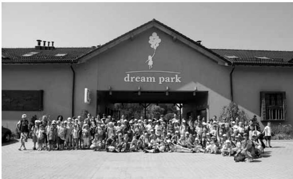
Uczestnicy I turnusu.

Ciekawą propozycją była piesza wyprawa wraz z przewodnikiem do Chaty na Groniu, w którą wyruszyli uczestnicy z Buczkowic