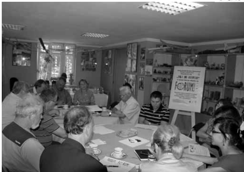
Spotkanie organizacyjne przedstawicieli lokalnych organizacji i instytucji.

Gminny Ośrodek Kultury w Buczkowicach zaprasza przedstawicieli lokalnych organizacji i instytucji działających w gminie Buczkowice oraz wszystkich zainteresowanych społecznym działaniem na rzecz lokalnej młodzieży do udziału w Lokalnym Forum „Dla Młodych”, które odbędzie się 13 września w godzinach od 9.00 do 16.00 w siedzibie Sokolni w Buczkowicach.