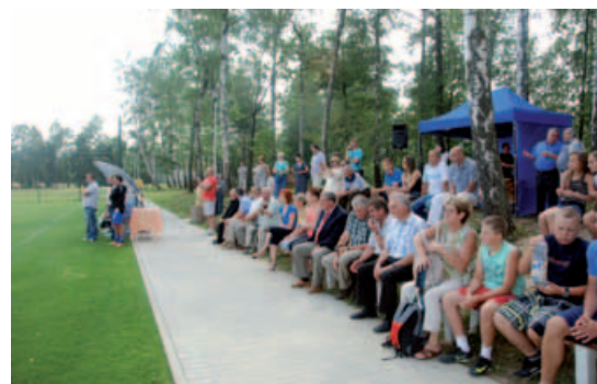
Trybuny sportowe dla kibiców.