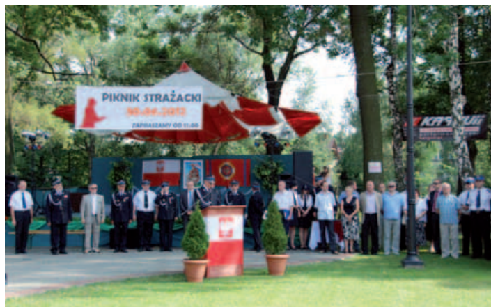
Goście oficjalnej uroczystości.