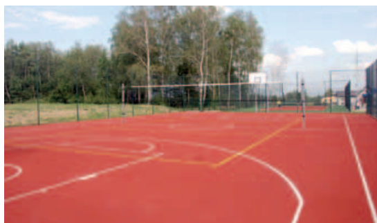
Boisko do koszykówki i siatkówki.