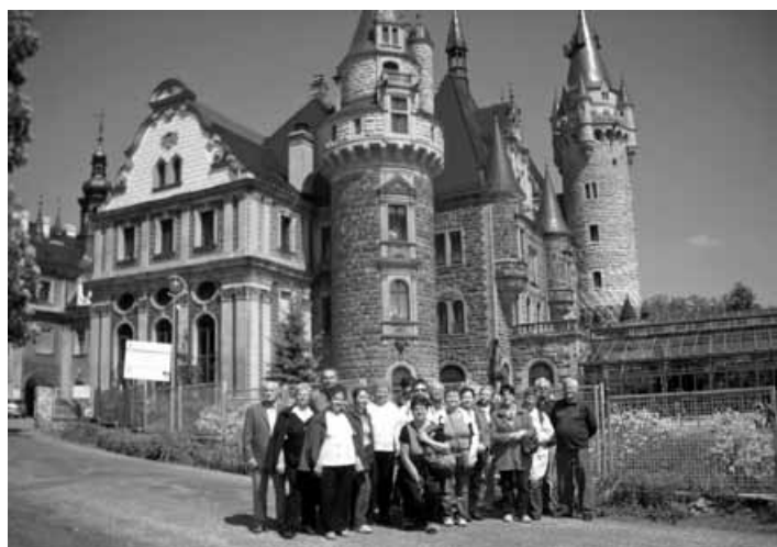
Przedstawiciele „Nadziei” na tle panoramy zamku w Mosznej.