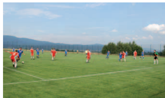
Inauguracyjny mecz piłki nożnej.