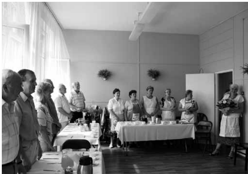
Goście w sali biesiad.