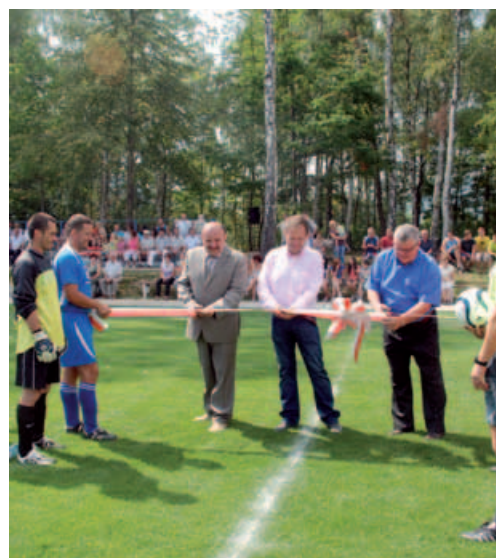
Symboliczne przecięcie wstęgi.