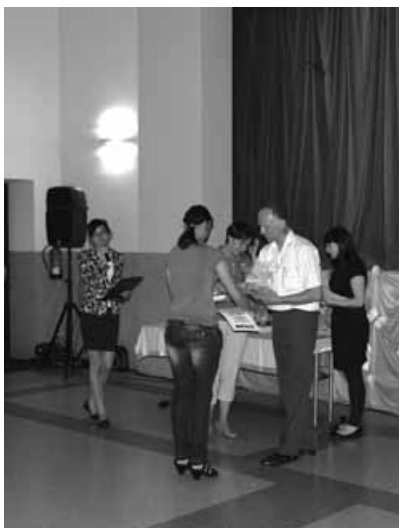
Uroczyste wręczenie nagród.

21 czerwca w Sokolni w Buczkowicach odbyło się zorganizowane przez Gminny Ośrodek Kultury w Buczkowicach II Gminne Dyktando. Wzięły w nim udział 44 osoby, przedstawiciele lokalnych szkół, sołectw naszej gminy oraz miejscowości sąsiednich.