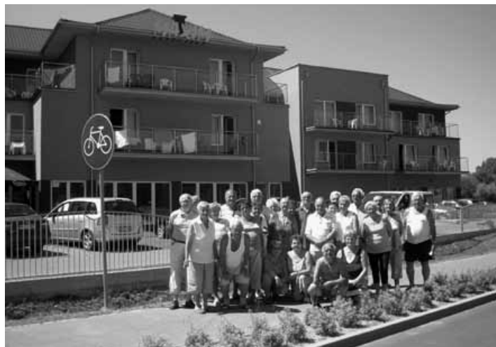
Grupa emerytów na rehabilitacji w Łebie.