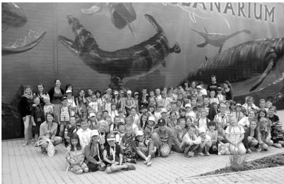
Uczestnicy II turnusu.

i Rybarzowic. Półkoloniści z Godziszki i Kalnej wybrali się na Halę Jaworzynkę. Wszyscy uczestnicy pokonali dzielnie trasę w obie strony, zaskakując opiekunów wytrzymałością.