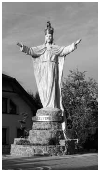
Figura przy kościele w Kalnej.