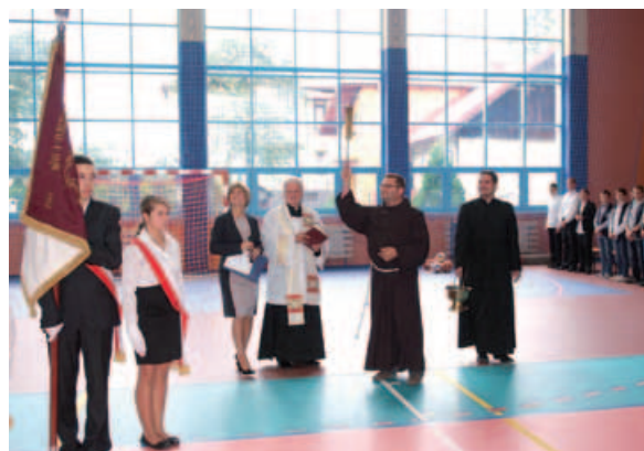
Poświęcenie nowego obiektu sportowego.