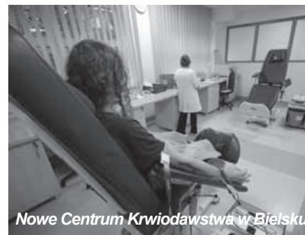
Nowe Centrum Krwiodawstwa w Bielsku.

Krew może oddać każdy, kto ukończył 18 lat, a nie ma jeszcze 65 i waży nie mniej niż 50 kg. Jeśli chorujesz przewlekłe lub nie czujesz się w danym dniu zdrowy, nie możesz oddać krwi. Idąc do punktu oddawania powinieneś być wypoczęty, zjeść lekki posiłek (nigdy nie oddajemy krwi na czczo!), wypić dużo wody (niegazowanej) oraz mieć ze sobą dowód tożsamości ze zdjęciem. Nie możesz być pod wpływem alkoholu. Na miejscu, po rejestracji, odbywa się badanie lekarskie, podczas którego pozbe-