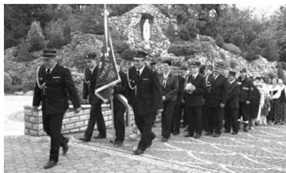
Korowód w Kalnej.