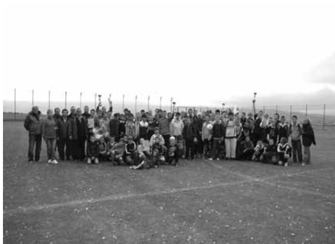
Uczestnicy turnieju wraz z opiekunami i gośćmi.