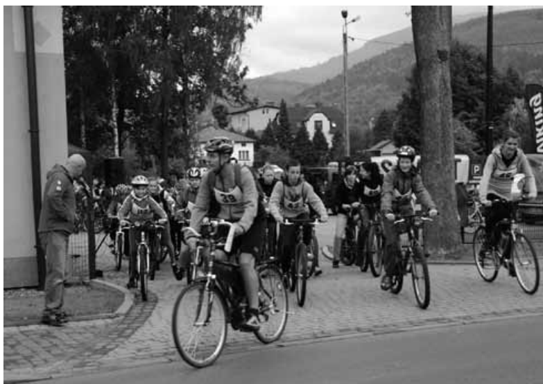
Rowerzyści na starcie rajdu.