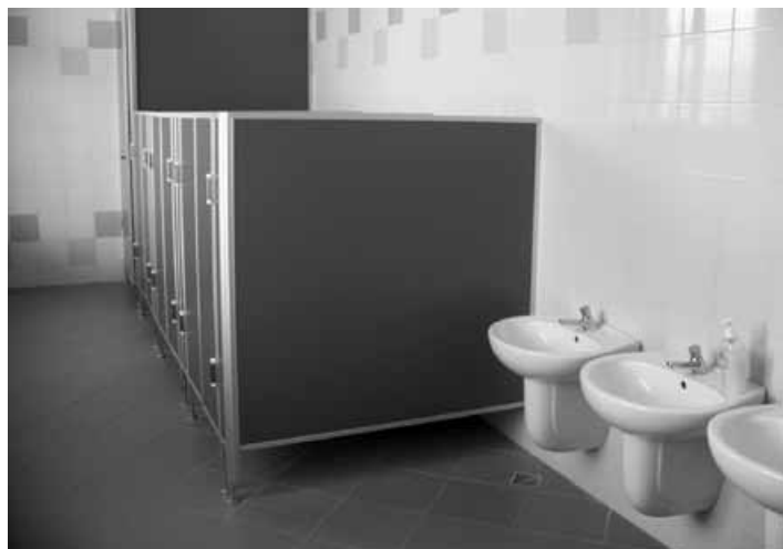
Wyremontowane łazienki w przedszkolu.

Dzieci przychodzą do przedszkola z wielką radością. Poznały już dużo wierszy, piosenek, wyliczanek, bajek opowiadanych przez nauczycielki. Biorą aktywny udział w zajęciach, zabawach. Przełamały opory związane z pozostaniem w przedszkolu bez rodziców. Są radosne, pogodne i szczęśliwe.