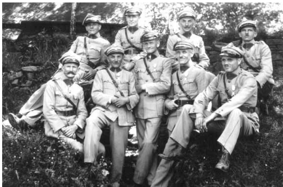
Przedstawiciele części grupy hallerczyków z Buczkowic.