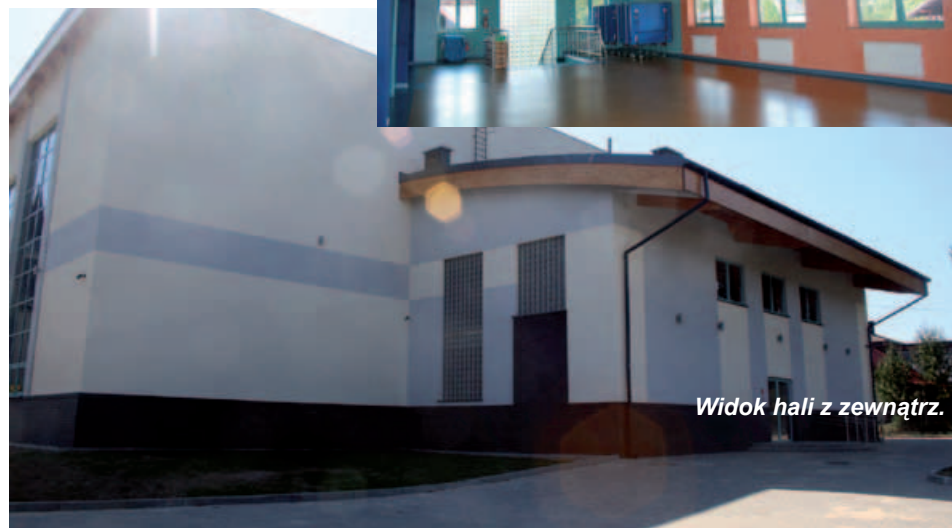
Widok hali z zewnątrz.