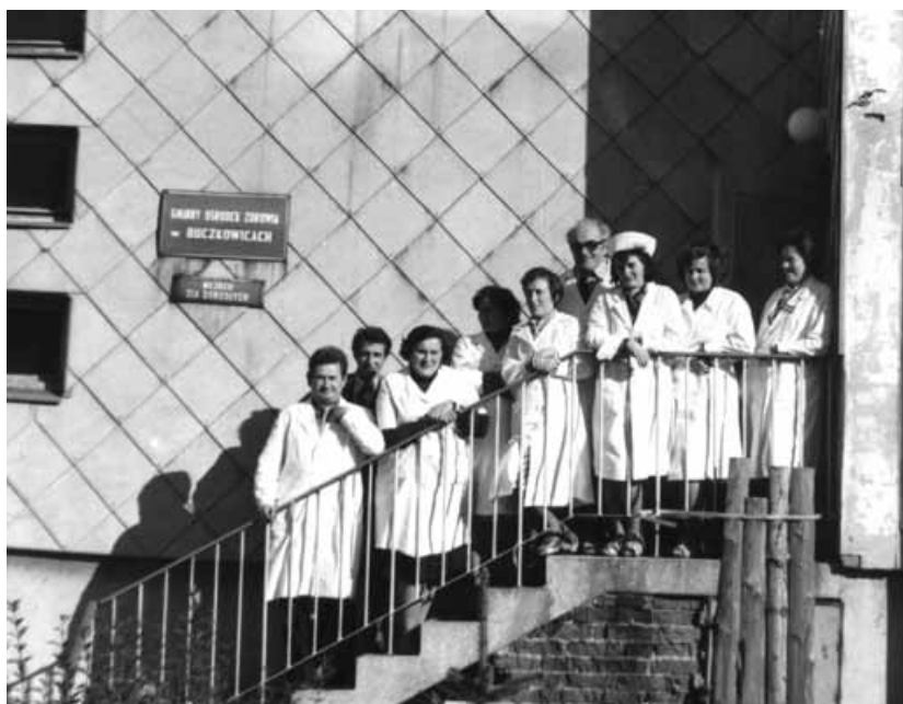
Kadra pracownicza ośrodka zdrowia w roku 1980.