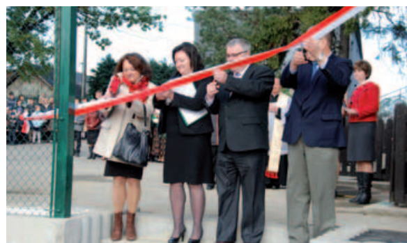
Uroczyste przecięcie wstęgi.