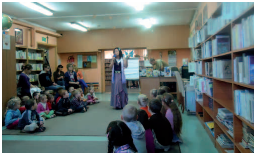
Spotkanie z pisarzem w bibliotece w Godziszce.

Jesienne Dni Książki to dwudniowa cykliczna impreza promująca czytelnictwo, której towarzyszą nie tylko spotkania z pisarzami, gry i zabawy z książką dla najmłodszych, kiermasz dobrej książki, występy artystyczne, ale także rozstrzygnięcie dwóch wojewódzkich konkursów: literackiego „Chcecie bajki... oto bajka” oraz plastycznego „Mój ulubiony bohater literacki”.