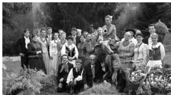
Zespół „Rybarzowice” po występie w Bystrej.