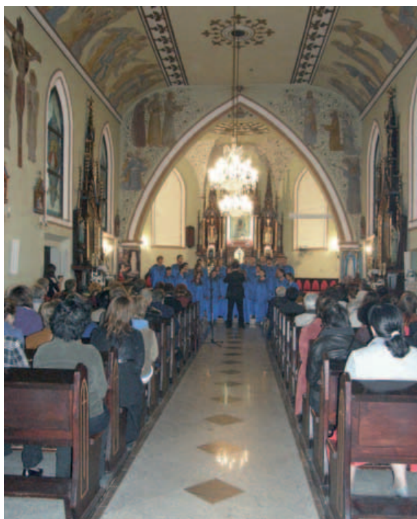
Chór Mieszany z Głubczyc.