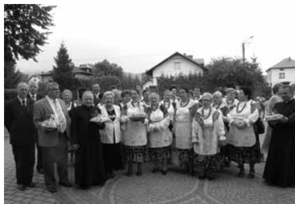
Goście i organizatorzy dożynek w Godziszcu.