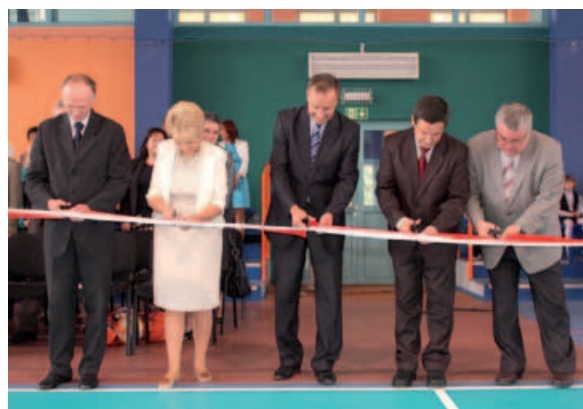
Uroczyste przecięcie wstęgi.