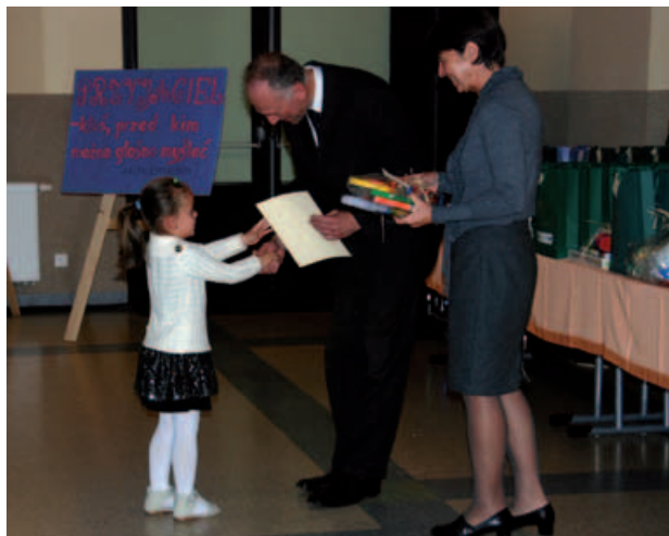
Wręczenie nagród laureatom konkursu plastycznego.