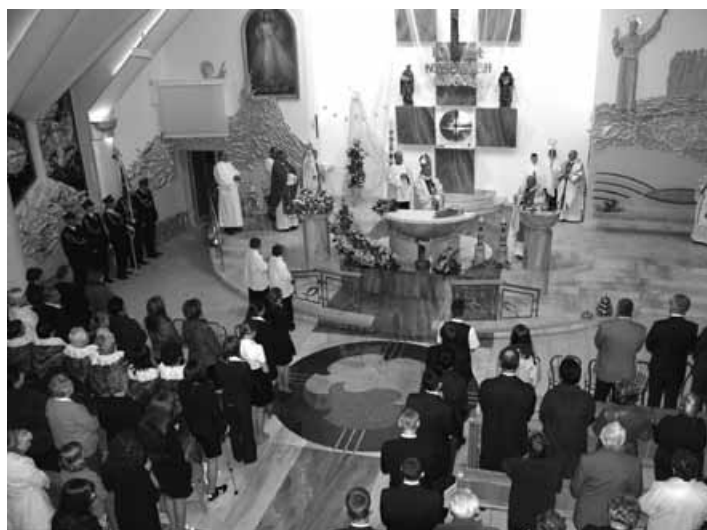
Uroczystość w kościele parafialnym w Kalnej.