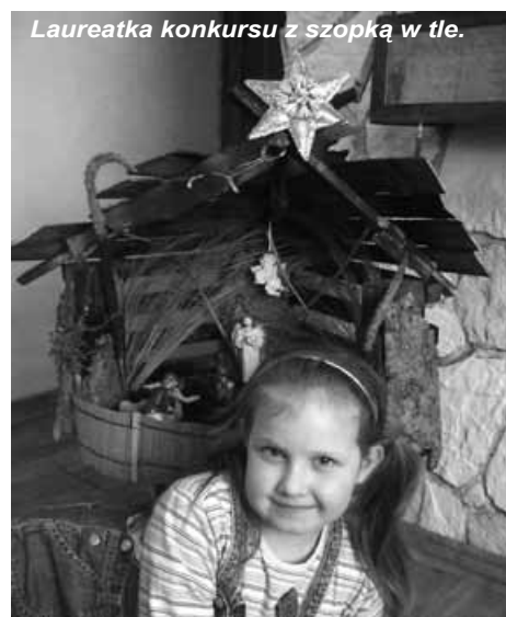
Laureatka konkursu z szopką w tle.

ki, co licznie zgromadzeni na koncercie dumni mieszkańcy Buczkowic przyjęli gromkimi oklaskami.