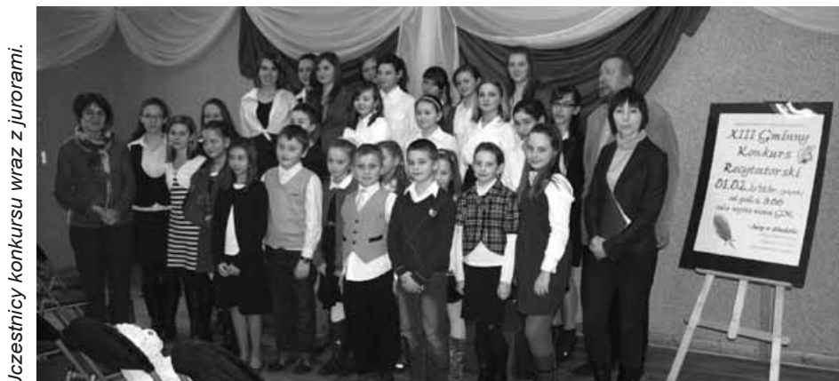
Uczestnicy konkursu wraz z jurorami.