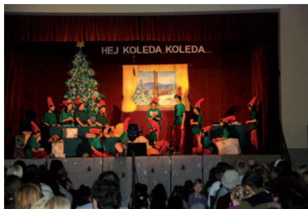
„Porwanie Mikołaja” – grupa teatralna „Dzieciaki ze zgranej paki”.