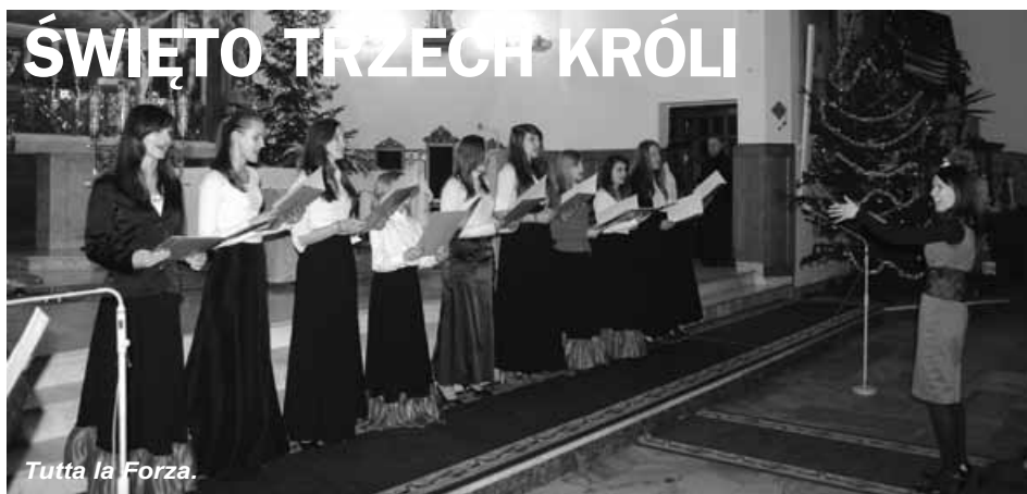
Tutta la Forza.