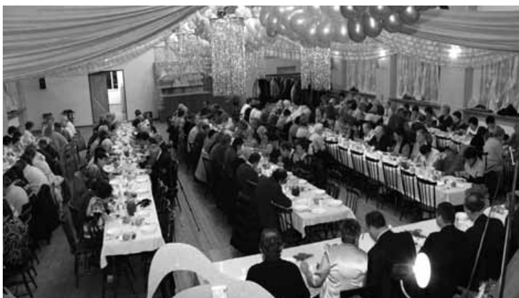
Uczestnicy spotkania w Rybarzowicach.