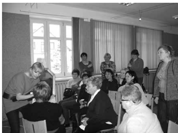
Warsztaty stylizacji i wizażu.