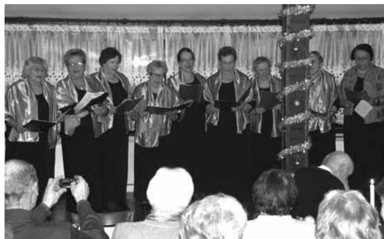
Śpiewa chór „Echo Godziszki”.