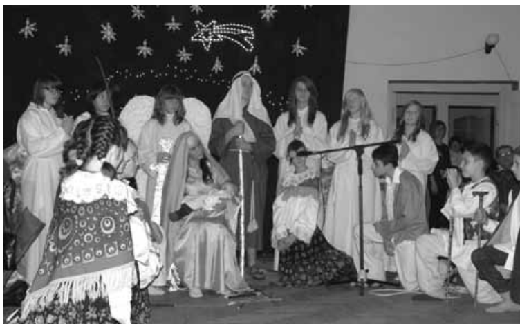
Jasełka w wykonaniu szkolnych aktorów z Kalnej.