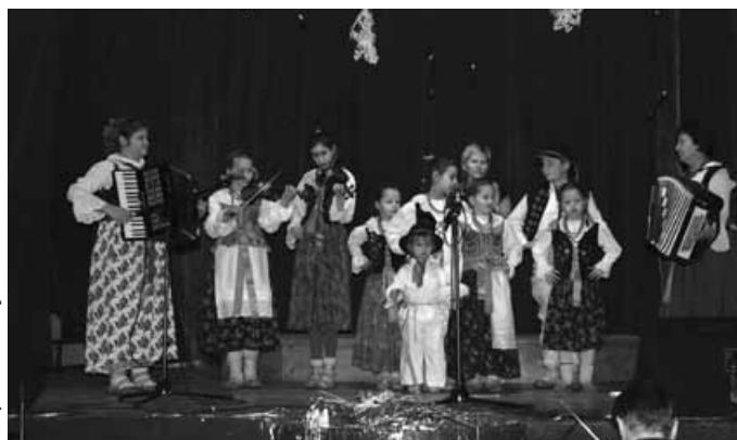
Kapela „Mały Ondraszek”.