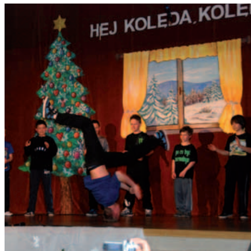
Pokaz break dance.

W niedzielne popołudnie 20 stycznia w sali widowiskowej Sokolnia odbył się Noworoczny Koncert Zespołów Artystycznych GOK „Hej kolęda, kolęda...”, zorganizowany przez Gminny Ośrodek Kultury w Buczkowicach.