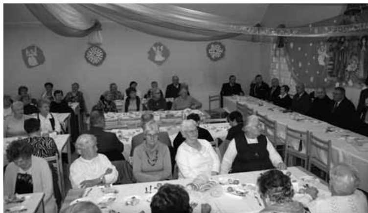
Uczestnicy spotkania w Buczkowicach.