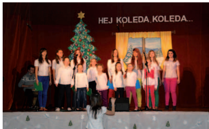
Zespół Tutta la Forza.

Kolejny koncert już za rok, a my zapraszamy chętnych do udziału w szerokiej gamie zajęć artystycznych i kół zainteresowań, które oferuje Gminny Ośrodek Kultury w Buczkowicach. SK