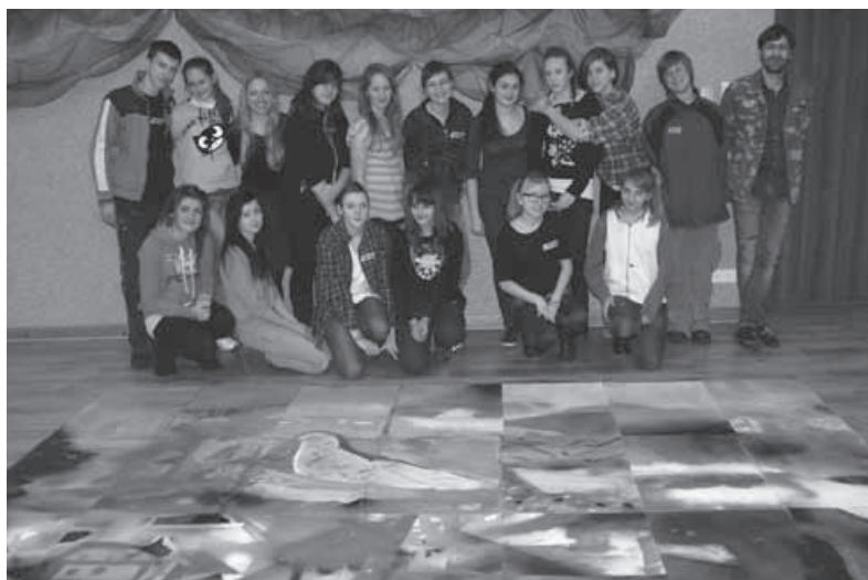
dok. ze str. 1 Panorama Szczyrku w oczach grafficiarzy.

Równać szanse 2012 regionalny konkurs grantowy