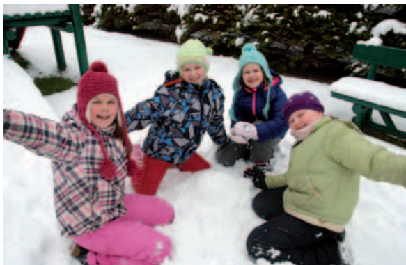
Konkurs lepienia rzeźb śnieżnych.