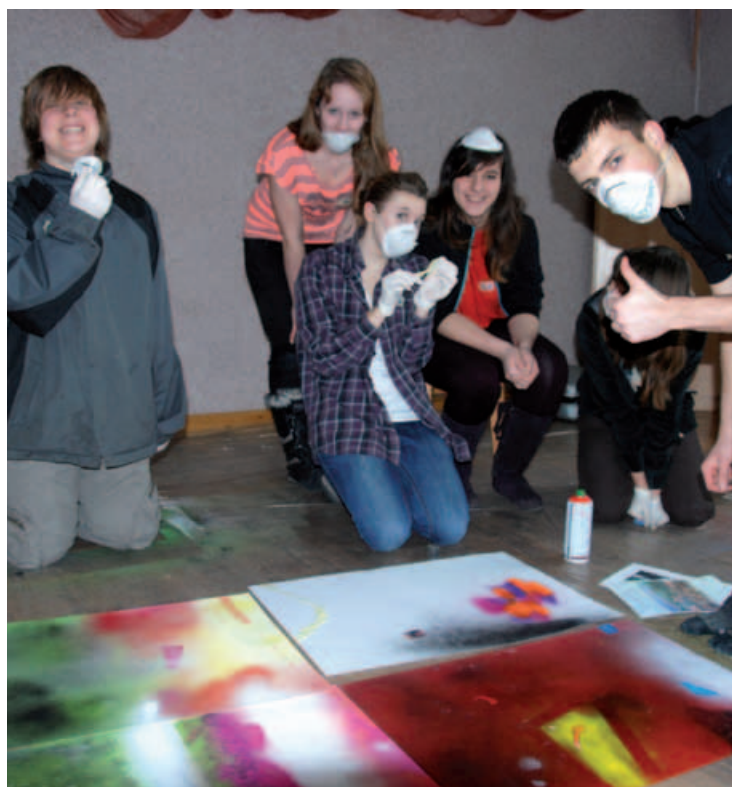
cd. na str. 9 Grupa młodych grafficiarzy w akcji.