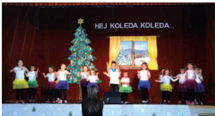
Najmłodsza grupa taneczna.