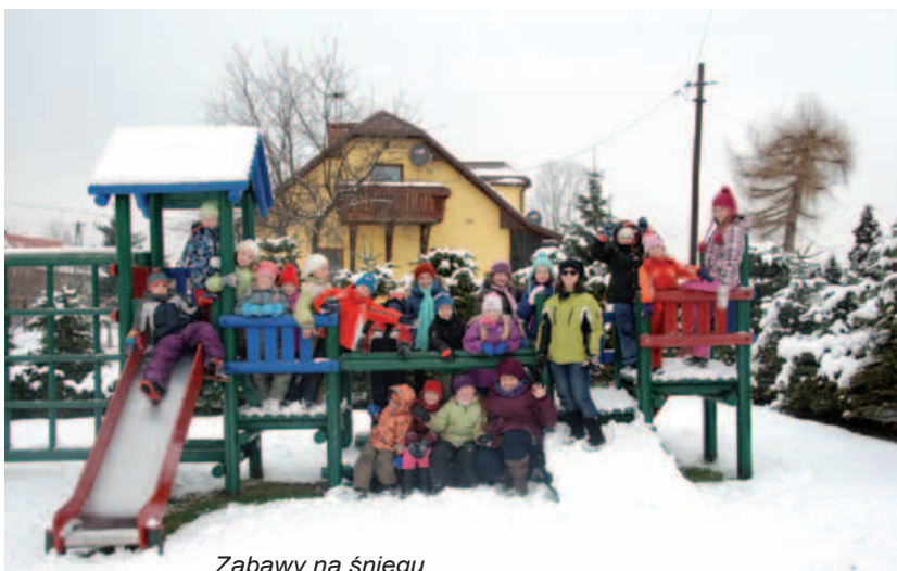
Zabawy na śniegu.

W dniach od 11 do 22 lutego br. w czasie trwania ferii zimowych dzieci z naszej gminy mogły uczestniczyć w zajęciach profilaktyczno-wychowawczo-rekreacyjnych organizowanych przez Gminny Ośrodek Kultury w Buczkowicach. Od poniedziałku do piątku w godzinach od 10.00 do 14.00 dzieci pod czujnym okiem opiekunów mogły uczestniczyć w różnorodnych zajęciach, m.in.: integracyjnych, plastycznych, bibułkarskich, tanecznych, a także w zabawach ruchowych, konkursach, turniejach, zawodach sportowych itp.