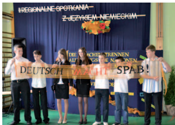
Uroczyste otwarcie imprezy.

Celem imprezy jest popularyzowa- nie nauczania niemieckiego jako języka obcego i poszerzanie wiedzy uczniów o krajach niemieckiego obszaru języko- wego. Przedsięwzięcie przyczynia się również do wzrostu motywacji uczniów