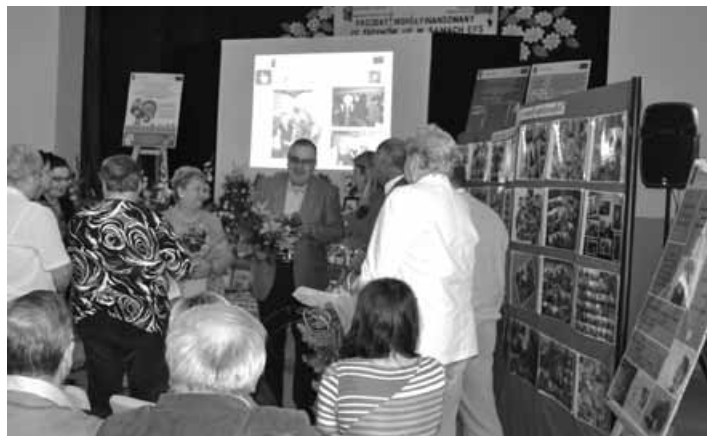
Podziękowania dla instruktorki zajęć komputerowych.

Wszystkie projektowe zajęcia były bezpłatne.