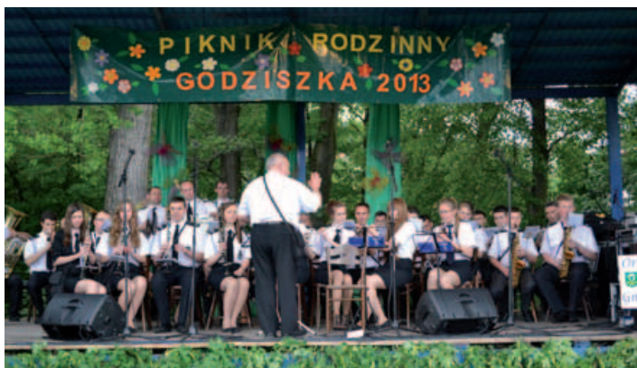
Orkiestra Dęta Ochotniczej Straży Pożarnej „Wola”.