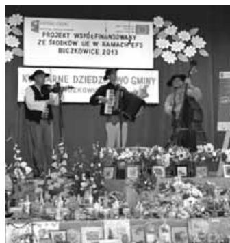
Kapela „Zbójnicy” ze Szczyrku.

Komisja z wielkim zapałem przystąpiła do degustacji różnorodnych potraw, które następnie oceniali przyznając odpowiednią punktację. Jury brało pod uwagę zgodność przepisu potrawy oraz sposobu jej przygotowania z wiedzą i umiejętnościami naby-