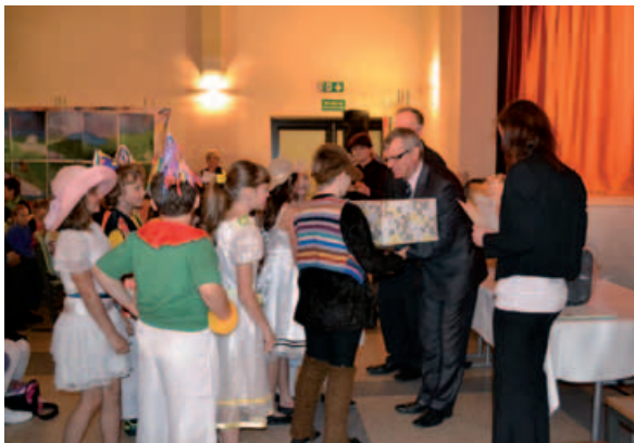
„Miniaturka” odbiera nagrody.