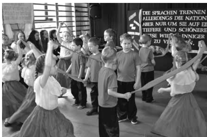
Występ taneczny uczniów oddziału zerówkowego.

Laureatem pierwszego miejsca quizu „ Eine kleine Landeskunde ”, którego uczestnicy rozwiązywali test obejmujący zagadnienia z wiedzy o krajach