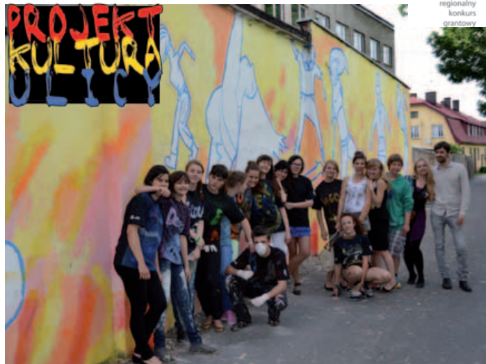
Uczestnicy na tle pomalowanej ściany przy byłej FMG.