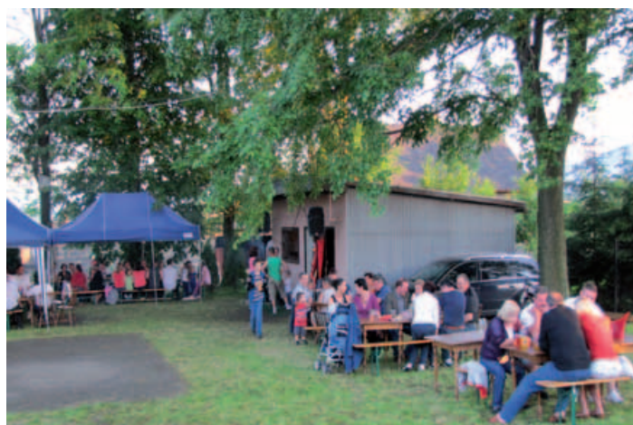
Piknik przy OSP w Kalnej.