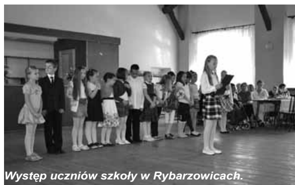
Występ uczniów szkoły w Rybarzowicach.