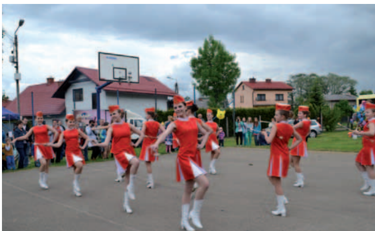
Pokaz mażorettek z Wręcycy Wielkiej.

2 czerwca na terenie rekreacyjnym w Godziszce odbył się piknik rodzinny „Złota Trąbka” zorganizowany wspólnie przez Radę Sołecką Godziszki oraz Gminny Ośrodek Kultury w Buczkowicach w ramach X Międzynarodowego Festiwalu Orkiestr Dętych „Złota Trąbka”, który odbywał się w Kozach.