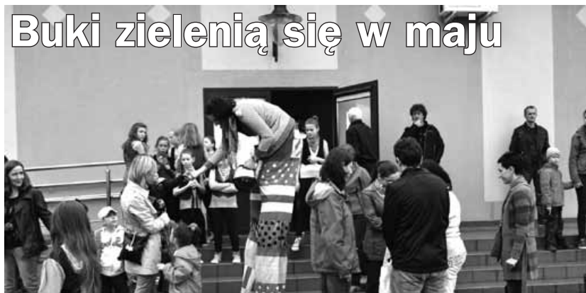
Szczudlarka rozdawała dzieciom słodycze.