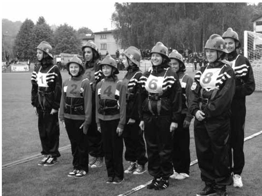
Drużyna z Rybarzowic podczas zawodów.