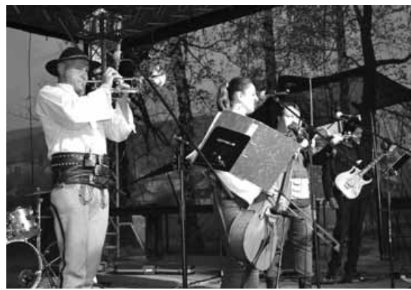
Kapela „Po Nasemu”.

2 maja na terenie rekreacyjnym przy Sokolni w Buczkowicach odbył się organizowany corocznie przez Gminny Ośrodek Kultury w Buczkowicach festyn rodzinny „Zielenią się buki”. Niestety zabawę w tym roku nieco zepsuła deszczowa pogoda, jednak pomimo tego zgromadzeni chętnie korzystali z przygotowanych dla nich atrakcji.