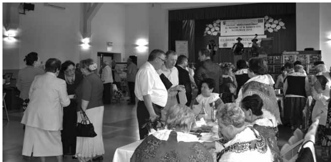
Komisja degustuje przygotowane dania konkursowe.