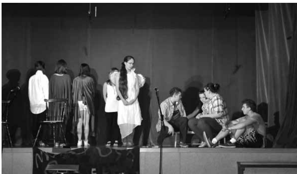
Spektakl w wykonaniu uczniów ZSPiG nr 2 w Godziszce.

18 czerwca w Sokolni w Buczkowicach odbył się X Gminny Dzień Profilaktyki, w ramach którego wystawiono cztery spektakle profilaktyczne, przygotowane przez uczniów poszczególnych szkół z terenu gminy Buczkowice. Widowiska przedstawiały problematykę uzależnień w bardzo szerokim ujęciu oraz ukazywały możliwe konsekwencje podejmowania przez młodych ludzi niewłaściwych decyzji życiowych. Wszystkie spektakle zawierały istotne przesłanie profilaktyczne, przy czym zarówno ich tematyka, jak i umiejętności sceniczne młodych aktorów spotkały się z uznaniem publiczności. Na widowni zasiadło 200 przedstawicieli uczniowskiej społeczności gminy oraz ich nauczyciele. Biorący udział w spektaklach uczniowie otrzymali drobne słodkie upominki i nagrody rzeczowe dla swoich szkół.