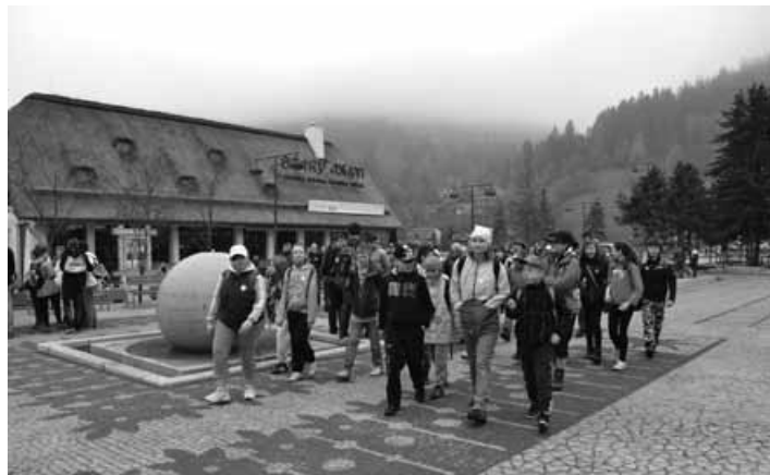
Wymarsz grup na drugą trasę rajdu.