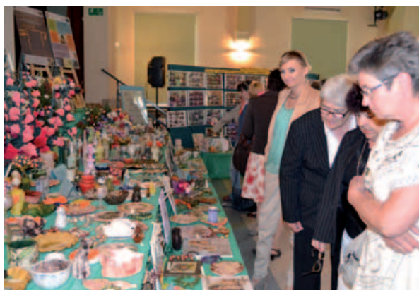
cd. na str. 4 Wystawa prac artystycznych i kolaży graficznych.

W maju oficjalnie i uroczystie zakończyły się trzy projekty realizowane od grudnia 2012 r. do maja 2013 r. przez Gminny Ośrodek Kultury w Buczkowicach w partnerstwie z Klubem Sportowym „Halny” w Kalnej – „Dialog z tradycją”, „Z tradycją w przyszłość” i „Komputer – możliwości na miarę współczesności”. Projekty były dofinansowane ze środków Unii Europejskiej w ramach Europejskiego Funduszu Społecznego i cieszyły się dużym zainteresowaniem osób dorosłych z gminy Buczkowice, do których były skierowane.