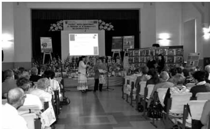
Podziękowania dla instruktorek warsztatów artystycznych.