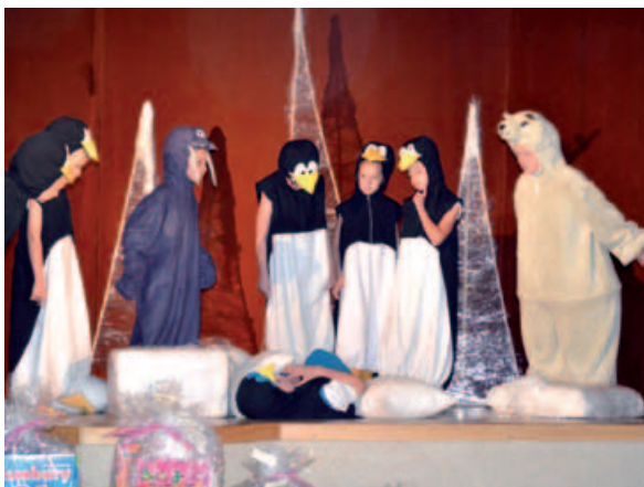
„Lodowy przyjaciel” – najlepszy spektakl powiatu bielskiego.

W dniach 23-24 maja w Sokolni w Buczkowicach odbyły się XIV Miniatury Teatralne – Wojewódzki Przegląd Krótkich Przedstawień Teatralnych i Monodramów, organizowany przez Gminny Ośrodek Kultury w Buczkowicach i Regionalny Ośrodek Kultury w Bielsku-Białej przy wsparciu bielskiego Starostwa Powiatowego. Impreza, w której corocznie biorą udział monodramiści i zespoły teatralne z całego województwa, także w tym roku zgromadziła liczne grono młodych aspirujących aktorów, zarówno z okolic, jak i z dalej położonych miast.