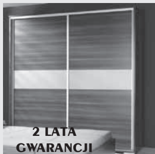
2 LATA GWARANCJI