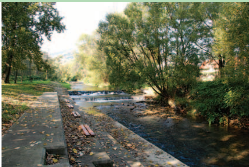
Zabezpieczona skarpa potoku Żylica w Buczkowicach.

– wybudowano 5 km sieci wodociągowej, do której pod-