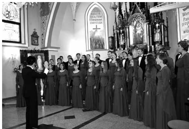
Chór „Medici Cantates”.

Gościliśmy w naszej gminie najlepszych – „Medici Cantates” zdobył grand prix konkursu, Puchar Prezy-