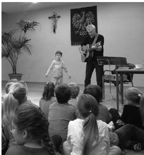
Spotkanie z pisarzem w Buczkowicach.