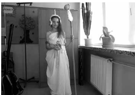
Uczta na Olimpie.