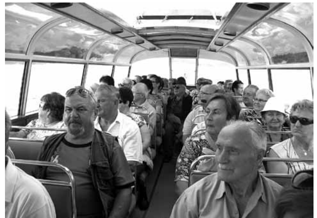
W czasie rejsu.

dokowe pozwoliły podziwiać urok Bieszczad. W Myczkowcach członkowie stowarzyszenia zwiedzili również park miniatur, gdzie znajdują się makiety najstarszych, drewnianych kościołów, cerkwi prawosławnych, grekokatolickich z południowo-wschodnich terenów Polski.