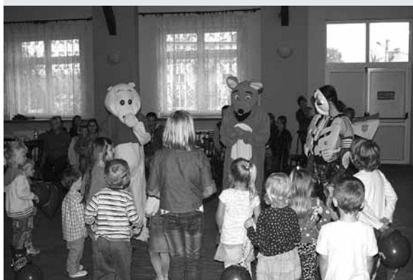
Dzień Pieczonego Ziemniaka.

Podczas zajęć, przechodząc od tego prostego patriotyzmu do coraz szerszego związanego z obrzędami, zwyczajami, symboliką narodową – uświadamiamy dzieciom kim jesteśmy, skąd się wywodzimy, jaka jest nasza przeszłość, uczymy je bycia Polakiem, miłości do kraju ojczystego oraz wzmacniamy więzi rodzinne. Założenia tego planu ściśle wiążą się z koncepcją pracy przedszkola, która ma za zadanie kształtowanie poczucia przynależności narodowej poprzez poznanie legend, tradycji i obyczajów ludowych.