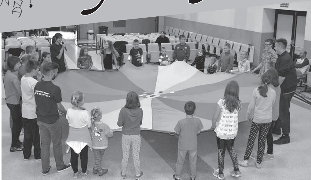
Animacje z chustą Klanzy

kance, w których najlepsze okazały się dziewczyny, a także gry w bule, w której nie było łatwo trafić w tarczę z punktami. Hitem imprezy okazało się jednak malowanie twarzy - każde dziecko chciało na swojej twarzy wizerunek tygrysa, Spider-Mana czy choćby kwia-