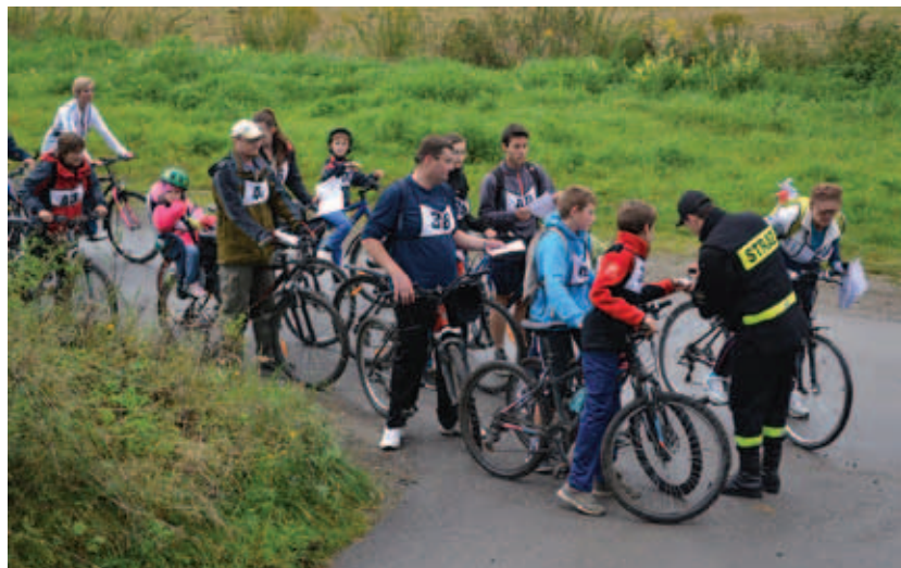
Punkt kontrolny na trasie rajdu.

Nagrodą za przebycie całej trasy, którą szczęśliwie udało się ukończyć wszystkim uczestnikom, był drobny upominek.