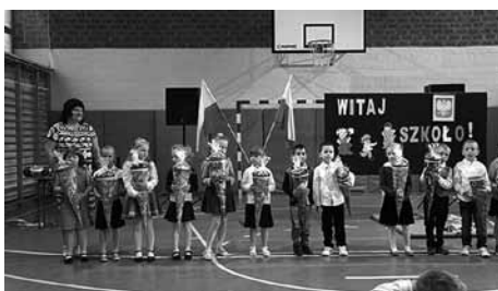
Pierwszy dzień szkoły.