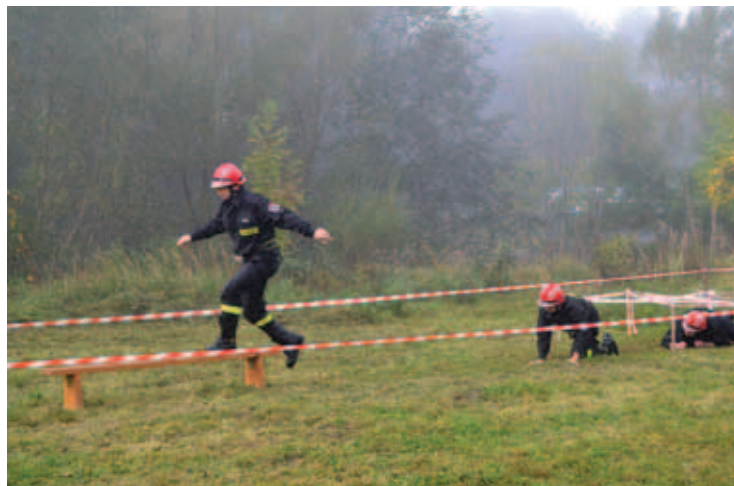
Tor przeszkód w Rybarzowicach.