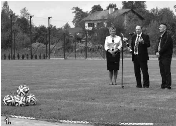
1. Część oficjalna – przemówienia zaproszonych gości. 2. Symboliczne przecięcie wstęgi.