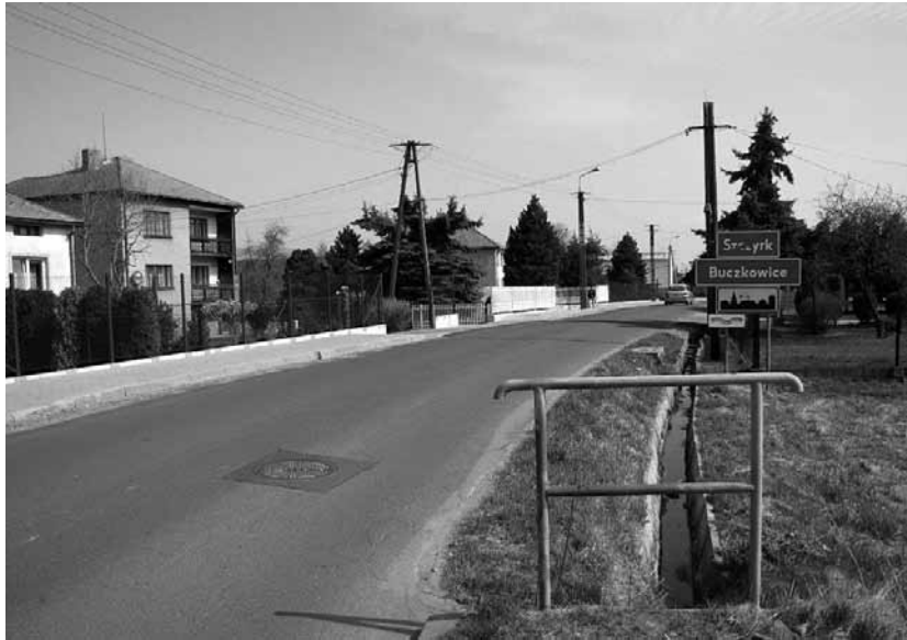
Chodnik przy ulicy Grunwaldzkiej w Buczkowicach.

W trakcie realizacji jest remont ul. Kaniowej w Buczkowicach za kwotę 400 tys. zł.