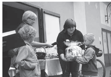
Losowanie nagród głównych.