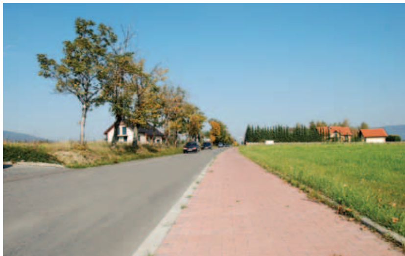
Chodnik z Kalnej do Godziszki.

łączono 104 budynki, w tym w Buczkowicach wybudowano 3,7 km sieci wodociągowej, w ulicy Jama włączono do sieci 54 budynki, a w Godziszcu wykonano 1,3 km sieci wodociągowej, w tym 0,6 km sieci przesyłowej oraz wymieniono 0,7 km sieci wodociągowej, do której przyłączono 50 budynków.