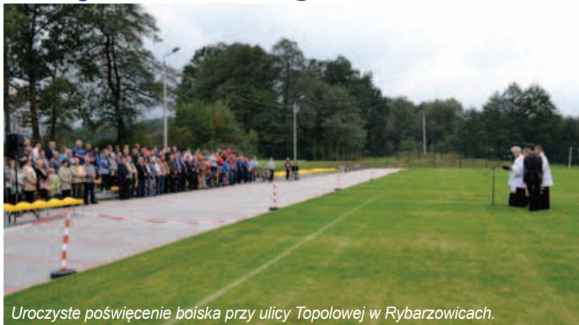
Uroczyste poświęcenie boiska przy ulicy Topolowej w Rybarzowicach.

W ramach dobrej współpracy, dofinansowano działalność organizacji społecznych w gminie, między innymi w zakresie kultury fizycznej, zdrowia i turystyki, w latach 2011-2014 przekazano dotacje dla podmiotów pro-