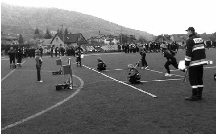
Na zdjęciu: Drużyny MDP w akcji.