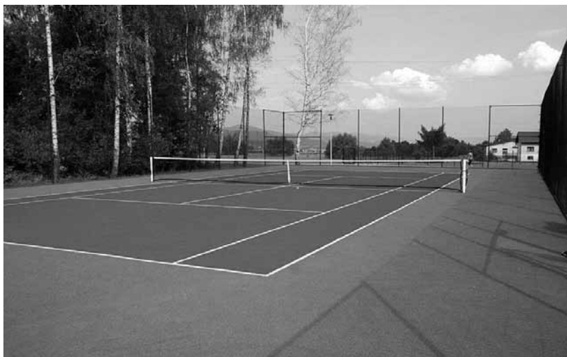
Kort tenisowy przy kompleksie sportowym „przy Brzózkach” w Godziszce.

●W Godziszce wybudowano kompleks sportowy „przy Brzózkach”,