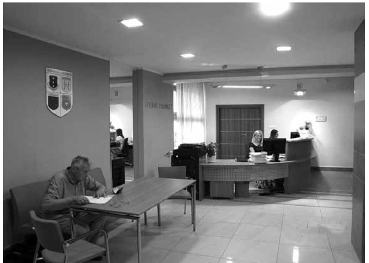
Dziennik podawczy w budynku Urzędu Gminy w Buczkowicach.

Kontynuowano utwardzanie dróg gminnych kłińcem, w latach 2011-2014 zakupiono i rozwieszono 2,3 tys. ton kłińca