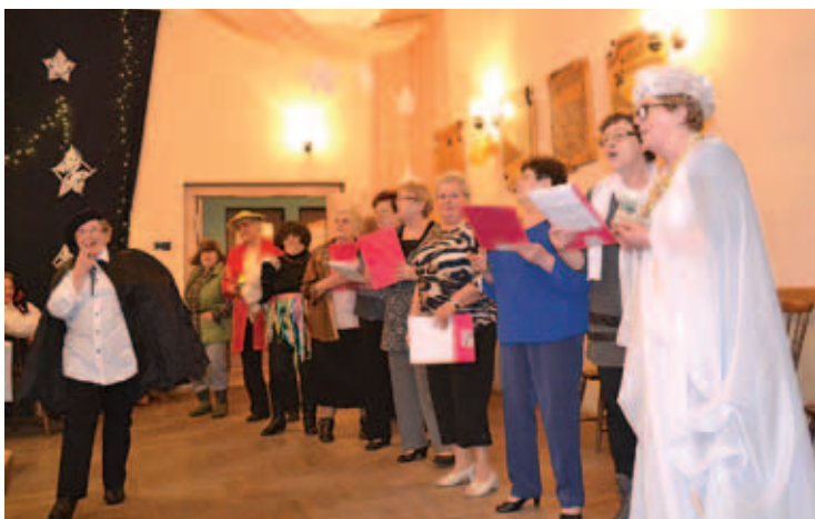
Występ KGW Buczkowice.