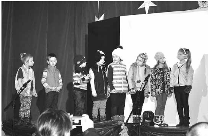
Etiuda teatralna pn. „Kolorowy śnieg”.