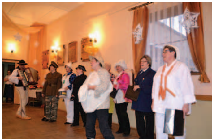
Popis wokalny KGW Kalna.

Tradycją stało się już, że w tłusty czwartek każdego roku członkinie gminnych kół gospodyń wiejskich z Buczkowic, Rybarzowic, Godziszki i Kalnej spotykają się na integracyjnym spotkaniu, zwanym w skrócie „Babskie Ostatki”.