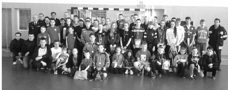
Z.W. Uczestnicy zawodów.