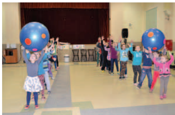
Animacje z wielkimi piłkami.

Drugi tydzień zimowiska rozpoczął się ponownie zajęciami ceramicznymi, na których tym razem dzieci robiły talerzyki na swoje drobiazgi. Świetną zabawę zapewniły animacje z ogromnymi piłkami. W kolejnych dniach dzie-