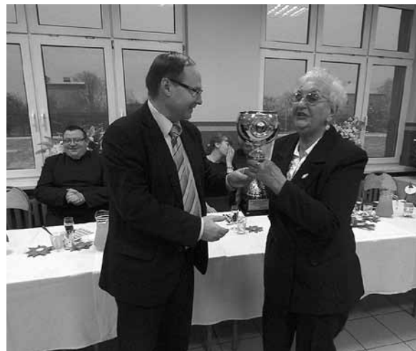
Puchar dla stowarzyszenia od I wicewojewody śląskiego.