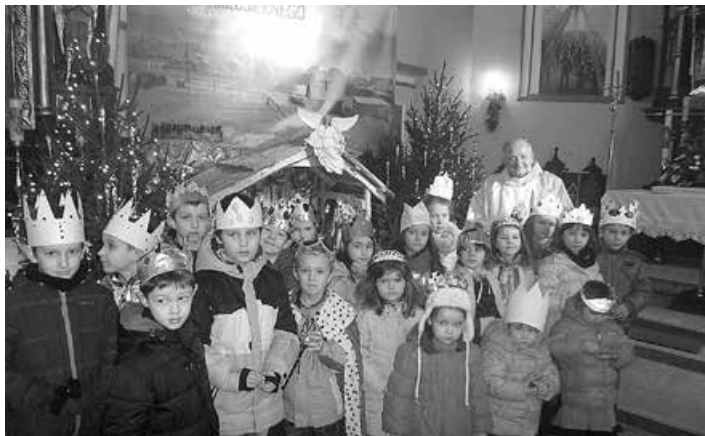
Orszak w Godziszce.