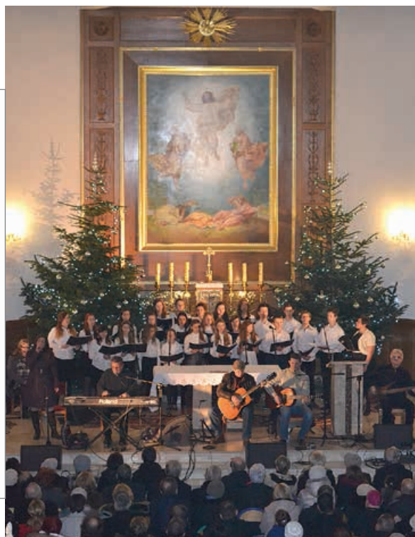
W czasie koncertu.

Na zakończenie koncertu ksiądz proboszcz w imieniu całej wspólnoty parafialnej i wszystkich gości poprosił Skaldów o zagranie i zaśpiewanie znanych