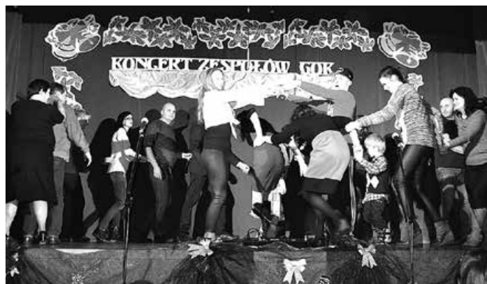
Show w wykonaniu instruktorów i publiczności koncertu.