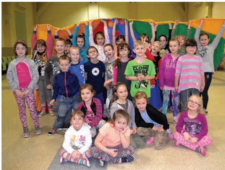
Uczestnicy zajęć animacyjnych GOK.

Również Gminny Ośrodek Kultury w Buczkowicach oferuje różnorodne formy zajęć feryjnych dla dzieci – odbywają się one w budynku Sokolni. Podopieczni GOK w tym roku po raz pierwszy mają okazję pojechać też na jednodniową wycieczkę do Muzeum Fauny i Flory Morskiej i Śródlądowej do Jaworza oraz do krainy dziecięcej radości i zabawy Zabawowo w Bielsku-Białej. Uczestnicy zimowiska biorą udział w zabawach animacyjnych z balonami, wielkimi piłkami, gazetami, chustą Klan-