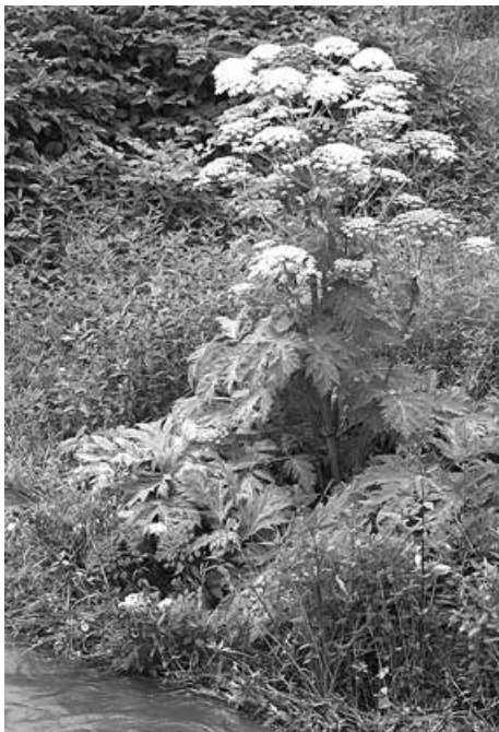
Barszcz Sosnowskiego w okresie kwitnienia.

Włoski na liściach i łodygach barszczu Sosnowskiego wydzielają substancję parzącą. Roztarte liście lub łodyga mają charakte-