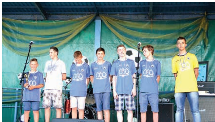
Młodzi piłkarze LZS „Beskid” Godziszka.