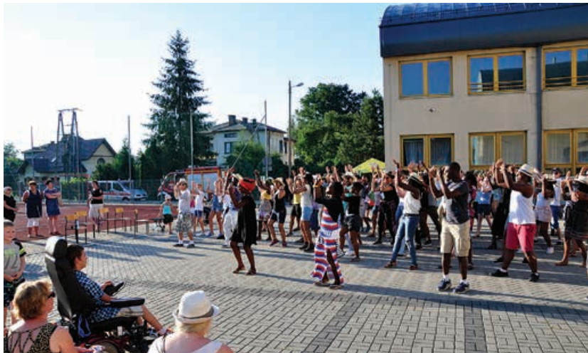
Spotkanie integracyjne w Rybarzowicach.

Na tydzień przed wizytą papieża Franciszka w Krakowie, młodzież z całego świata przyjechała do Polski na Dni w Diecezjach. Parafie Buczkowice i Rybarzowice miały możliwość goszczenia młodych w swoich domach. 42 gości przyjęto w 21 domach w Buczkowicach, w Rybarzowicach 15 rodzin gościło 35 mieszkańców Francji. Był to czas poświęcony nie tylko modlitwie, ale też integracji i zapoznawaniu się z innymi kulturami. Obie parafie były przygotowane na goszczenie większej ilości pielgrzymów, jednak do Polski przybyło ich mniej niż pierwotnie zakładano. Na szczęście parafianie, do których goście nie dotarli, mogli zapoznać się z gośćmi podczas wspólnej integracji i codziennego Apelu Jasnogórskiego.