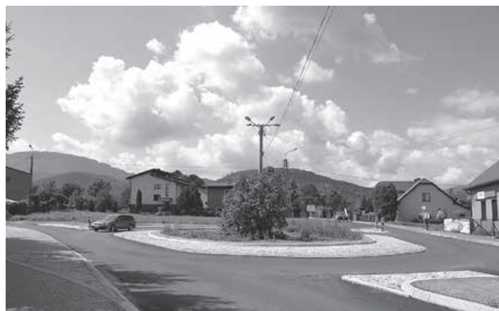
Nowo powstałe rondo w Godziszce.