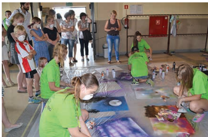
Pokaz sprejowania podczas uroczystego podsumowania.

Projekt pn. „Ubarwić rzeczywistość” realizowany przez GOK Buczkowice został dofinansowany w ramach Programu Polsko-Amerykańskiej Fundacji Wolności „Równać Szanse 2015” – Regionalny Konkurs Grantowy administrowanego przez Polską Fundację Dzieci i Młodzieży.