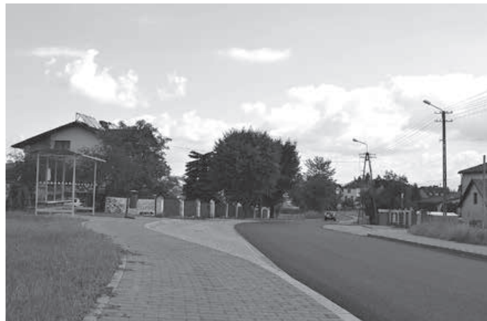
Złotka autobusowa, nowy chodnik i asfalt w Kalnej.

Modernizacja dróg powiatowych z Buczkowic do Kalnej jest największą drogową inwestycją na terenie gminy, jednocześnie długo wyczekiwana, z uwagi, że czekaliśmy na przekazanie do użytku drogi ekspresowej S-1, na którą przeniósł się obecnie ruch tranzytowy. Prace prze-