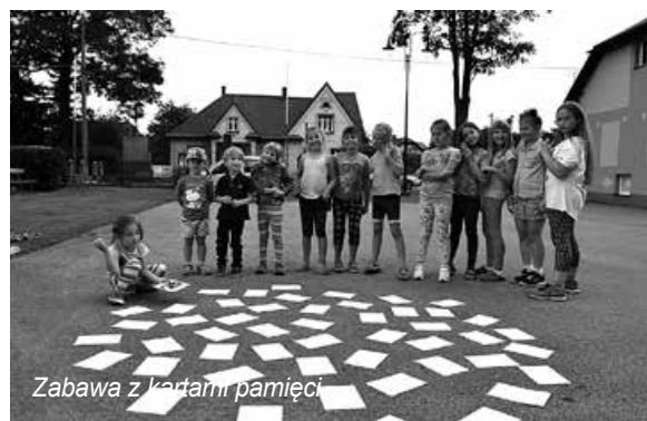
Zabawa z kartami pamięci