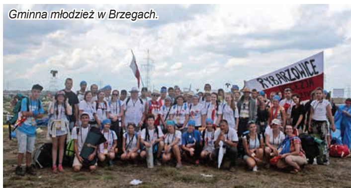
Gminna młodzież w Brzegach.

Jednym z bardziej wyczekiwa-nych religijnych wydarzeń tegorocz-nych wakacji w Polsce były niewąt-pliwie Światowe Dni Młodzieży, które jak wiadomo tym razem odbywały się w Krakowie. Światowe Dni Młodzie-ży rozpoczęły tak zwane Dni w Die-cezjach, podczas których także i na-sza gmina gościła młodzież z za-granicy była to młodzież z Francji, z diecezji Saint Denis. Minione wy-darzenia były okazją do integracji międzykulturowej, zdobycia nowych doświadczeń, a przede wszystkim czasem wspólnej modlitwy.