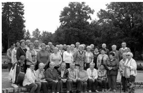
Emeryci w Parku Zdrojowym.

Następnym etapem było zwiedzanie Muzeum Papiernictwa w Dusznikach Zdroju, bezcennego w skali światowej zabytku techniki. Papiernia dusznicka jest jedynym do dziś działającym obiektem tego typu w Polsce i jednym z nielicznych w Europie. Ogromnym zainteresowaniem zwiedzających cieszył się pokaz produkcji papieru metodą czerpania i wyciskania pojedynczego arkusza, tak jak cztery wieki