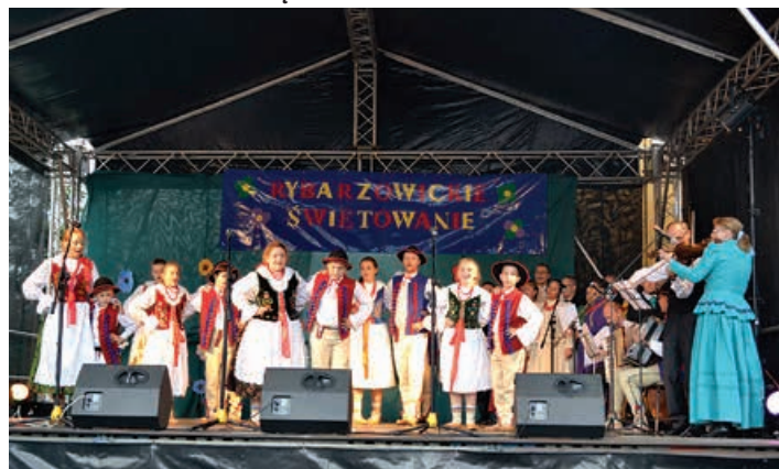
Młodsza grupa RZPiT „Rybarzowice”.