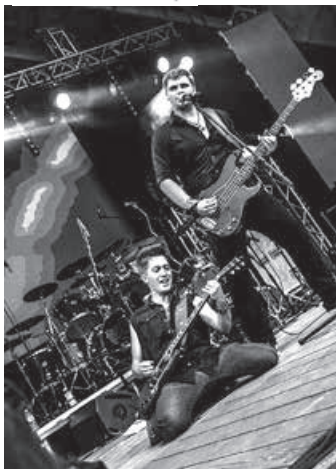
Zespół Diversity podczas koncertów.

ganizowanego przez Antyradio. W tym roku do przeglądu zgłosiło się ok. 600 zespołów, było wiele etapów konkursowych, ostatecznie wybrano 8 finalistów, którzy wystąpili na tym legendarnym festiwalu. Diversity udało się pokonać konkurencję i znaleźć w finałowej ósemce. Kolejnym niebagatelnym osiągnięciem zespołu są pozytywne recenzje ich muzyki, które otrzymują od znanych muzyków (m.in. Grzegorz Markowski, Wojciech Worda, Jacek Stachurski), którzy twierdzą, że to, co robią jest oryginalne i nie ma w kraju wielu zespołów grających muzykę w takim stylu, dlatego war-