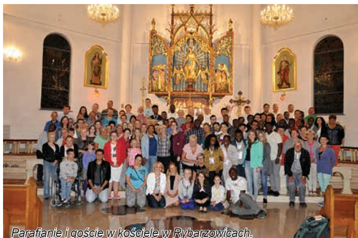
Parafianie i goście w kościele w Rybarzowicach.