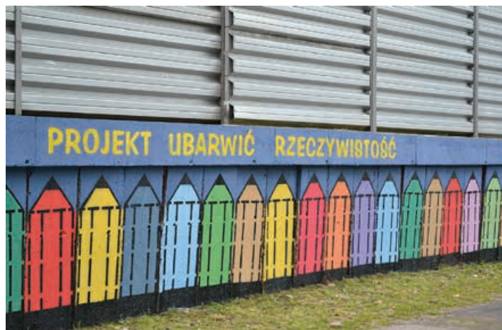
Nowy mural w Buczkowicach.