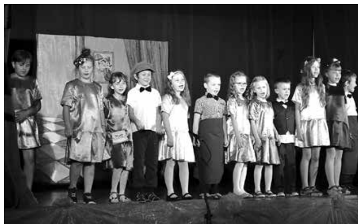
„Pchła Szachrajka” w wykonaniu grupy Zabawy w Teatr.

Na koniec popisów teatralnych, po długich zmaganiach związanych ze zmianą dekoracji za kulisami, zaprezentowa-