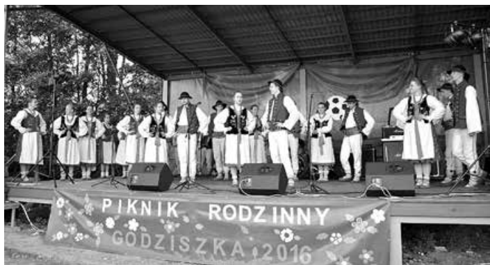
Zespół Pieśni i Tańca „Ziemia Beskidzka” z Mesznej.