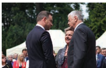
Józef Bożek z małżonką odbierają gratulacje prezydenta Andrzeja Dudy.