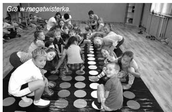
Gra w megatwisterka.