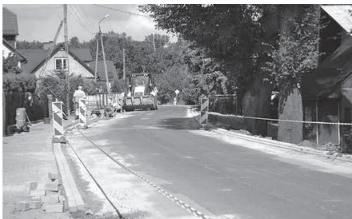
Remont ul. Lipowskiej w Buczkowicach.