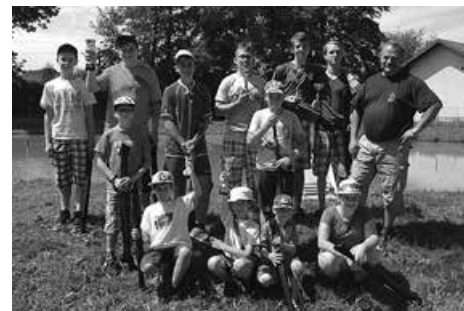
Uczestnicy akcji Wakacje inaczej.