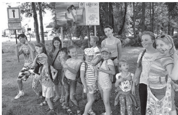
Uczestnicy Wakacyjnych Podchodów GOK.