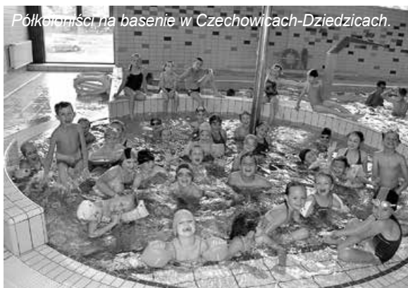
Półkoloniści na basenie w Czechowicach-Dziedzicach.