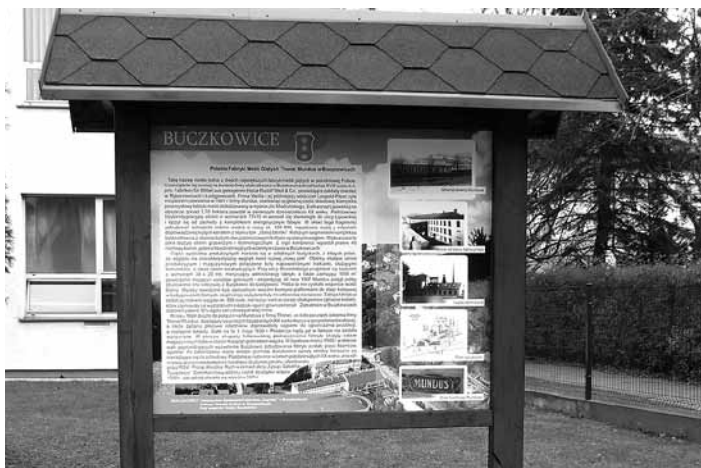
Tablica przy ZSO w Buczkowicach.