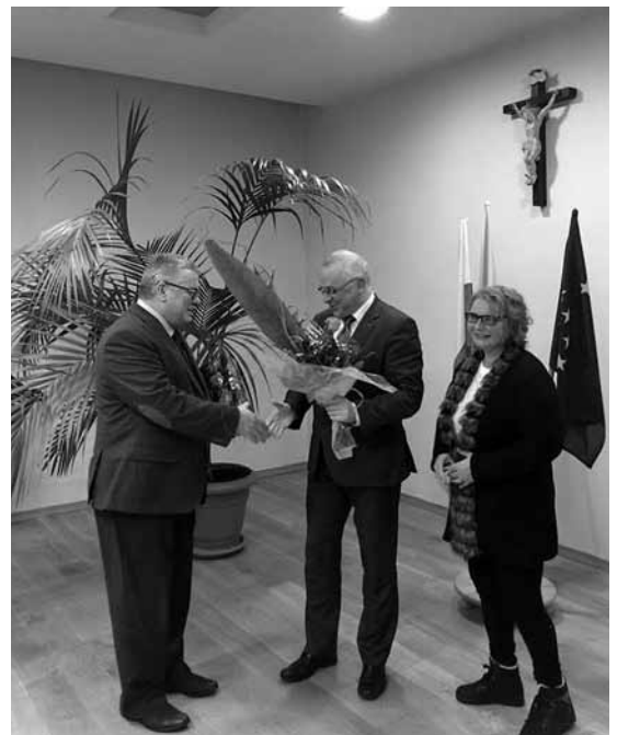
Podziękowania dla starosty Andrzeja Płonki.