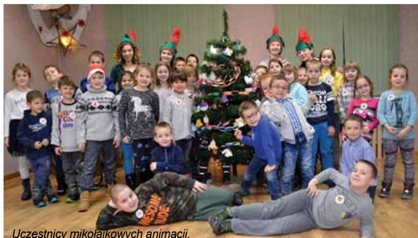
Uczestnicy mikołajkowych animacji.