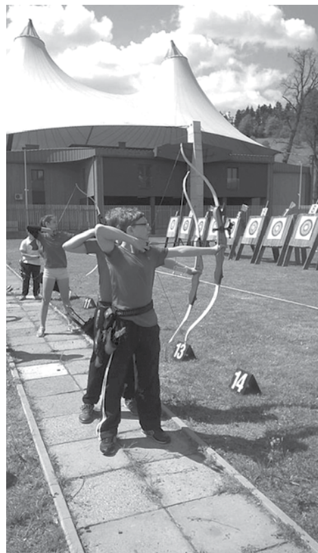
Zawody w Żywcu.