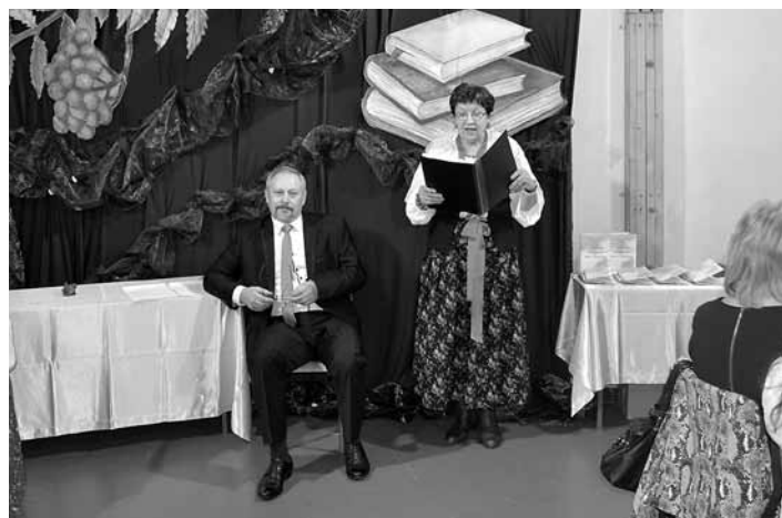
Promocja tomiku bajek i opowiadań. Więcej zdjęć na str. 27

Dziękuję za życzenia, które serdecznie odwzajemniam. Czytelnikom Gazety Gminnej życzę