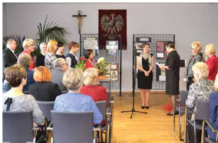
Gratulacje dla biblioteki.