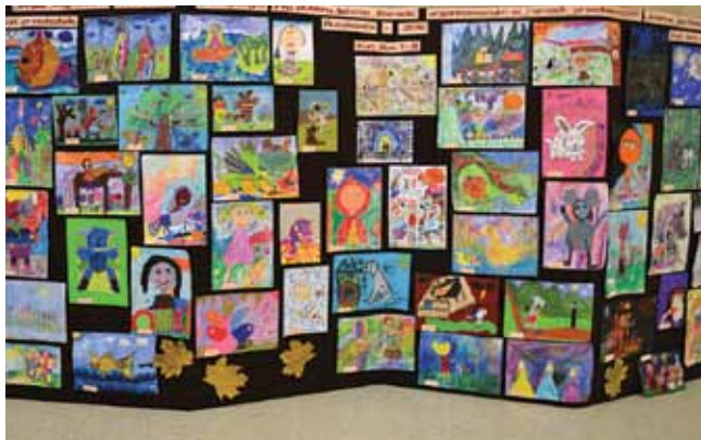
Wystawa nagrodzonych prac.