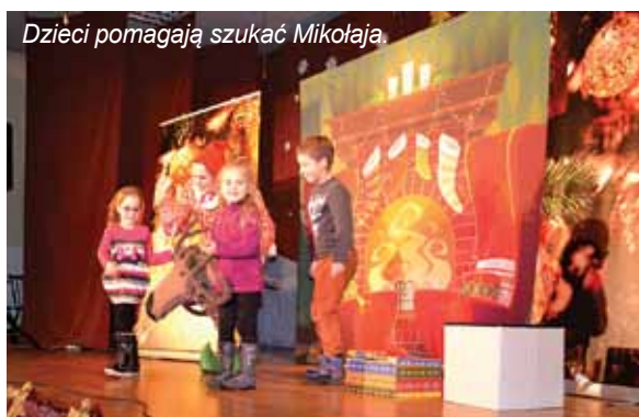
Dzieci pomagają szukać Mikołaja.