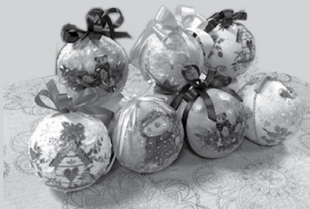
Świąteczne bombki wykonane przez uczestniczki warsztatów decoupage GOK Buczkowice.

☀ Niech magiczna noc wigilijnego wieczoru przyniesie spokój i radość. Niech każda chwila świąt Bożego Narodzenia żyje własnym pięknem, a Nowy Rok obdaruje pomyślnością i szczęściem życzą przewodniczące Gminnych Kół Gospodyń Wiejskich