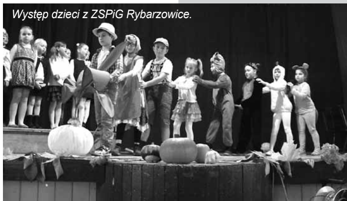
Występ dzieci z ZSPiG Rybarzowice.