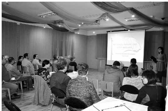
Prelekcja o Nowej Zelandii.

W trakcie pobytu nie zabrakło wrażeń i atrakcji, które rozpoczęły się już w samolocie, który o zgrozo zaczął się palić!