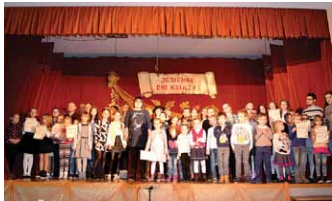
Laureaci wojewódzkich konkursów.

Już od 16 lat Gminny Ośrodek Kultury oraz Gminna Biblioteka Publiczna w Buczkowicach wraz z filiami wnoszą swój wkład w rozwój czytelnictwa i budzenie zainteresowania książką wśród mieszkańców województwa śląskiego i nie tylko. Dzieje się to za sprawą organizowanego corocznie przedsięwzięcia – Jesienne Dni Książki.