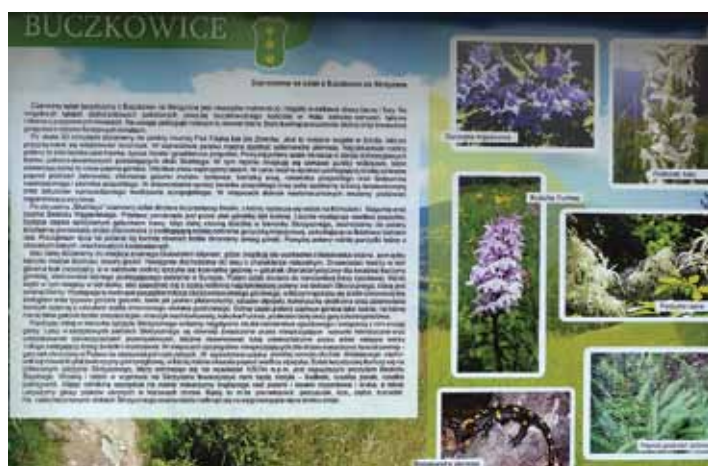
Tablica na szlaku z Buczkowic na Skrzyczne.