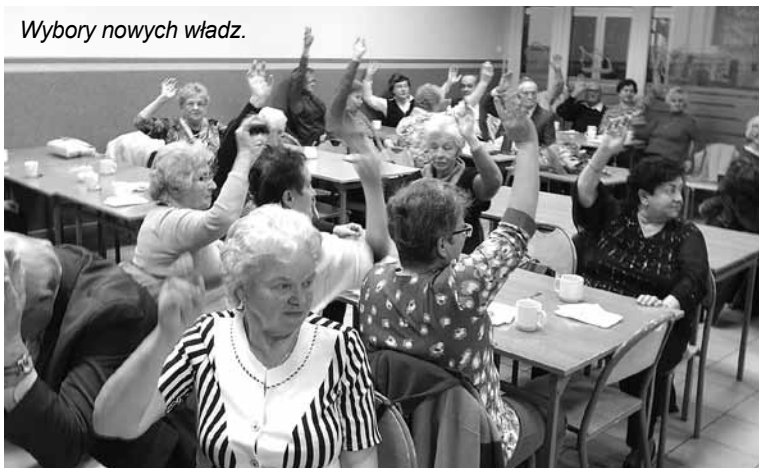
Wybory nowych władz.