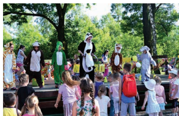
Animacje firmy Feniks.