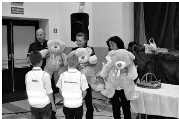
Uroczyste wręczenie nagród.