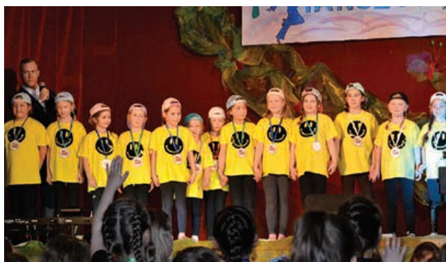
Wręczanie medal Super Tancerz.