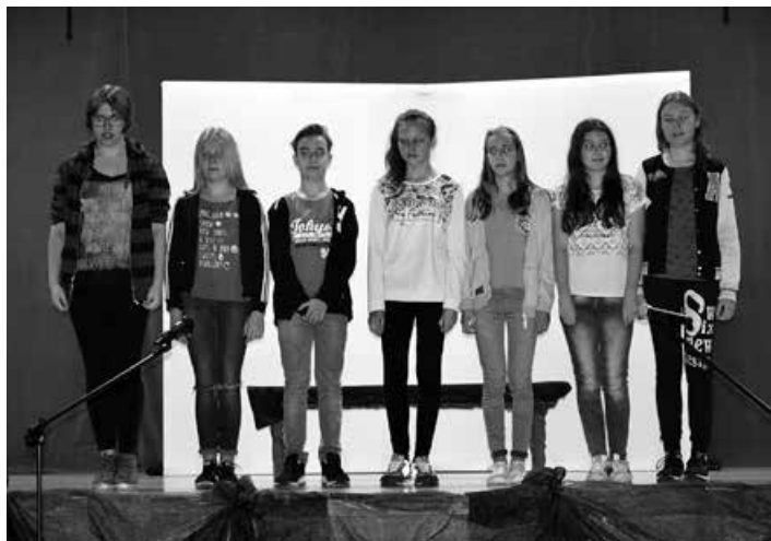
Zespół No Name z Rybarzowic.