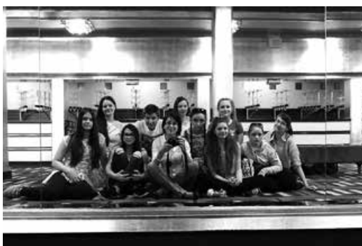
W teatrze Capitol.

Myślę, że śmiało wypad uznać można za udany, a nawet bardzo, nie pozostaje więc nic innego tylko zbierać oszczędności, by wrócić tam jeszcze raz. E.J-P