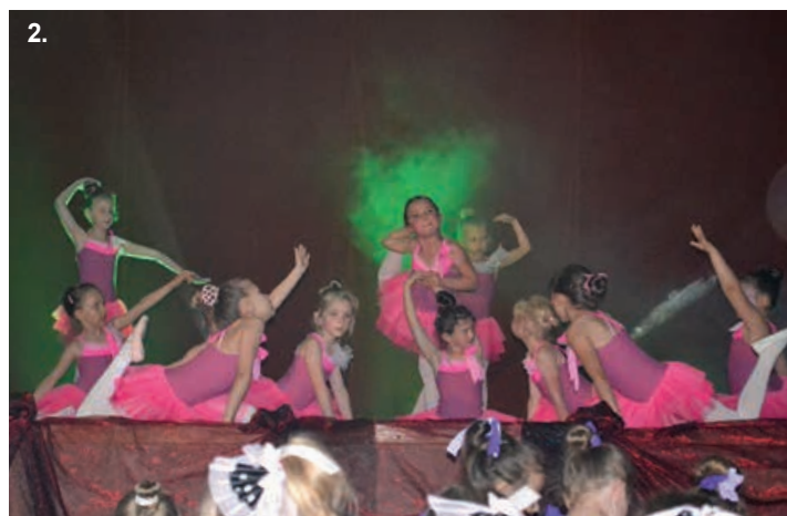
1. Grupa modern jazz. 2. Grupa baletowa.