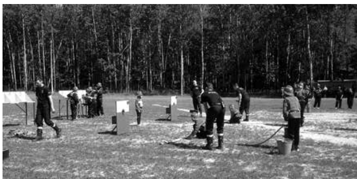
Gminne Zawody MDP.