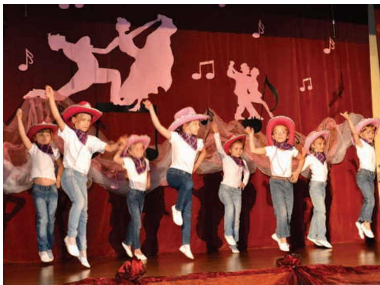
Przedszkolaki z Kalnej.