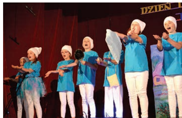
Grupa teatralna Zabawy w teatrze.