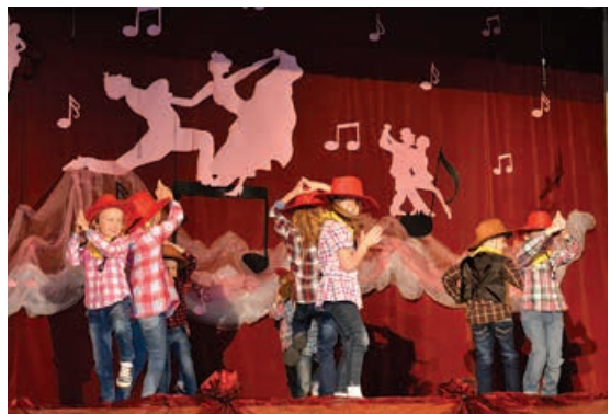
Przedszkolaki z Rybarzowic.