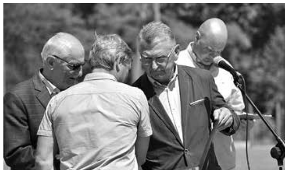
Uroczyste gratulacje na ręce prezesa składają przedstawiciele z BOZPN.

Chcemy też wyrazić wdzięczność władzom samorządowym za stworzenie warunków umożliwiających prowadzenie działalności sportowej; dotyczy to stworzenia bazy sportowej i wsparcia finansowego jakie otrzymujemy co roku z budżetu gminy Buczkowice w formie dotacji na realizację