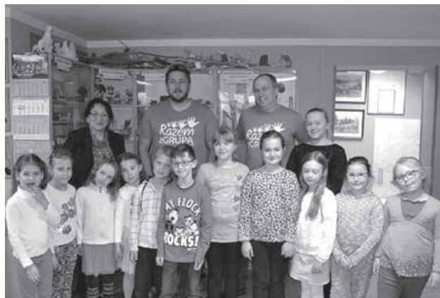
Na zdjęciu: Grupa uczestników projektu z przedstawicielami firmy Aluprof S.A. i instruktorką zajęć.

Projekt „Ecodeco w Buczkowicach” realizowany przez GOK Buczkowice przy wsparciu pracowników firmy Aluprof S.A. został dofinansowany w ramach realizowanego przez Grupę KĘTY S.A. programu „Razem z Grupą”.