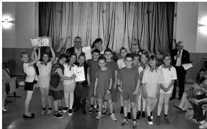
Uroczyste wręczenie nagród.