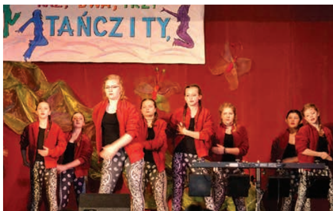
Shocking Team z Godziszki.