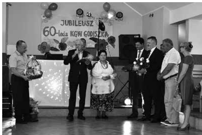
Gratulacje i życzenia.