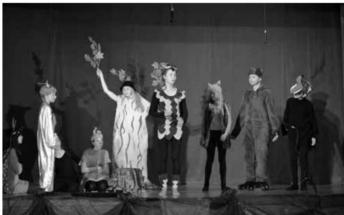
Grupa teatralna Invento.