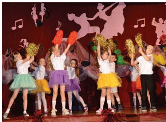
Przedszkolaki z Buczkowic.