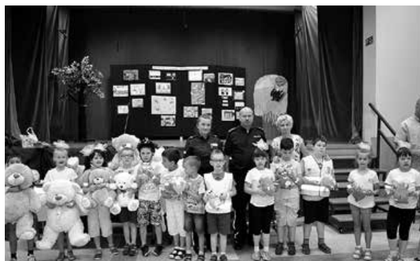
Laureaci z Godziszki.