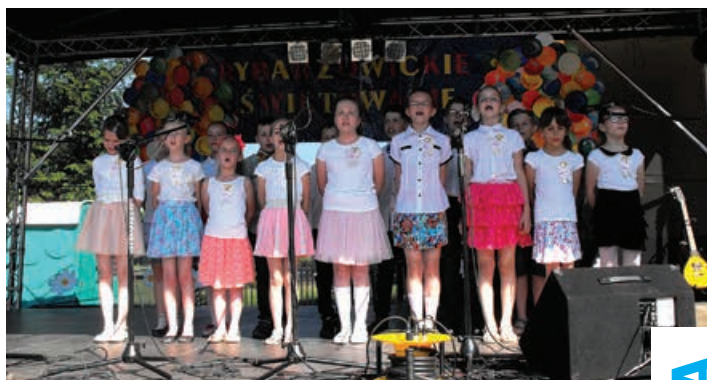
Paka muzycznie zgrana.