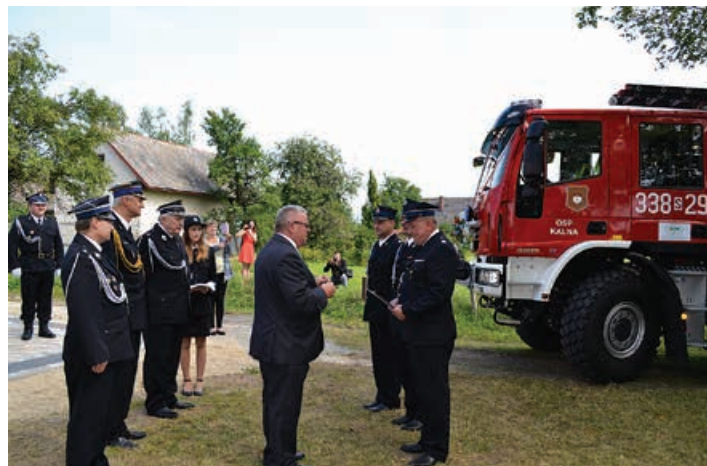
Wójt gminy Buczkowice wręcza klucze do nowego samochodu.