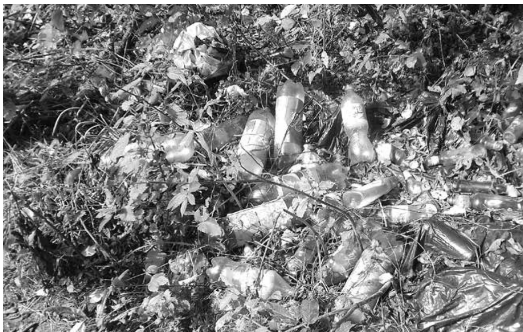
Tak właśnie wyglądają zanieczyszczone tereny w okolicach ul. Nad Brzegiem w Rybarzowicach przy przejeździe przez Żylicę.