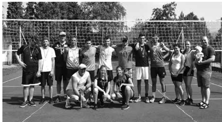
Uczestnicy Plenerowego Turnieju Piłki Siatkowej Dwojek i Trójek.