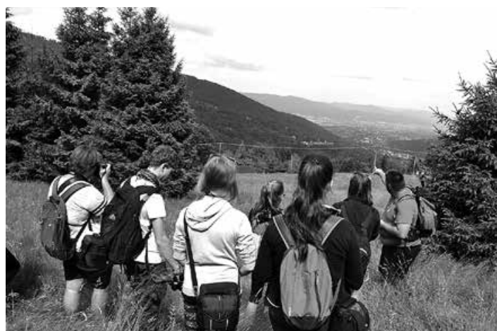
Wakacyjny plener fotograficzny z Szymonem Baronem.