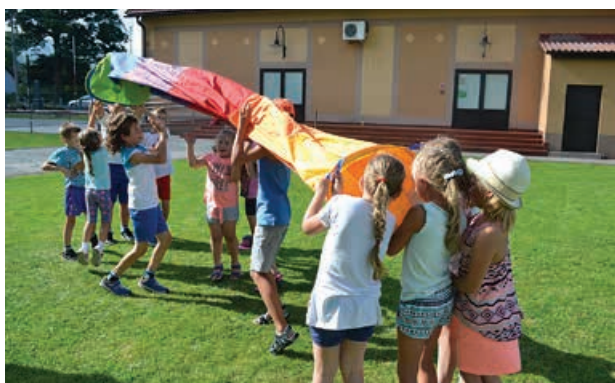
Zabawy z tunelem animacyjnym.