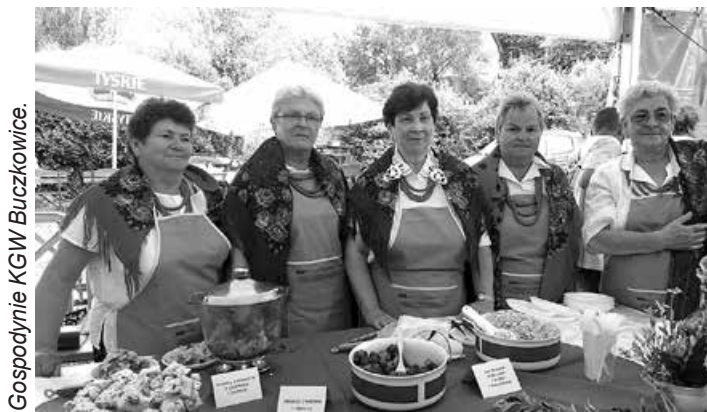
Gospodynie KGW Buczkowice.

Stałym punktem dorocznego święta powiatu bielskiego jest Przegląd Potraw Regionalnych „Kulinarne dziedzictwo polsko-czeskiego pogranicza” realizowany w ramach mikroprojektu pn. „Kultura w kalejdoskopie – promocja atrakcji kulturowych polsko-czeskiego pogranicza”. W tym roku Dni Powiatu Bielskiego odbyły się 1 lipca w gminie Wilkowice dokładnie na terenie Ochotniczej Straży Pożarnej w Bystrej. 37 Kół Gospo-