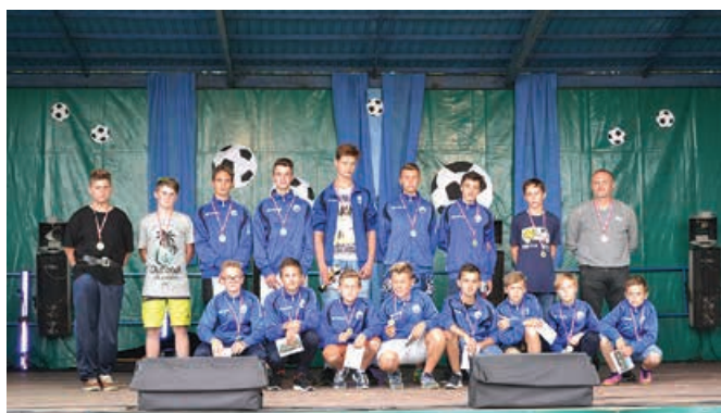
Trampkarze LZS „Beskid” Godziszka.