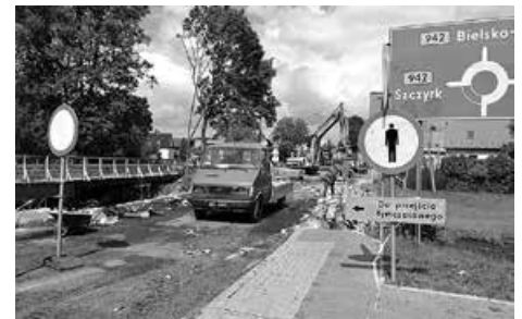
PRZEBUDOWA MOSTU NA POTOKU ŻYLICA – dok. ze str. 1

W związku z rozbiórką istniejącego mostu, zamknięty jest fragment ul. Lipowskiej na odcinku pomiędzy istniejącym rondem, a skrzyżowaniem z ul. Franciszka Miodońskiego. Objazd odbywa się ul. Wiślańską (Buczkowice), Beskidzką, Graniczną (Szczyrk) i Grunwaldzką, Lipowską (Buczkowice). Ruch pieszy i rowerowy utrzymany jest po tymczasowej kładce zlokalizowanej przy remontowanym moście. Zadanie zakłada rozbiórkę istniejącego mostu wraz z budową nowego w ciągu DP 1405S ul. Lipowska w Buczkowicach oraz przebudowę drogi powiatowej na długości dojazdów do obiektu.