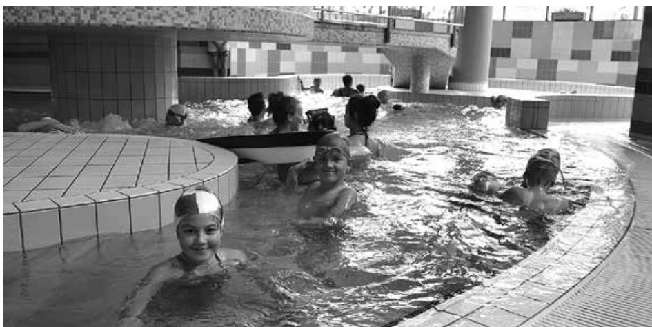
Półkoloniści w Parku Wodnym Aquarion.

Furorę zrobiły również zajęcia niespodzian-