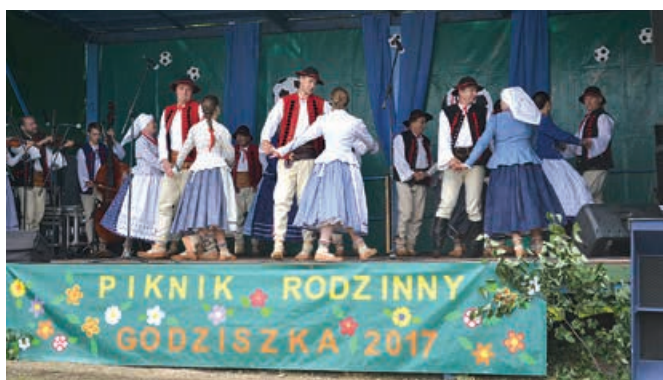
Regionalny Zespół Pieśni i Tańca „Lipowianie”.