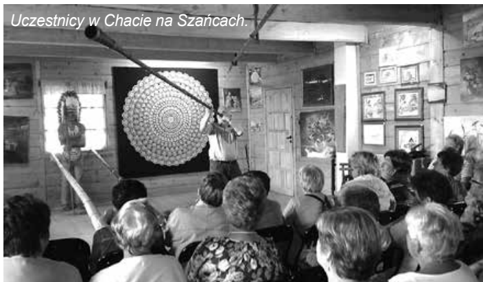
Uczestnicy w Chacie na Szańcach.