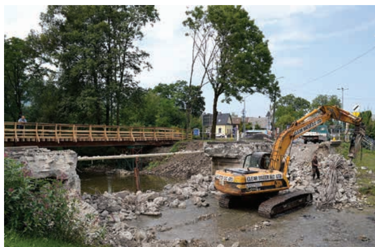
Most w trakcie rozbiórki.