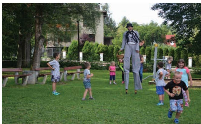
Animacje ze szczudlarzem.