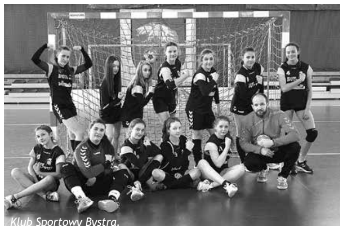
Klub Sportowy Bystra.

Zawodniczki KS Bystra z rocznika 2003 to kilkanaście wspaniałych, pracowitych, kulturalnych i zarazem bardzo walecznych dziewcząt z różnych miejscowości. 12 z nich uczęszcza do gimnazjum w Bystrzy, kilka pozostałych dojeżdża na popołudniowe treningi. Mają 10 godzin wychowania fizycznego, treningi, mecze, turnieje - czyli czas wypełniony po brzegi. Piłka ręczna stała się dla nich najważniejsza. W drużynie jest grupka dziewcząt z Bystrzy i Mesznej oraz obecnie sześć dziewcząt z Biel-