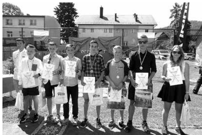
Zdolni uczniowie SMS Szczyrk.