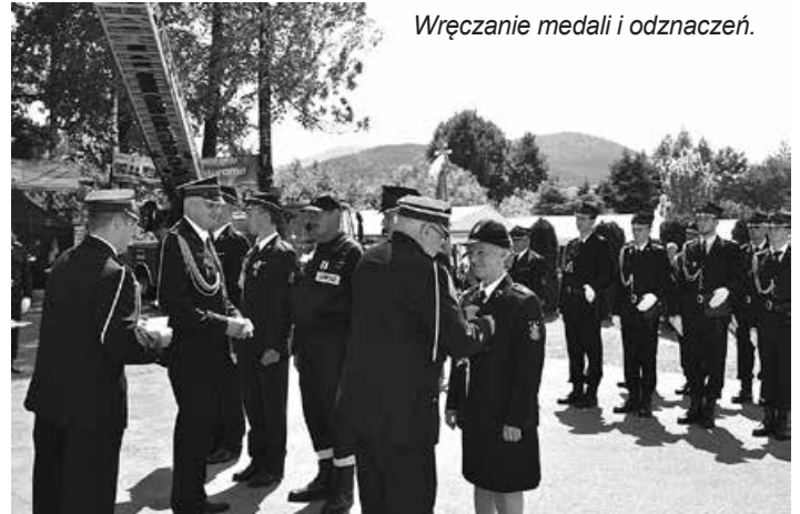
Wręczenie medali i odznaczeń.

Po części oficjalnej zaproszono wszystkich przybyłych na wspólne biesiadowanie i oglądanie występów. Na scenie zaprezentowali się kolejno: mażoretki Gracja, które zachwyciły nie tylko wyglądem, ale także perfekcją przygotowanych układów; Blach-Kapela z Ośrodka Kultury w Jasienicy, która dała wspaniały koncert w stylu czeskiej dechówki;