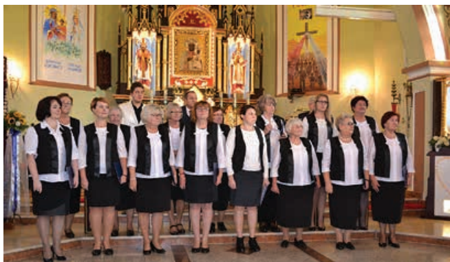
Chór Echo Godziszki.