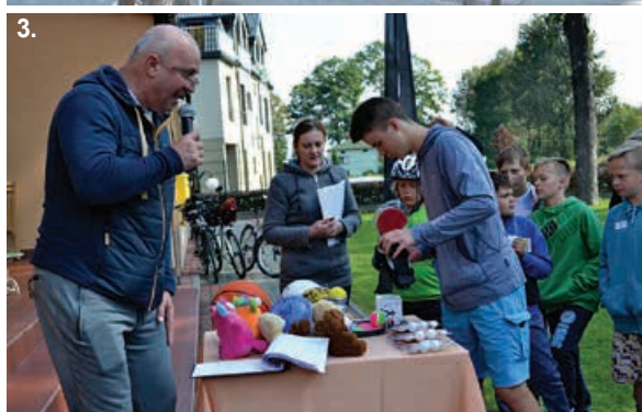
1. Rejestracja uczestników. 2. Wyjazd na trasę rajdu. 3. Wręczenie nagród dla najlepszych za odcinek czasowy. 4. Na mecie rajdu. 5-6. Zdobywcy nagród.