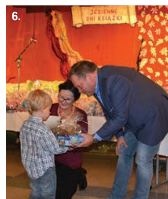
1. Spotkanie z pisarzem w Godziszce. 2. Biblioteka otwarta dzieciom – Buczkowice. 3-6. Uroczyste podsumowanie wojewódzkich konkursów.