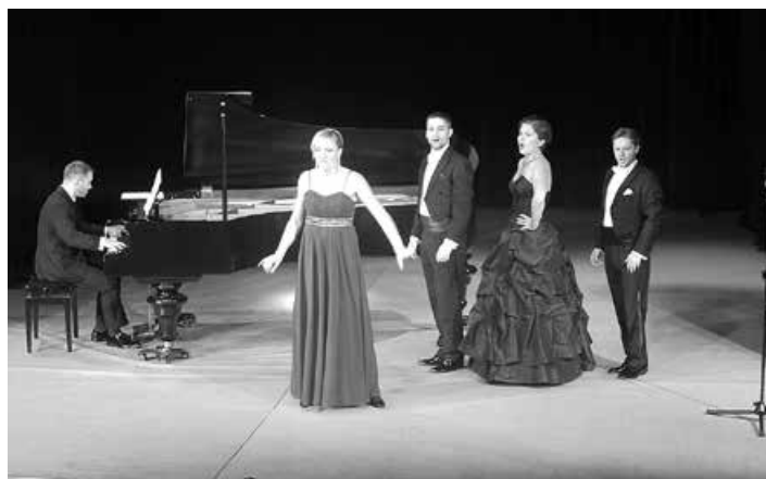
Koncert w Żywcu.