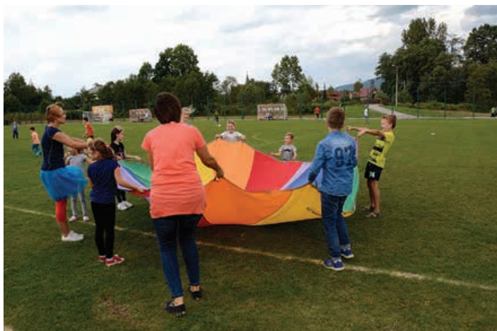
Zabawy z chustą Klanzy.