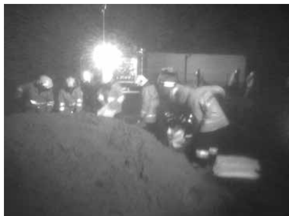
Umacnianie brzegów potoku Bruśnik.