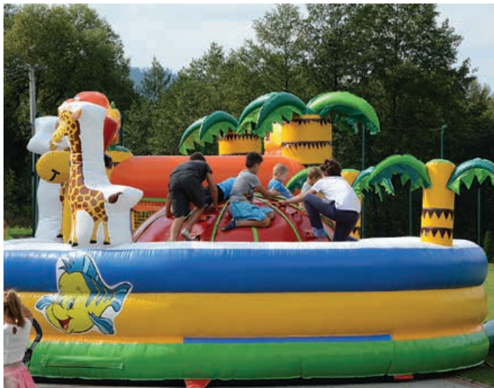
Szaleństwo na dmuchańcach.