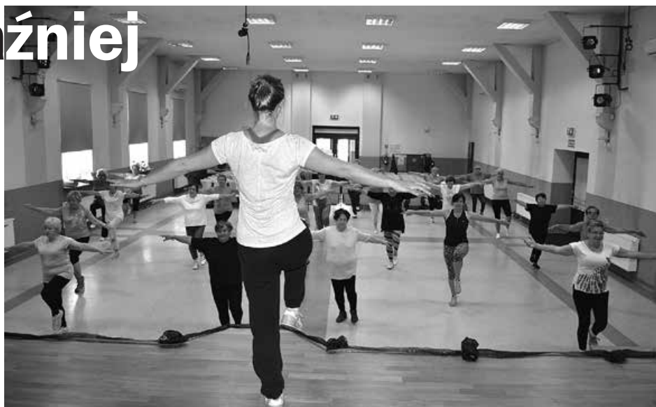
Aerobik dla seniorów.

Zawsze najważniejsza jest rozgrzewka, wystarczy króciutka, ale warto. Zapobiega to niepotrzebnemu urazom. Trening nóg, ćwiczenia izometryczne (nie dla wszystkich wskazane), ćwiczenia