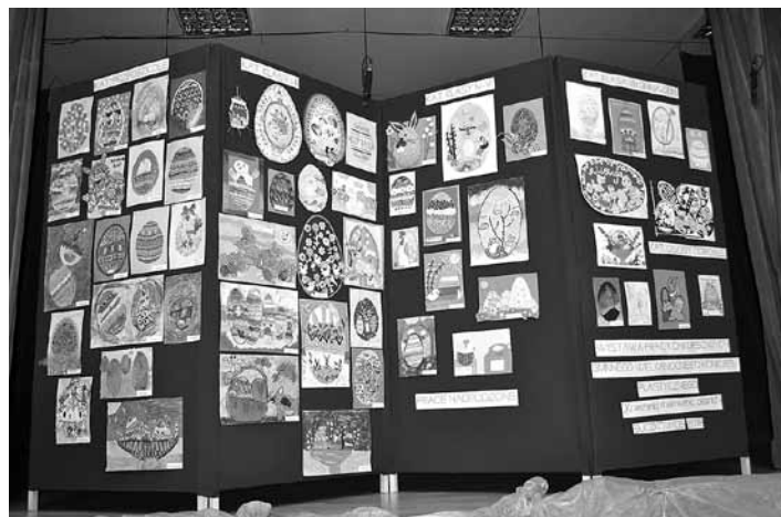
Wystawa nagrodzonych prac.