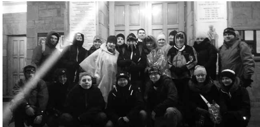
Uczestnicy EDK z Godziszki.