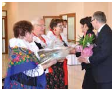
Część oficjalna uroczystości – gratulacje i życzenia od gości.