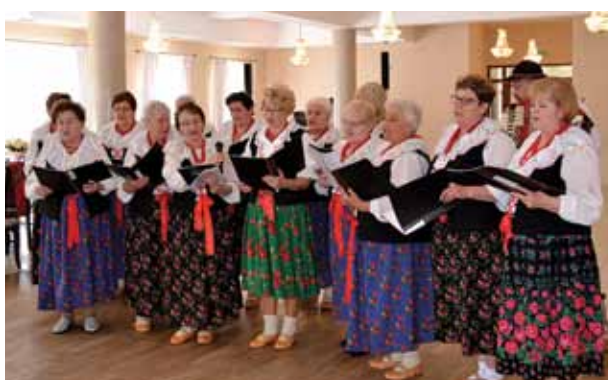
Występ KGW Kalna.