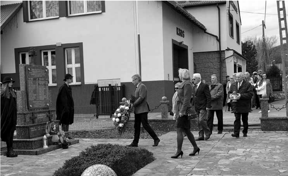
Członkowie TSK „Zagroda” składają kwiaty.

W roku bieżącym rocznicowe obchody odbywały się w szczególnych okolicznościach. W życie weszła bowiem ustawa, która nakazuje unicestwienie m.in. pomników, upamiętniających wydarzenia lub osoby, kojarzące się z propagowaniem komunizmu. Przedmiotem zainteresowania i ideologicznego polowania stał się nasz obelisk, upamiętniający poległych w Buczkowicach żołnierzy radzieckich. Komunizm w Buczkowicach propagowały symbole Związku Radzieckiego – sierp i młot oraz pięcioramienna gwiazda, które poległym żołnierzom towarzyszyły na bojowym szlaku, podobnie jak polskich żołnierzy prowadził do walki orzeł biały – symbol naszego państwa. Na do datków żołnierze radzieccy walczyli o Polskę Ludową. Oni zapewne o tym nie wiedzieli, ale odpowiedzieć nie mogą, bo na naszej ziemi zastała ich śmierć. Tak więc 73 rocznica wyzwolenia wsi spod niemieckiej okupacji była ostatnią, którą obchodziliśmy wspominając pierwszy dzień wolny od niemieckiego okupanta