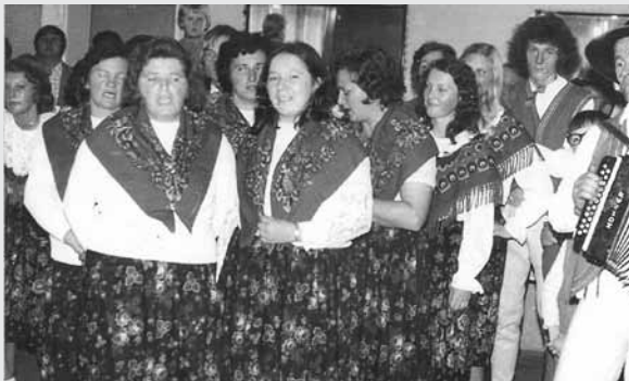
Występ koła w roku 1976.

Słowa uznania otrzymali także organizatorzy za profesjonalne przygotowanie i sprawne przeprowadzenie imprezy.