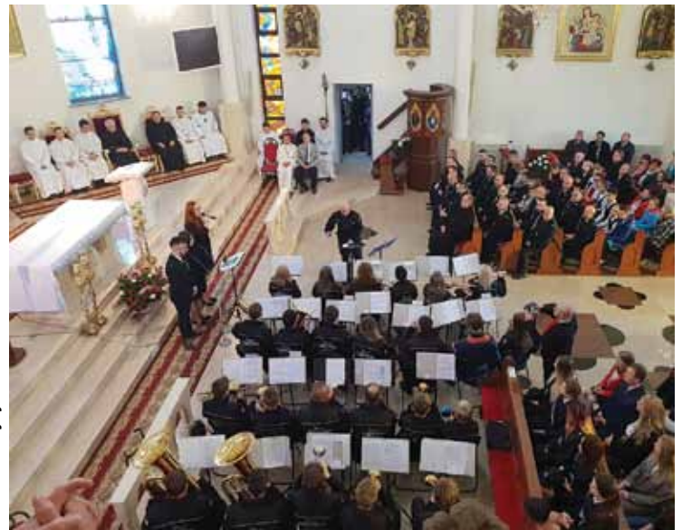
Koncert Młodzieżowej Orkiestry Dętej z Woli.