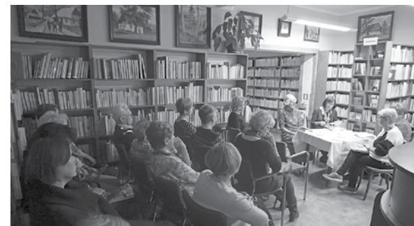
Spotkanie z poezją.

w bibliotece pluszaków. Na koniec Franklin częstował małych gości słodkościami. BJ