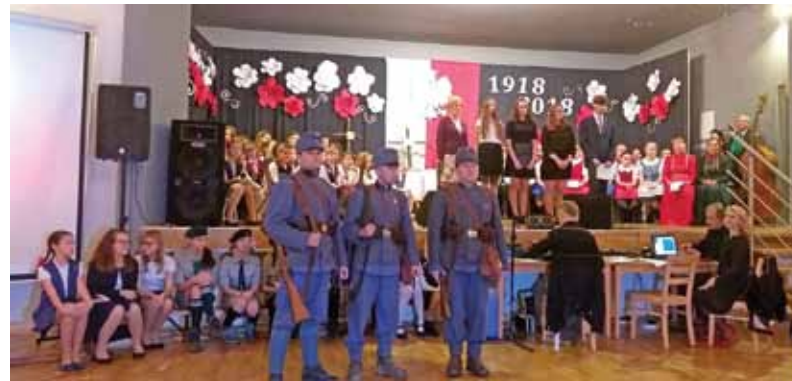
Grupa rekonstrukcyjna z Wadowic.