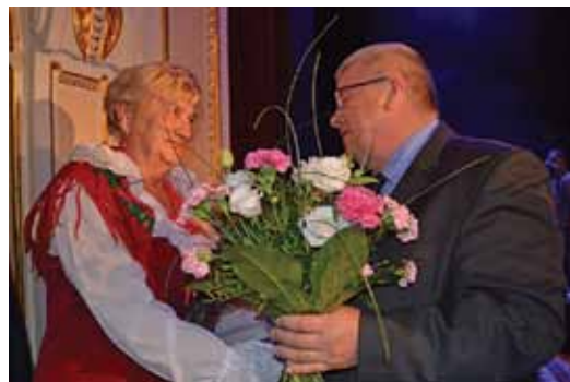
Gratulacje z rąk wójta gminy.