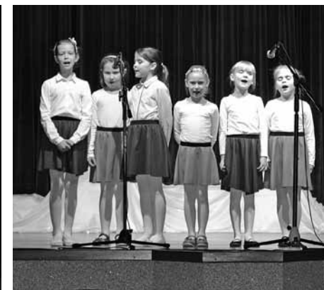
Koncert zespołu „Tutta la Forza”.