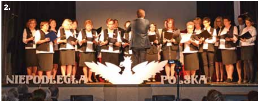
1. Złożenie wieńca pod pomnikami przy ulicy Wyzwolenia w Buczkowicach. 2. Koncert chóru Echo Godziszki. 3-5. Widowisko patriotyczne.