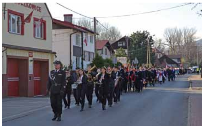
Przemarsz niepodległościowy w Buczkowicach.