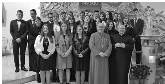
Młodzież bierzmowana z biskupem i księdzem proboszczem.