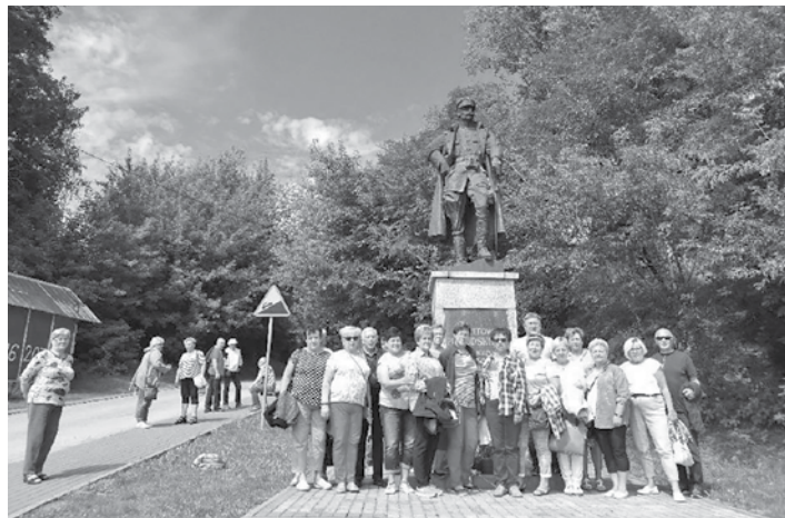
Emeryci z Godziszki podczas jednej z letnich wycieczek.

nasz wyjazd przy ognisku z pieczoną kiełbasą. „Piękna nasza Polska cała” – zgodnie z tym hasłem w lipcu br. wyjechaliśmy na gotycki szlak – Dolinę Dolnej Nidy. Zwiedzaliśmy Wiślicę, Nowy Korczyn, Opatowiec. Wiślica stanowi najcenniejszy zespół zabytkowy na Podniżu. Wielkie wrażenie wywarło na nas wnętrza kolegiaty wiślickiej z połowy XIV w. Nowy Korczyn zauroczył nas zabytkami: kościołem św. Trójcy zwanym farnym z XVI w. oraz synagogą z XVII w., a także późnobarokowymi figurami przydrożnymi. Oczarował nas nieznaną dotąd Opatowiec. Zgodnie trzeba przyznać, że te piękne strony naszej ojczyzny nie były dotąd nam znane. W sierpniu wczesnym rankiem wyjechaliśmy na wycieczkę do naszych sąsiadów do Żyliny, Rajcekiej Leśnej, gdzie znajduje się słowacka betlejemska szopka. Zatrzymaliśmy się także w Čičmanach – malowanej wiosce. Jest tam tradycyjnie ozdabiana ściana malowanymi białymi wzorami. Tradycja ta ma co najmniej kilkadziesiąt lat. Zaglądając w różne zakamarki tej wioski można było oddychać wieloma epokami, fundując sobie inspirującą podróż w czasie. Natomiast Żyliną zachwyciła nas swym pięknym rynkiem. 13 września członkowie naszego koła uczestniczyli w III Zła-