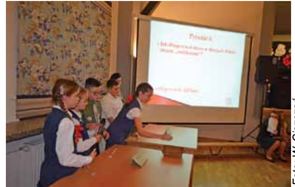
Konkurs wiedzy historycznej.