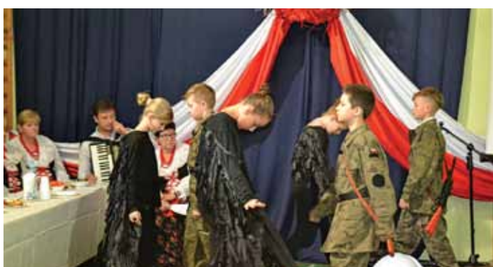
Pantomima pt. „Orzeł Biały”.