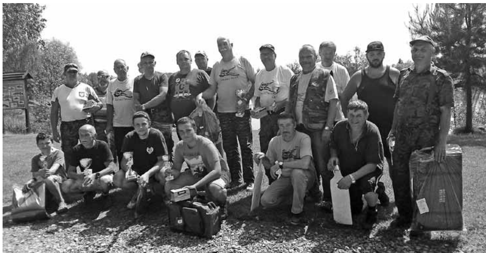
Uczestnicy zawodów o Puchar Wójta Gminy Buczkowice.