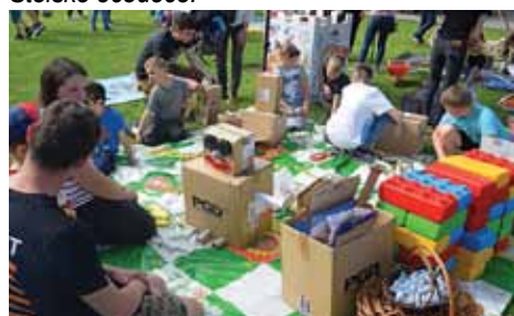
Stoisko Fabryki Radości.