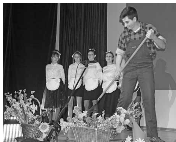
Spektakl profilaktyczny z Godziszki.