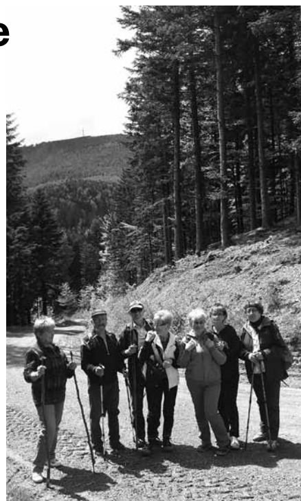
Na szlakach grupa seniorów z projektu Śląska Akademia Senior@.