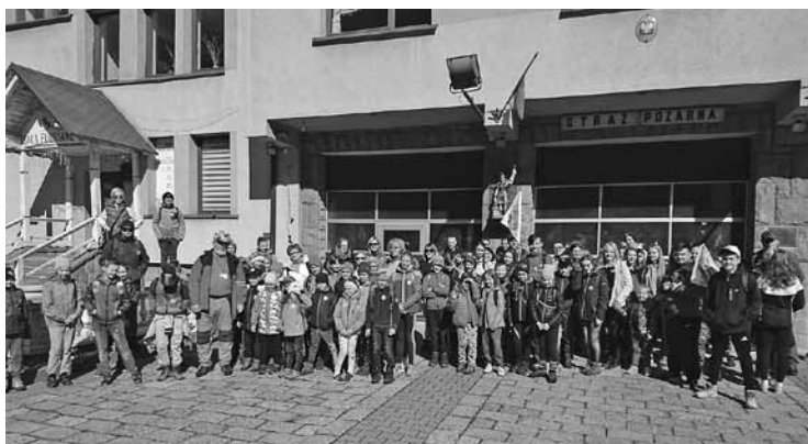
Uczestnicy trasy nr 3.

XXI Wiosenny Rajd Górski „Zielenią się buki” odbył się 1 maja. Do samego końca zastanawiano się, czy uda się zorganizować rajd, bo cały poprzedni tydzień padało, nawet dzień wcześniej też. Jednakże pogoda nas miło zaskoczyła, w dzień rajdu wyszło słońce, to był przyjemny dzień – nie za gorący, nie za zimny – w sam raz na pierwszy rajd górski. Organizatorami rajdu byli: Koło PTTK Buczkowice, Towarzystwo Społeczno-Kulturalne „Zagroda”, Gminny Ośrodek Kultury w Buczkowicach, Miejski Ośrodek Kultury, Promocji i Informacji w Szczyrku oraz Starostwo Powiatowe w Bielsku-Białej.