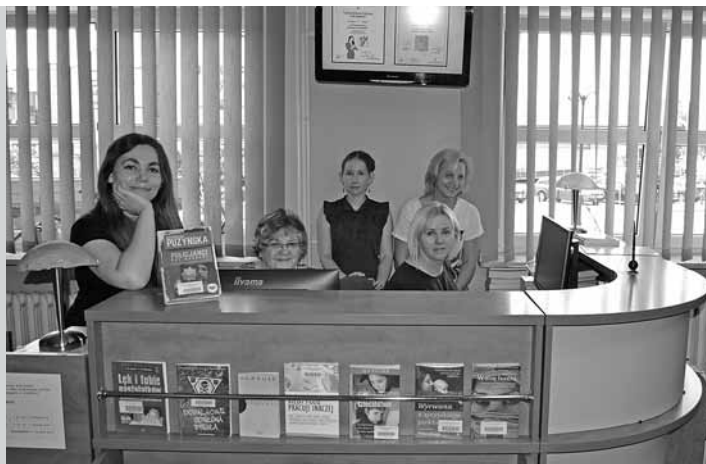
Kadra Gminnej Biblioteki Publicznej.

Konkurs Najlepsza Biblioteka w powiecie bielskim organizuje co roku starosta bielski przy współpracy z Zarządem Oddziału Stowarzyszenia Bibliotekarzy Polskich w Bielsku-Białej i Książnicy Beskidzkiej. Nadrzędnym celem konkursu finansowanego ze środków powiatu bielskiego jest poprawa funkcjonowania oraz zwiększenie konkurencyjności usług świadczonych przez poszczególne placówki biblioteczne w naszym powiecie, a co za tym idzie zwiększenie liczby czytelników.