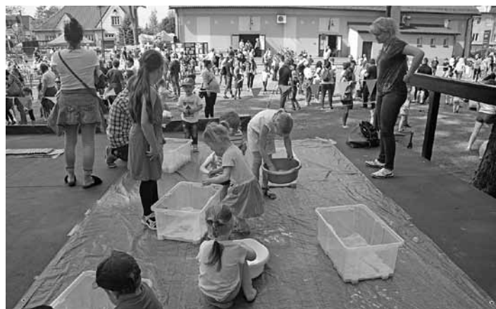
Stoisko Ale Zjawy.

W tym roku podczas Dnia Dziecka „Po zielonej stronie mocy” zorganizowanego przez GOK wiele atrakcji związanych było z promocją edukacji ekologicznej. Dzieci mogły się przekonać, że z rzeczy pozornie nieprzydatnych można stworzyć coś fajnego, świetnie się przy tym bawić i miło spędzić czas. Imprezie to-