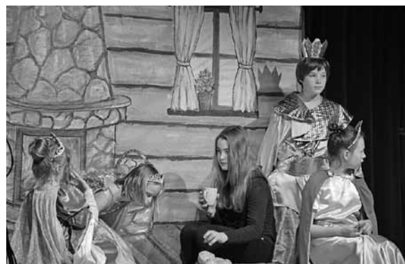
„Królewskie zmartwienia” w wykonaniu Zabawy w teatr.

W klasach IV-VI, I m. zdobył Teatr Dziecięcy Pestka, II Teatr Fika, III grupa teatralna Gminnego Ośrodka Kultury w Buczkowicach Zabawy w teatr, a wyróżnienie teatr Niebieskie Migdały. W klasach VII-VIII i gimnazjum I m. zdobyła Zgrana Paka z GOK w Buczkowicach, II teatr W ostatniej chwili, a III zespół Świetlik. Nagrodę Starosty Żywieckiego zdobyła grupa teatralna Klasa 3b. Nagrodę Starosty Bielskiego otrzymała grupa Dionizos ze Szkoły Podstawowej w Kalnej. Natomiast Grand Prix całego prze-