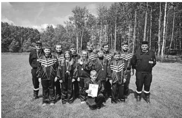
Drużyna z Godziszki.