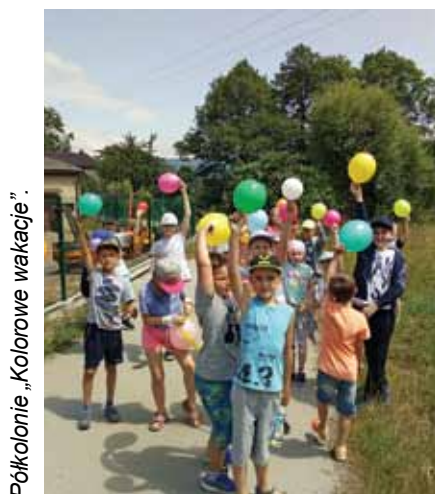
Półkolonie „Kolorowe wakacje”.