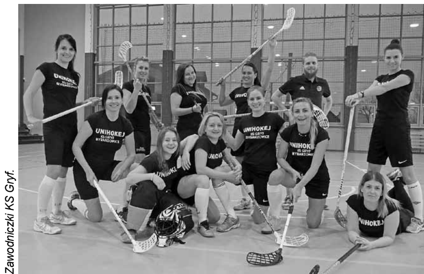
Zawodniczki KS Gryf.