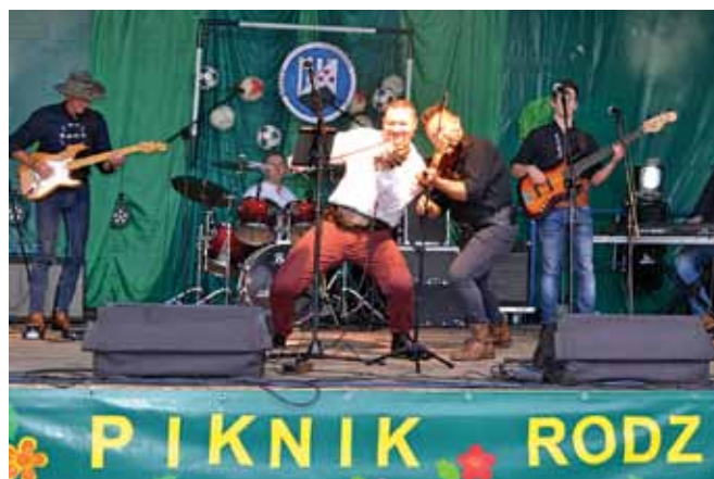
Piknik piłkarski w Godziszce.