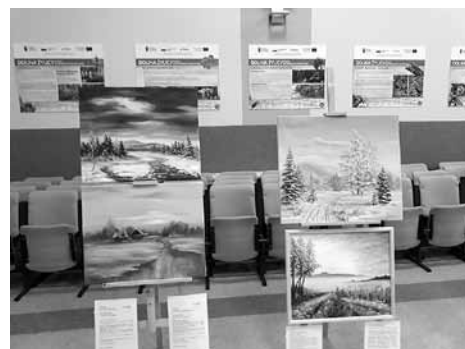
Obrazy galerii Presentoria.