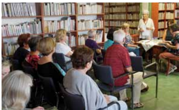
Spotkanie z poezją.