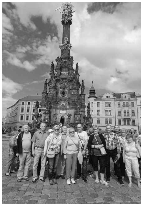
Emeryci w Ołomuńcu.

Lato w „Nadziei” było w tym roku wyjątkowo gorące. Przez trzy miesiące członkowie naszego stowarzyszenia korzystali z różnych form wypoczynku i atrakcji turystycznych. Poznawano nie tylko swój kraj, ale i sąsiednie Czechy. W maju i czerwcu emeryci korzystali z wczasów z elementami rehabilitacji w Jarosławcu w Ośrodku Wypoczynkowym Młynarz położonym na rozległym zalesionym terenie 300 m od plaży. Uczestnicy turnusów skorzystali z zabiegów rehabilitacyjnych według własnych potrzeb zdrowotnych zaleconych przez lekarza. W czerwcu byliśmy na wczasach w Rowach w apartamentowcu Wodnik. Rowy