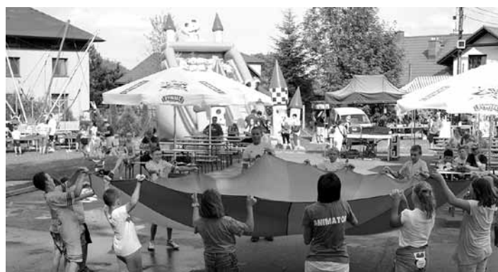
Zabawy animacyjne z chustą klanzy.

Z kronikarskiego obowiązku przypomnieć należy, że impre-