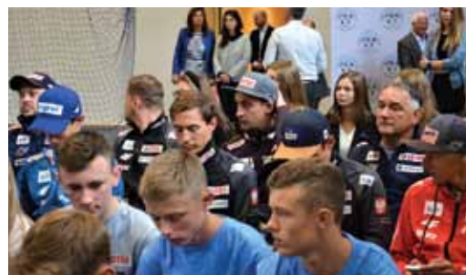
Kadra A polskich skoczków narciarskich w gronie uczniów SMS.