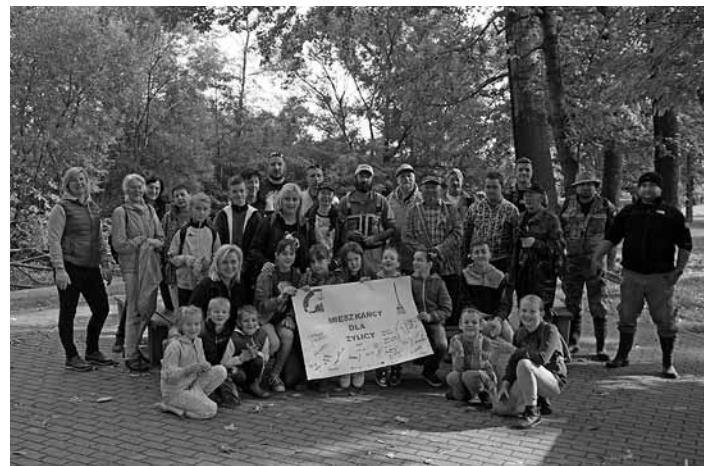
Uczestnicy akcji sprzątania rzeki.

Spotkania w bibliotece oraz akcja sprzątania Żylcy były realizowane w ramach kampanii informacyjno-promocyjnej w zakresie edukacji ekologicznej projektu pn. „Zagospodarowanie terenów przyległych do potoku Żylca wraz z budową ścieżki dydaktycznej w Gminie Buczkwice etap II” współfinansowanego przez Unię Europejską z Europejskiego Funduszu Rozwoju Regionalnego w ramach RPO WSL na lata 2014-2020.