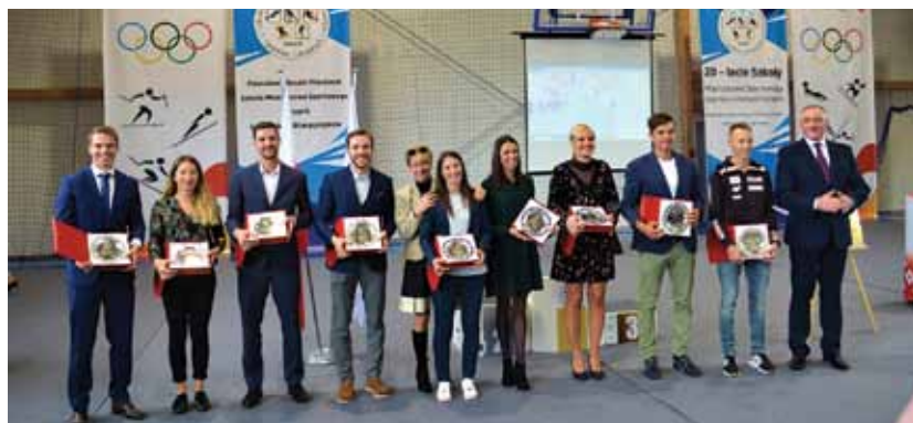
Przybyli olimpijczycy SMS Szczyrk w Buczkowicach.