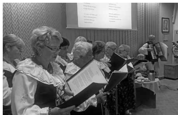
Oprawa artystyczna w wykonaniu KGW Kalna.