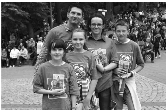
Pielgrzymka do Kalwarii Zebrzydowskiej.