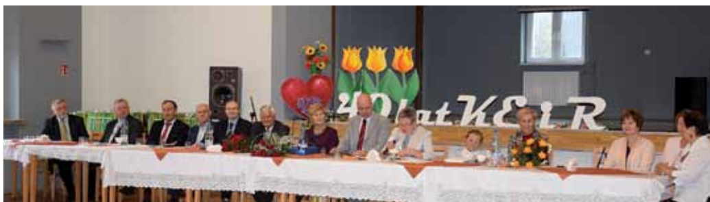
Odczytanie sprawozdania z działalności.