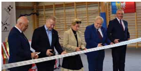
Symboliczne otwarcie obiektu.