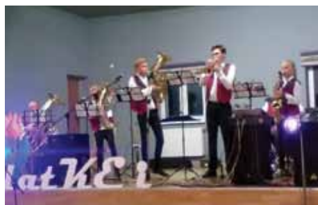
Zespół Fundacji Golec.