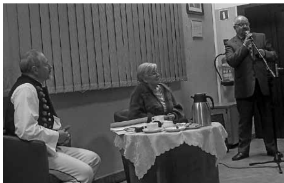
Przywitanie poety przez dyrektora Książnicy Beskidzkiej.