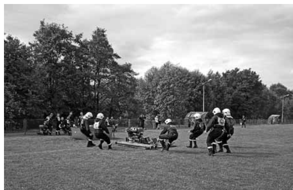
Ćwiczenie bojowe w wykonaniu OSP Rybarzowice.