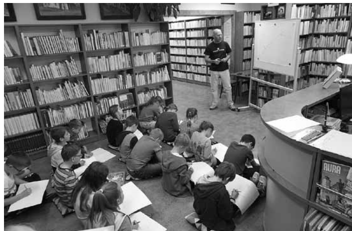
Uczestnicy zajęć ekologicznych.

Organizatorzy zapraszają na kolejne sprzątanie w przyszłym roku i dziękują wszystkim za udział oraz za rozpropagowanie naszej inicjatywy. BJ