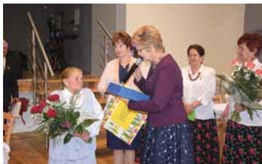
Gratulacje składane na ręce przewodniczącej koła.