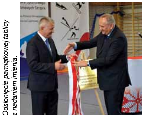
Odsłonięcie pamiątkowej tablicy z nadaniem imienia.