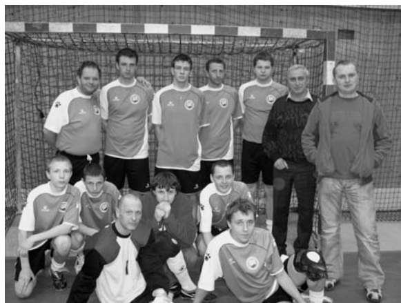
Drużyna LZS Beskid z Godziszki na gościnnych występach.