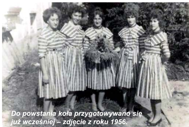
Do powstania koła przygotowywano się już wcześniej – zdjęcie z roku 1956.