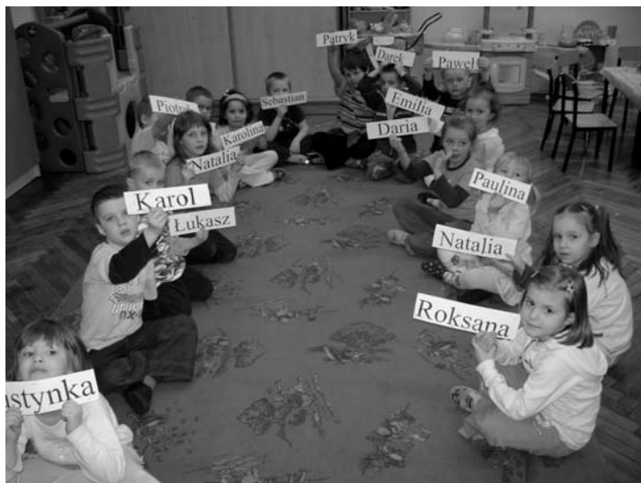
Dzieci w wieku przedszkolnym chętnie się uczą nowych umiejętności.