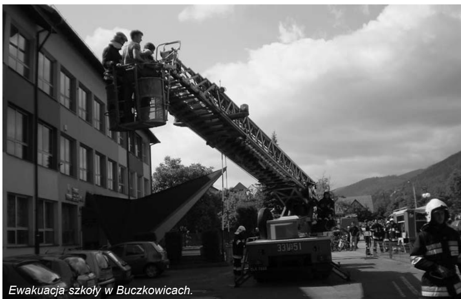
Ewakuacja szkoły w Buczkowicach.