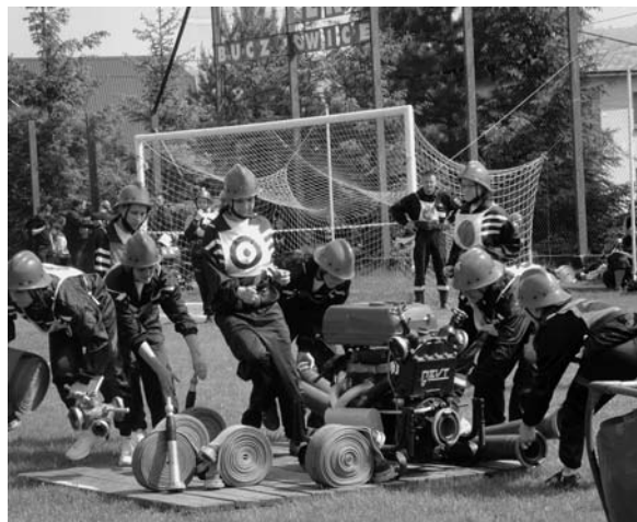
Zwycięska drużyna z Rybarzowic w trakcie rozwinięcia bojowego.