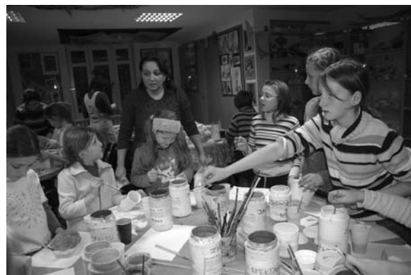
Dzieci na zajęciach w GOK.