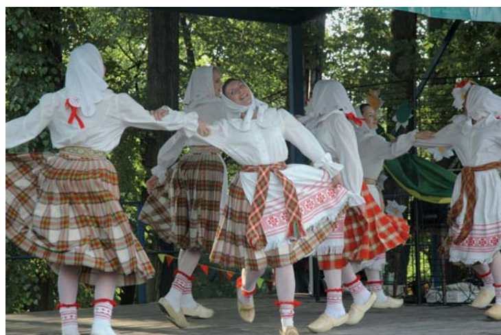
Tańczą goście z Litwy.

Piknik rodzinny, który odbył się 15 czerwca w Godziszce, okazał się świetną imprezą. Dopisała nie tylko pogoda, bo przez deszczowe chmury przebijało piękne słońce, ale również mieszkańcy Godziszki, którzy z ogromnym zaangażowaniem podziwiali program artystyczny zapewniony przez organizatorów przedsięwzięcia: Radę Sołecką Godziszki, Zespół Szkoły Podstawowej i Gimnazjum oraz Gminny Ośrodek Kultury w Buczkowicach.