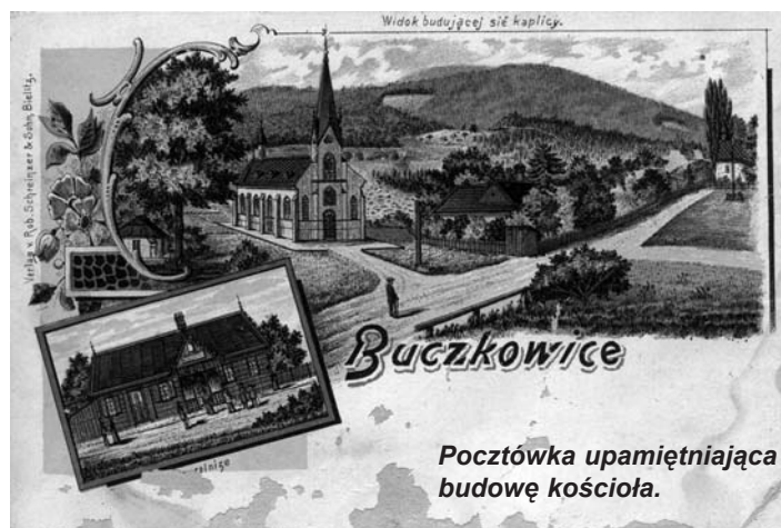
Pocztówka upamiętniająca budowę kościoła.

Wystąpienie ks. kardynała Franciszka Macharskiego uświadomiło parafianom, że z biegiem lat budynek kościoła w Buczkowicach stał się za ciasny dla rosnącej liczby mieszkańców.