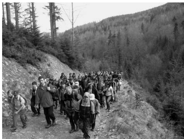
Uczestnicy rajdu na górskim szlaku.

żyną okazała się drużyna „Ziomków” z ZSO w Buczkowicach. Kolejne miejsca zdobyły drużyny: „Teletubisie-Reaktywacja” z ZSO w Buczkowicach, „Strong ryby” z ZSPiG Rybarzowice, „Black Sheep” z Buczkowic, „Geozjawa” z ZSPiG w Kalnej, „Białe Orły” z ZSPiG w Godziszce, „Narwani” z Buczkowic, „Misie Bimbrownisie” z Buczkowic, „Traperzy” z Bystrej i „Wędrowcy” z Mesznej.