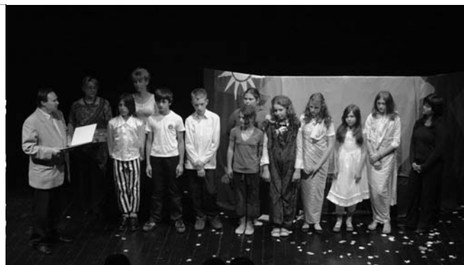
Zespół teatralny „Na niby” – laureat nagrody starosty.