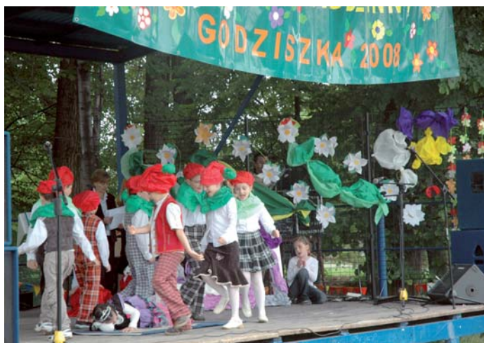
„Królewna Śnieżka” w wykonaniu pierwszaków.