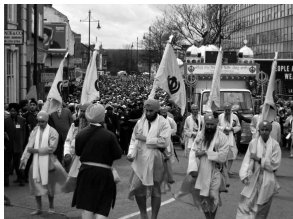
Na zdjęciach: Kino w Southall. Kobiety na targu. Obchody święta hinduskiego na ulicach Southall. Parada uliczna.