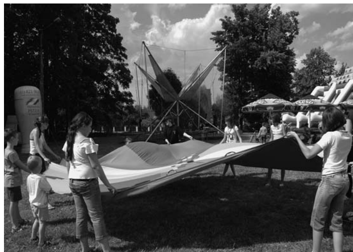
Zabawy z klanzą.