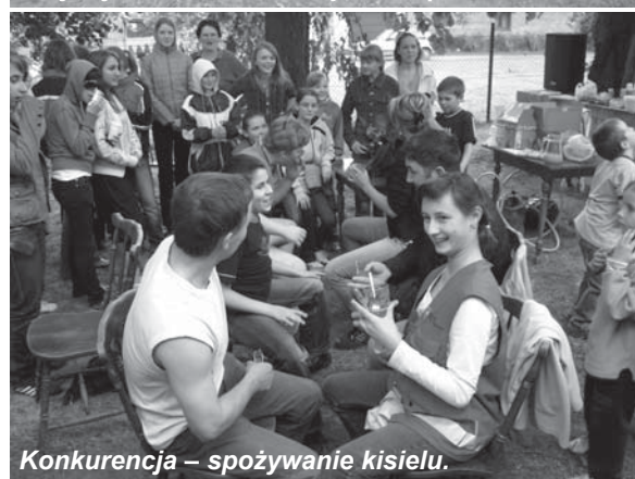
Konkurencja – spożywanie kisielu.