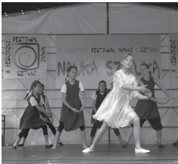
Festiwalowy występ grupy tanecznej z Kalnej.

Beskidzki Festiwal Nauki i Sztuki to impreza, której celem jest integracja środowisk naukowych, oświatowych i kulturalnych Podbeskidzia. W tegorocznym, jubileuszowym festiwalu, który odbywał się w dniach 29 i 30 maja, uczestniczyła również nasza gmina.