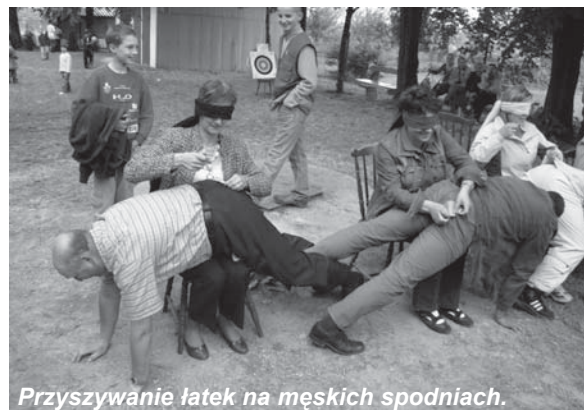
Przyszywanie łątek na męskich spodniach.