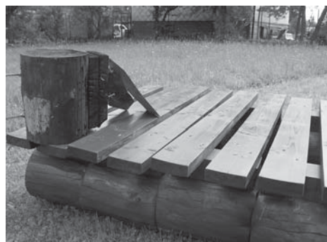
Pozostałości po spalonej ławce.

Koło PTTK w Buczkowicach przystąpiło do zagospodarowania szlaku turystycznego z Buczkowic na Skrzyczne. Rozpoczęto montaż ławek na odcinku polana Filipka – przełęcz Siodło. Niestety, żywot pierwszej ławki trwał tylko kilka godzin. Ławkę ustawiono i umocowano kotwami w betonie 23 maja o godzinie 17.00. Rankiem w niedzielę stwierdzono spalanie ławki i stojącego opodal „rogacza” z drogowskazami. Sprawę oddano w ręce miejscowej policji. Szkody wyceniono się na około 1000 zł. Ślady wskazują, że w miejscu zdarzenia przy źródle „Zimnik” odbyła się libacja alkoholowa, zostało wiele butelek po alkoholu, plastikowe opakowania – jednym słowem śmietnik.