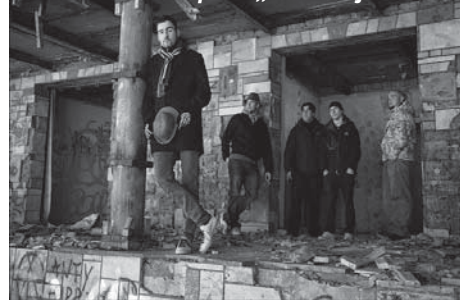
Członkowie zespołu „Afirmacja”.

cords” powstało demo „Afirmacji” pt. „Urywek wyrwany z kontekstu”, zawierające cztery utwory. Są one dostępne na stronie kapeli www.myspace.com/afirmacjabb .