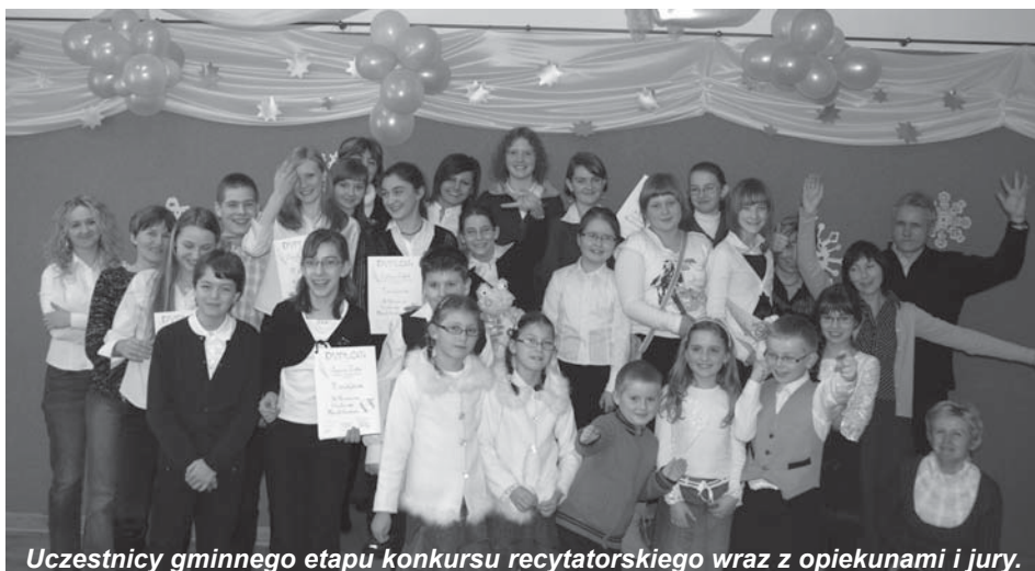
Uczestnicy gminnego etapu konkursu recytatorskiego wraz z opiekunami i jury.