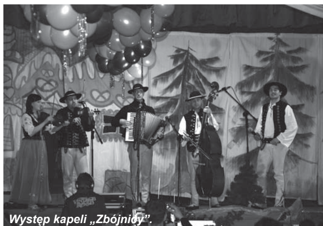
Występ kapeli „Zbójnicy”