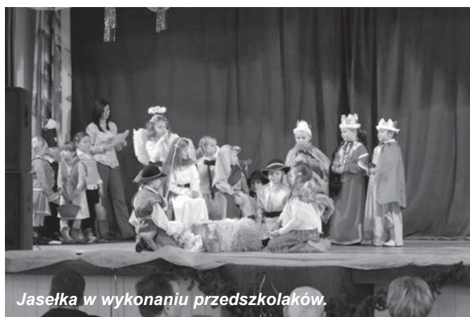
Jasełka w wykonaniu przedszkolaków.