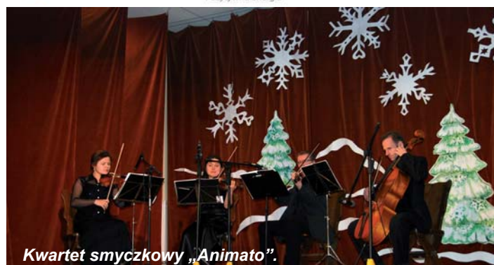
Kwartet smyczkowy „Animato”.