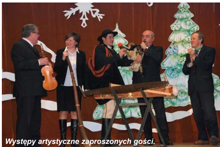
Występy artystyczne zaproszonych gości.