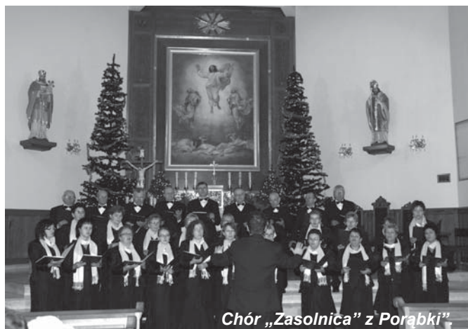
Chór „Zasolnica” z Porąbki